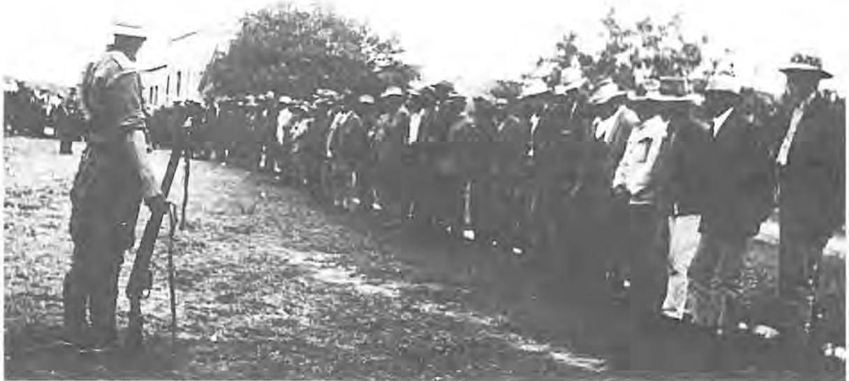
Polisie bewaak Bastergevangenes, 5 April 1925