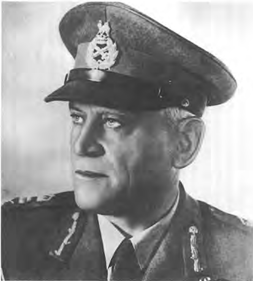
Pierre van Ryneveld