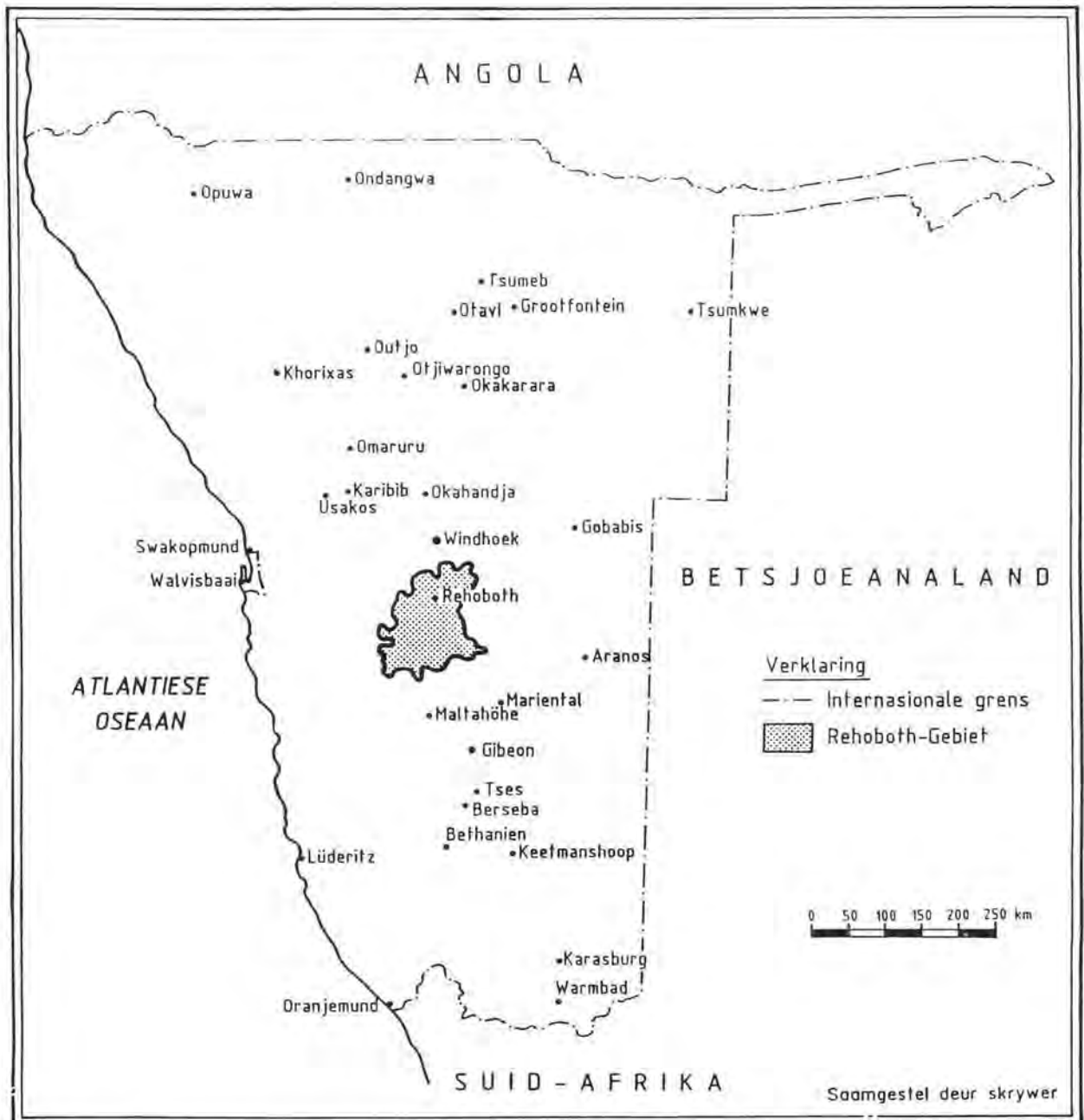
Ligging van die Rehoboth-Gebied in Suidwes-Afrika (Namibië)

soek om tydelik die bestuur van die Rehoboth-Gebied oor te neem. 9