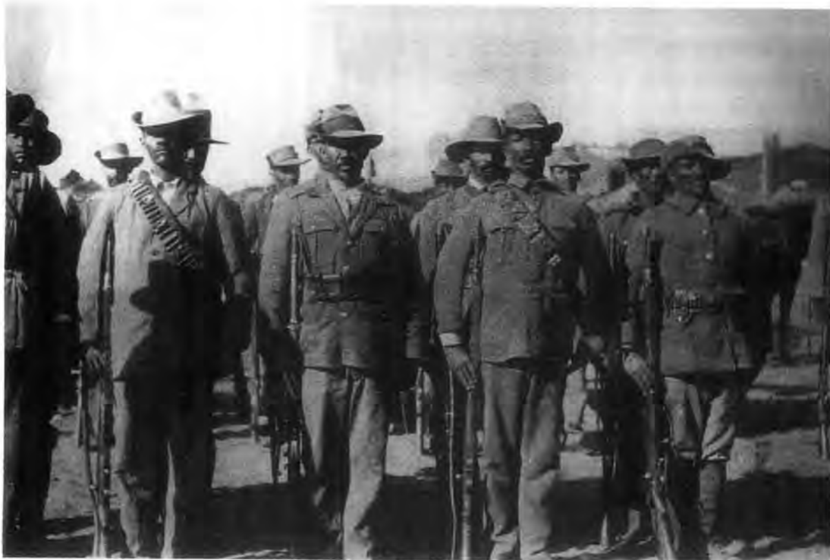
Bastersoldate, ca. 1895