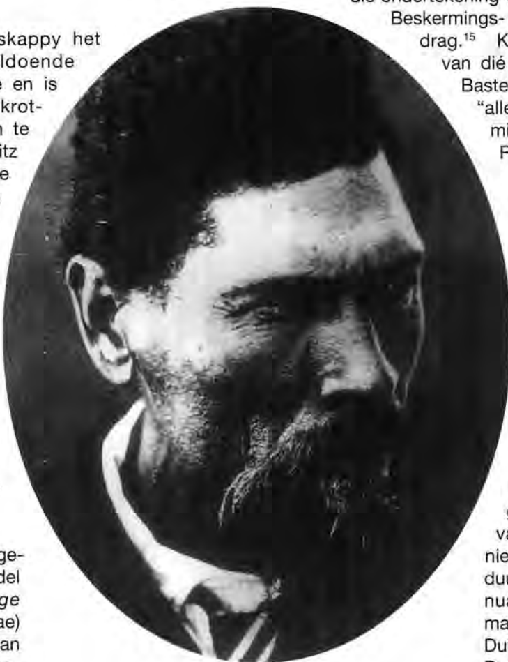
Hermanus van Wyk, eerste Kaptein van die Rehoboth-Basters.

1889 het 21 Duitse Schutztruppen onder leiding van kaptein Kurt von Francois in Duits-Suidwes-Afrika aangekom. 19 Weens onder andere die strategiese ligging van Windhoek, tussen die Herero's en die Witboois, het Von Francois in Oktober 1890 sy hoofkwartier daarheen verskuif. 20