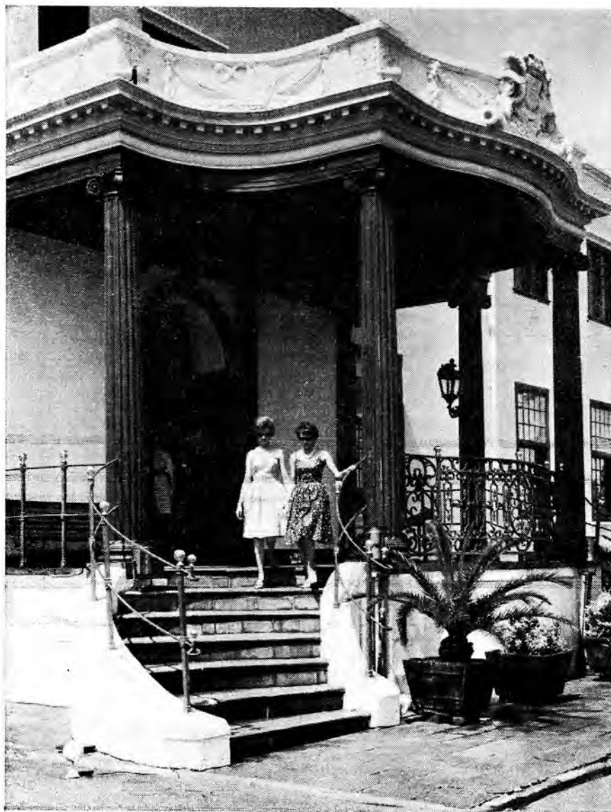
Die Kat-pui van die Kasteel, Kaapstad.