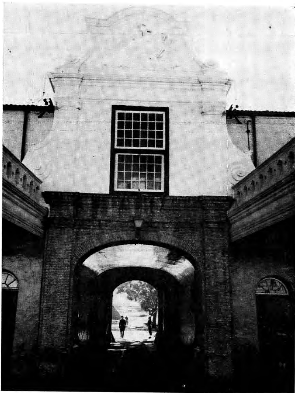
Die ingang tot die Kasteel vanaf die binneplein.