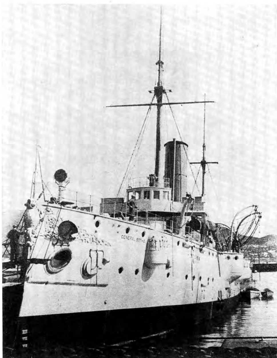
Die opleidingskip S.M.S.A.S. Generaal Botha .