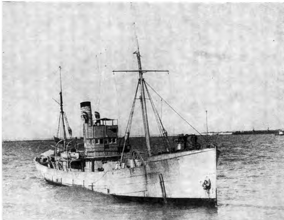
H.M.S.A.S. Sonneblom .