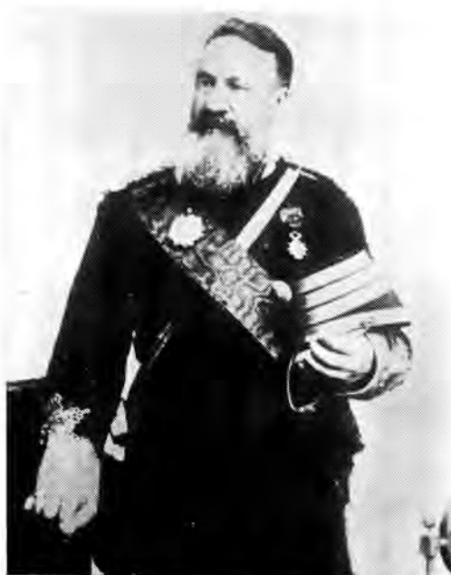
Genl Piet Joubert, Transvaalse Kommandant-generaal