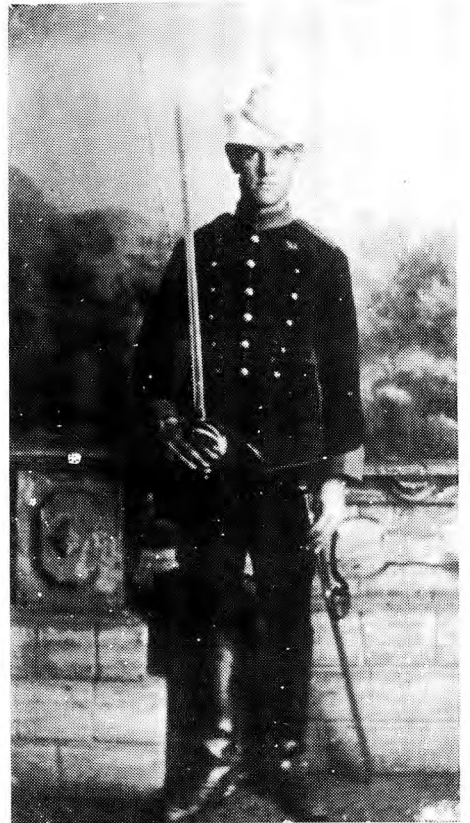
Luitenant van die Veldtelegrafie