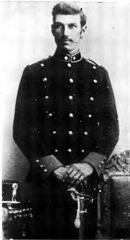
Tweede Luitenant (variasie)