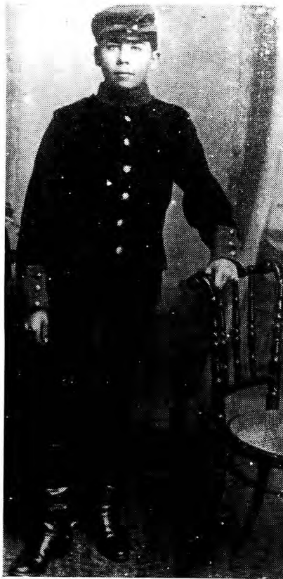
Manskap Rekrut 27