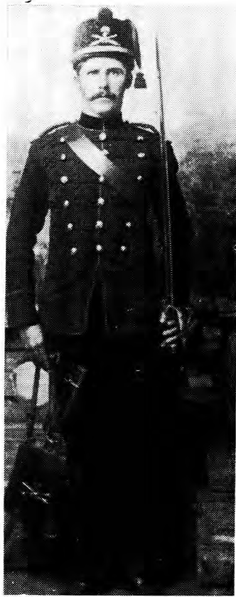
Parade Uniform van Manskap (een van verskeie variasies)