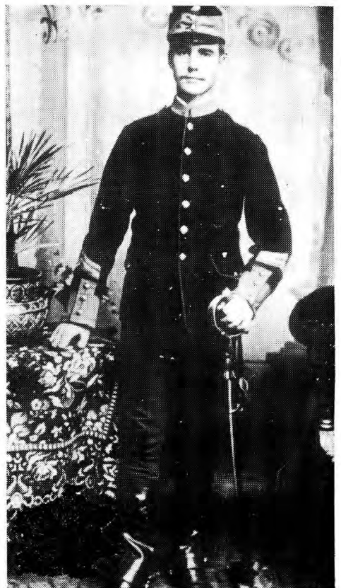
Wagmeester (een van verskeie variasies)