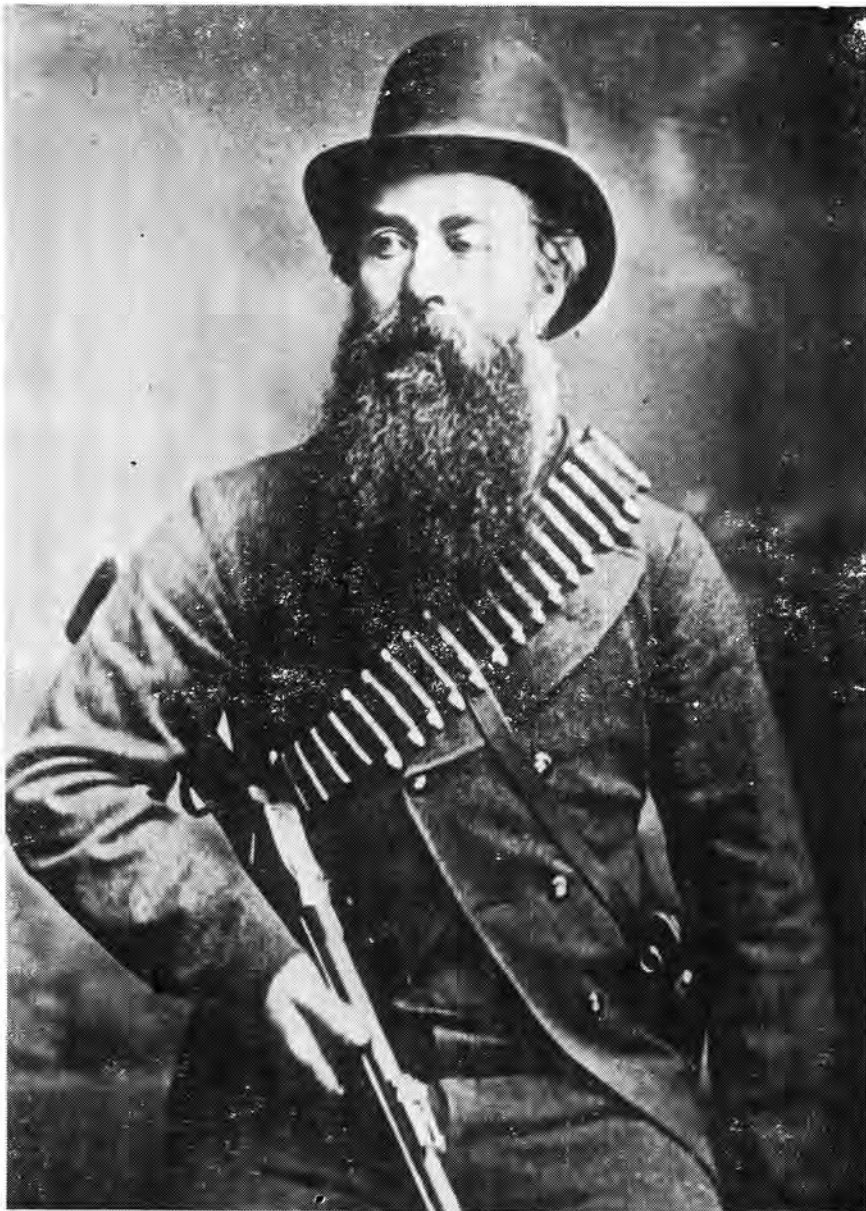
Genl P. A. Cronjé