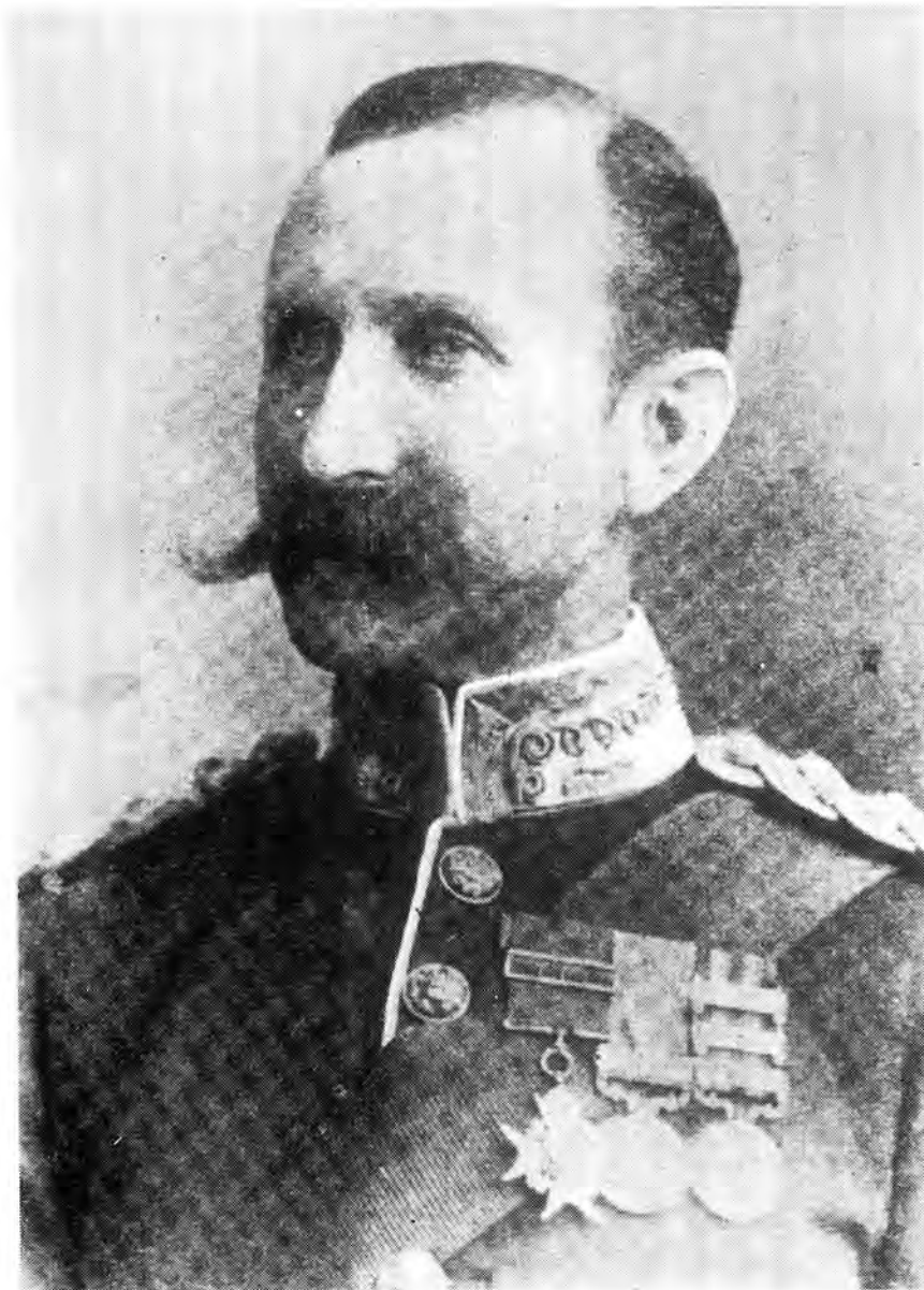
Gent-maj sir W. Penn-Symons, wat by Talana op 20 Oktober 1899 gesneuwel het