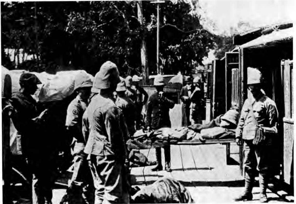
'n Hospitaaltrein arriveer by die Wynbergstasie. Die ambulanswaens wat links staan, is tot teenaan die peron getrek sodat pasiënte op trollies, direk in die waens gestoot kon word.

Alles denkbaar is in die stryd gewerp om die gewondes so flink moontlik te ontruim.