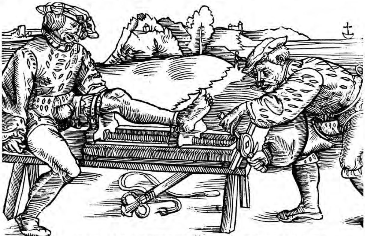
'n Sestiende-eeuse 'ruk-en-pluk' dokter besig om 'n knieskyf wat uitgegely het, te behandel.

Boonop het hulle meer status in die burgerlike lewe as in die leër geniet. So is dit duidelik volgens sy militêre kode dat Hendrik V van Brittanje, toe hy in 1415 Frankryk binnegeval het, sy skoen- en kleremakers hoërgeag het as sy mediese personeel. Die medici se rol op die slagveld is egter nie deur hom misken nie en beklee hulle in sy kode 'n ereposisie bokant die wasvroue! Geen geneesheer wat sy sout werd was, sou hom dus tot 'n pos in die leër aangetrokke voel onder sulke omstandighede nie. Daar-