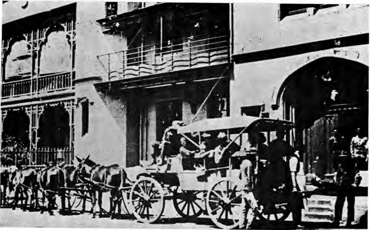
'n Ambulanswa met 'n span muile in die tuig.

Ten spyte hiervan sou die Tweede Vryheids-oorlog 'n hoë tol aan ongevalle eis wat voorkom kon gewees het indien faktore soos higiëne en sanitasie nie afgeskeep is nie. Hierdie aspekte moes nog steeds die rol van Aspoestertjie in die organisasie van die Royal Army Medical Corps vertolk. Daar is selfs so ver gegaan om die sanitêre-offisier se pos af te skaf en alle sake rakende kamp-higiëne en sanitasie is aan die regiments-adjutantoffisier oorgelaat. Dit het baie euwels tot gevolg gehad: drinkwater is nie vooraf gesuiver nie en gesondheidsregulasies in die kampe self is skreiend verwaarloos. Die beleg van Ladysmith het plaaslike toestande vererger. Siektes soos skeerbuik en ingewandkoors het op grootskaal toegeneem. Tydens lord Roberts se opmars het toestande in sy kolonnes ook versleg en ingewandkoors het epidemie-afmetings aangeneem toe hy in Maart 1900 Bloemfontein bereik het. No 9 Algemene Hospitaal is haastig in Bloemfontein opgerig om wal te gooi maar was spoedig so oorval met siekes dat die hospitaal, wat uitgerus was vir 520 pasiënte, soms meer as 'n duisend pasiënte tegelyk moes huisves. Die medici met hierdie beperkte fasiliteite tot hulle beskikking, was derhalwe nie in staat om die mas op te kom nie.