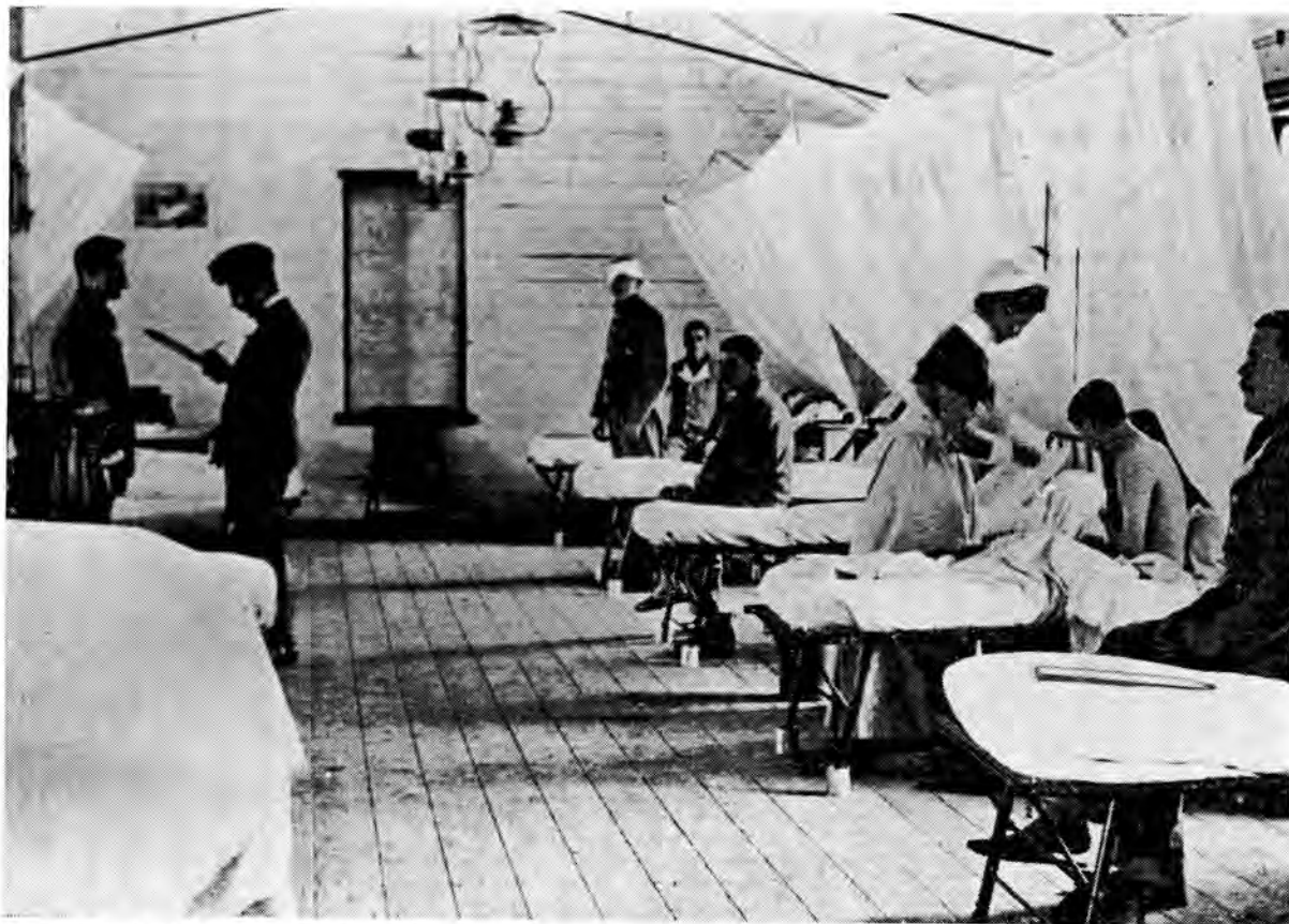
'n Saal in 'n algemene hospitaal. Die blikkieë onder die beddens se pote was met hoogs ontvlambare insekdoders gevul. Dié voorsorgmaatreël het beperkte sukses behaal aangesien die meeste insekte gevlieg het.

Wat die organisasie en funksionering van die Britte se mediese dienste betref, sou die beskikbare geneeshere en personeel verdeel word in veld-, vaste ('stationary') en algemene hospitale. Die veldhospitale sou naby