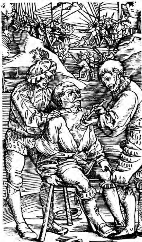
Geneeskunde was primitief. Hier word 'n pyl tydens die geveg uit 'n soldaat se skouer verwyder.

Hoewel mediese hulp op die slagveld gaaudeweg meer verfyn is, het dit nog nie al die fasette van menswees betrek nie. So is daar nie voorsiening gemaak vir probleme wat meer psigies van aard is nie. Die probleme het gespruit uit die feit dat oorloë