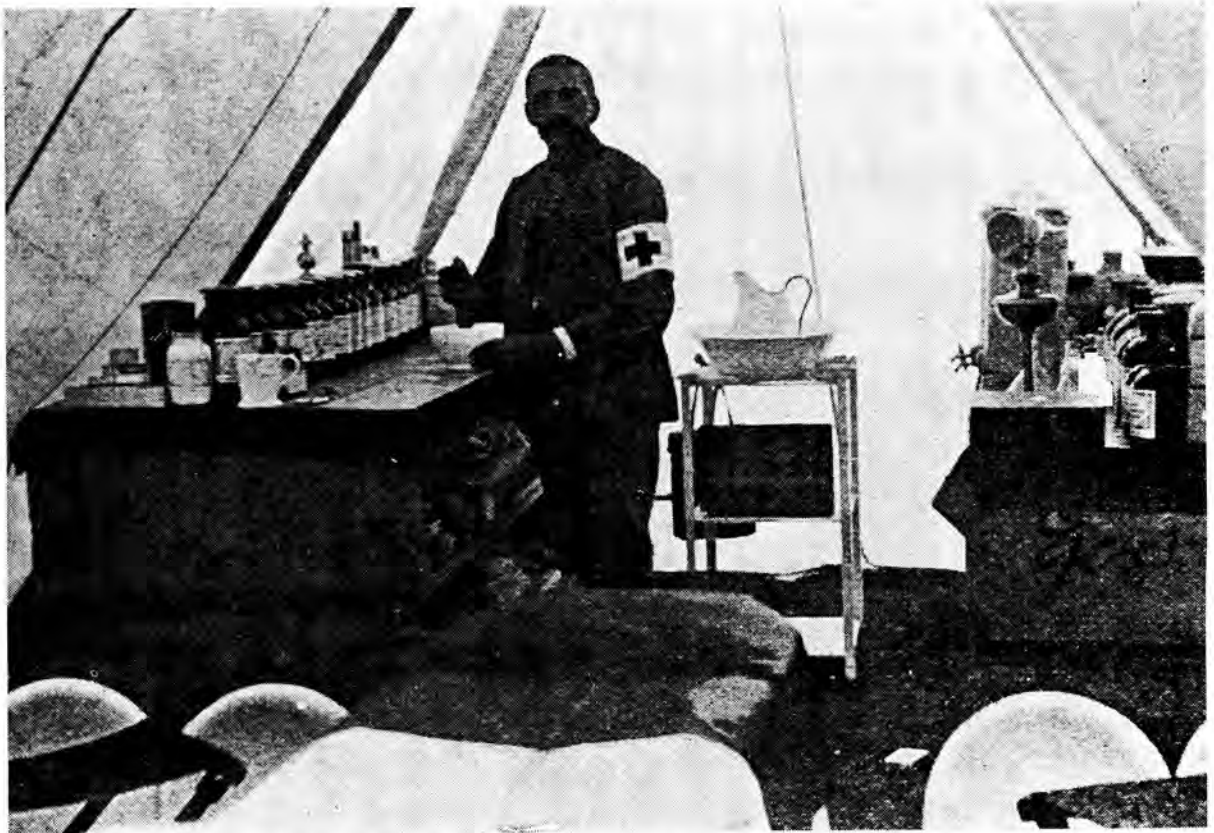
Die apteek- en operasietent van 'n Nederlandse veldambulans.

Aanvanklik het botsings tussen die Roode Kruis en die benoemde kommissie voorgekom, maar nadat die probleme en knelpunte uitgestryk is, het die Mediese Kommissie daarin geslaag om meer doeltreffend uitvoer-