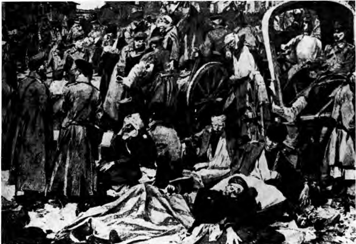
Bepaalde geriewe het gewoonlik ongevallesyfers verhoog terwyl gebrekkige afvoerfasiliteite die opeenhoping van gewondes tot gevolg gehad het.