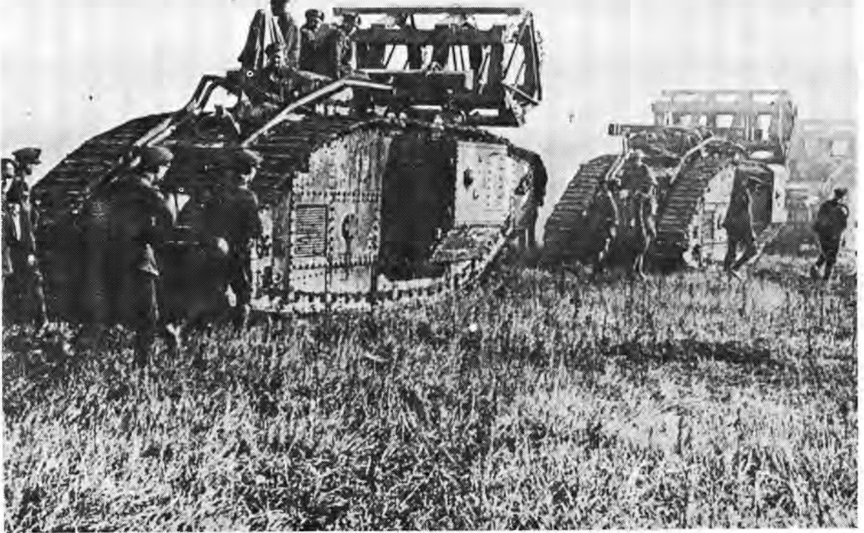
Die Britse Merk V tenks. Die draagbare brûe is gebruik om oor die breë loopgrawe van die Hindenburglyn te beweeg

aan hulle 'n groter vuurkrag en mobiliteit te verleen as aan enige ander kontemporêre formasie.