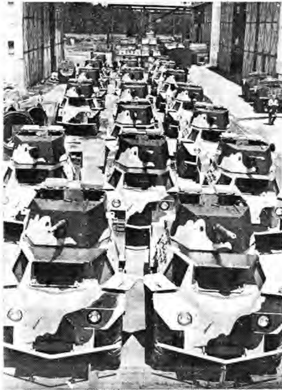
Voorbeelde van Pantsermotors vervaardig deur die Suid-Afrikaanse Direkteur-Generaal Oorlogsvoorrade teen R2 000,00 per motor tydens die Tweede Wêreldoorlog

Uit die politikus en die militêre ekonoom so oop punt is daar die een faktor wat pantsermotors of gewielde pantservoertuie bo tenks of ander gerusperde voertuie bevoordeel, naamlik die feit dat eersgenoemde voertuie vervaardig kan word uit onderdele wat vrylik vir openbare gebruik gekommersialiseer is,