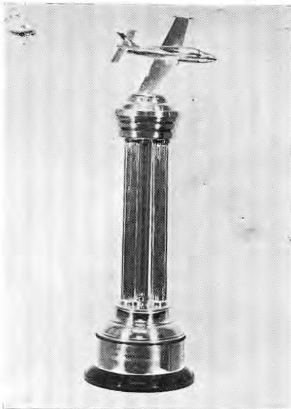
Die Atlas trofee wat jaarliks toegeken word aan die beste student in Impala vliegopleiding

stelsel gebruik te maak. Sodoende het hierdie vir sy tyd moderne toerusting, dit moontlik gemaak dat vliegtuie wat nie op D. F. Malan of elders as gevolg van swak weersomstandighede kon land nie, wel op Langebaanweg kon neerstryk. Die ou Gilfillan Radarstelsel het diens gedoen tot in Augustus 1973 en 49 410 aanlope is met hom uitgevoer.