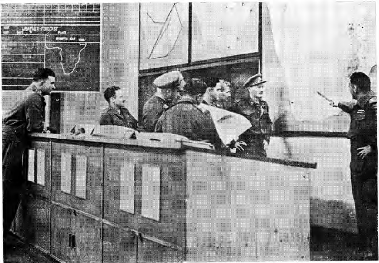
Voorbereiding vir 'n navigasie opleidingsvlug

'n Algemene reorganisasieprogram vir Lugmag funksionele kontrole is in 1950 van sta-