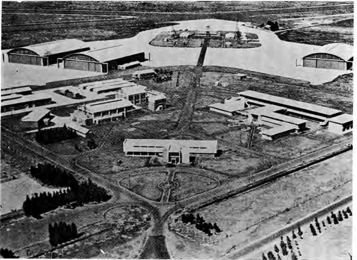
Vliegopleidingskool Langebaanweg

bonde aan die oprigting van die skool aansienlik laer kon wees as by ander terreine deur hom besoek. St Albans was eintlik in Port Elizabeth-distrik geleë en Bredasdorp kon nie voldoende water voorsien nie. Sy eerste keuse is dus Phesantekraal met Langebaanweg tweede en laastens Eersterivier. Teen sy verwagting in besluit die HGS op 17 Maart 1943 dat Bredasdorp ontwikkel moet word. Dieselfde middag is die beslissing gewysig en het It kol Makepeace opdrag ontvang om reëlins te tref vir die oprigting van 'n GR OTU by Langebaanweg en hierdie besluit het van krag gebly.