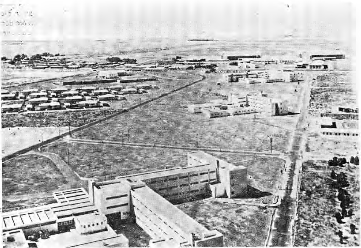
Menasie, enkelkwartiere en woonhuise in die agtergrond

Intussen het die ouers van skoolgaande kinders voor die netelige probleem te staan gekom dat hul kinders kilometers ver met 'n diensbus na Hopefield moes ry — die naaste