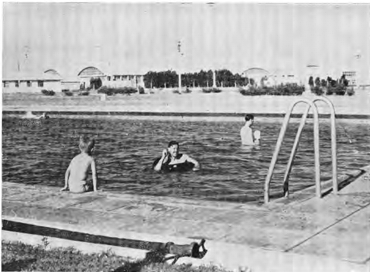
'n Swembad vir speel en werk.

Aanvanklik is besluit om grond tussen Saldanhabaai en Yzerfontein aan te koop vir bomwerp en sleepteiken skietoefeninge maar die gebied was te duur. Gevolglik is 'n rots in die see vir die doel afgesonder en gedurende 1947 is gedeeltes van die plase Oudepost en