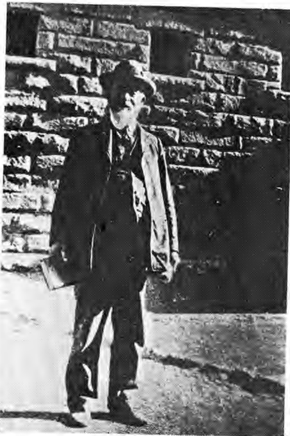
Genl. C. R. de Wet, rebelleleier, in die Bloemfonteinse gevangenis.