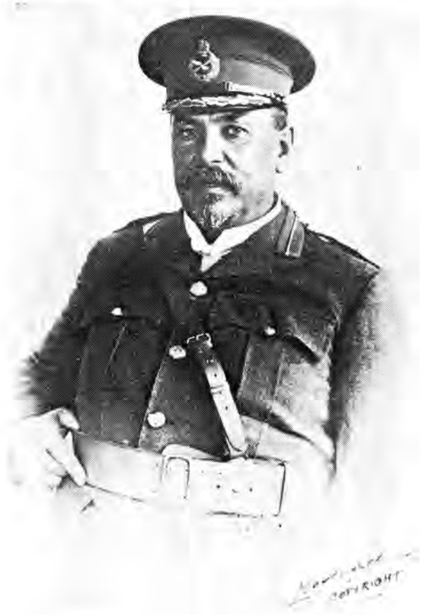
Genl L. Botha.

Hierdie versoek het Botha in 'n moeilike posisie geplaas, want dit het beteken dat hy magte oor die grens moes stuur. Sy Engelsprekende volgelinge, soos trouens ook die Unioniste, was gretig om teen die Duitsers op te trek. Botha se Afrikanervolgelinge was meestal lou en het nie veel omgee na watter kant die skaal geswaai het nie. Die Nasiona-