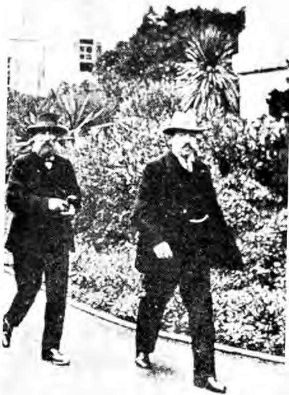
Genls L. Botha en J. H. de la Rey, wat jarelank saamgestaan het in die republikeinse en na-orlogse politiek, se weë het finaal op 12 September 1914 geskei voor die parlamentsgebou in Kaapstad.

De la Rey het nie aan die stemming deelgeneem nie, maar onmiddellik na sy toespraak