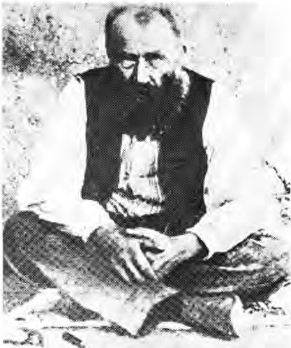
'Siener' van Rensburg.

'Siener' was en 'n onwrikbare geloof in sy gesigte getoon het. 18