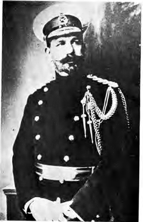
Kmdt-genl C. F. Beyers.