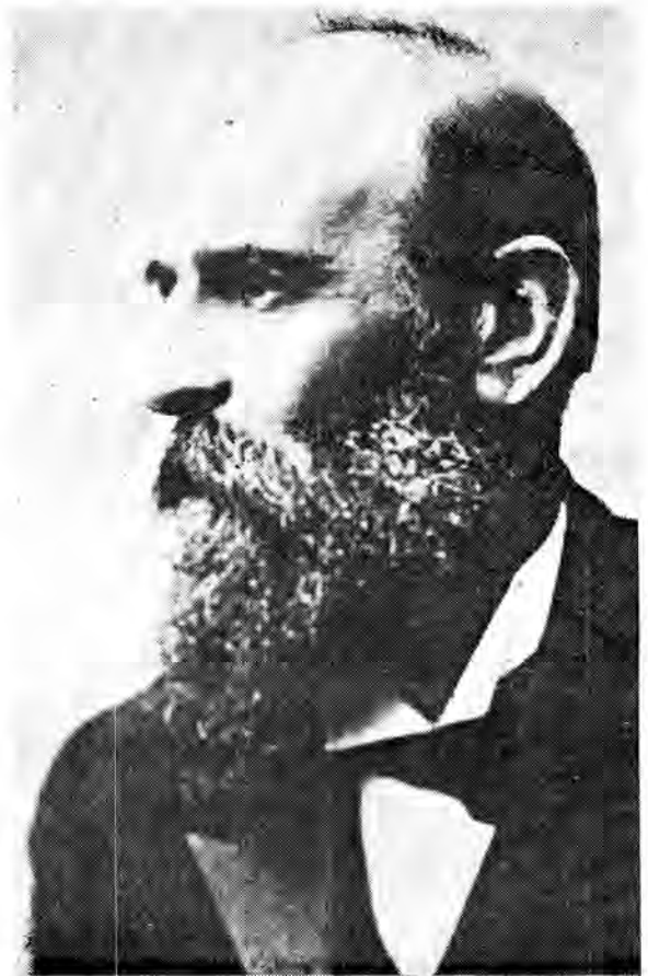
Genl. J. H. de la Rey.

Om hierdie ideaal te verwesenlik het beteken dat die stryd weer teen Brittanje aangeknoop moes word. Aan wapengeweld net na 1902 kon nie gedink word nie, omdat Brittanje hom onteenseglik as die meerdere bewys het en weens die feit dat die Afrikaner