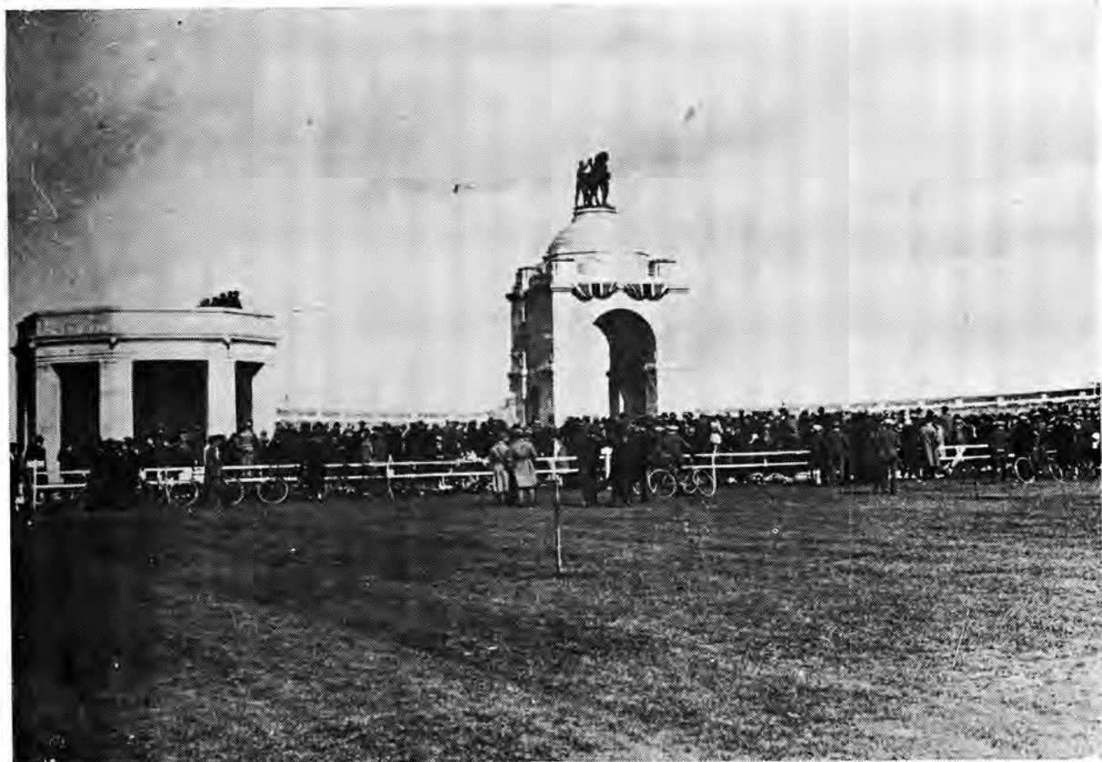
Die gedenkteken te Delvillebos

Die winter het nou begin en steeds was die 1ste Suid-Afrikaanse Infanterie Brigade daar om gapings te vul en hulp te verleen waar nodig. Veranderde omstandighede het reorganisasie teweeggebring. Lukin is op 30 Novem-