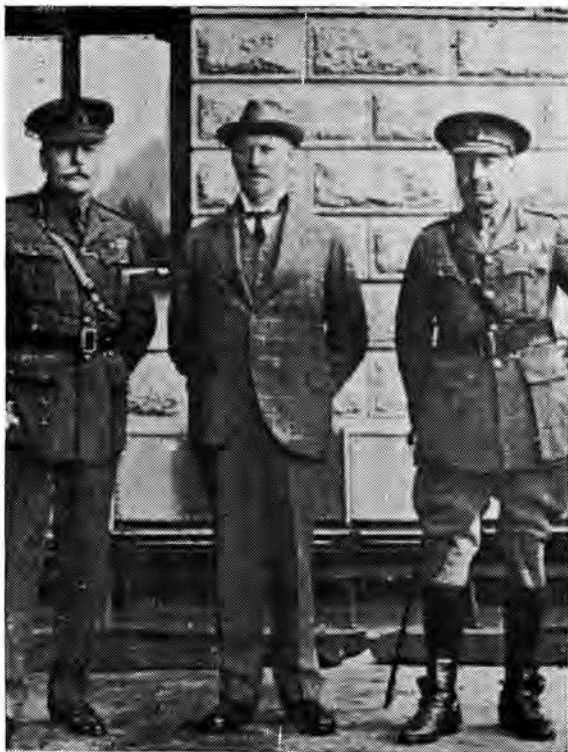
Genl sir Douglas Haig, genl Smuts, en genl Lukin, 1921