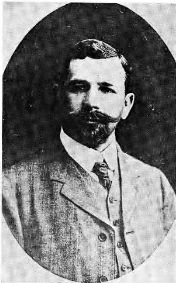
Genl C. F. Beyers

Met die uitbreek van Wêreldoorlog I het die Botha-regering onderneem om 'n ekspedisie-mag na Suidwes te stuur om die gebied te beset. Vervolgens word Lukin in Augustus 1914 gelas om die Staande Mag by Steinkopf, sowat 80 km suid van die Oranjerivier te konsentreer. Hy moes noordwaarts beweeg en aansluit by ander eenhede onder Beyers wat vanaf Upington sou opruk. Voordat laasgenoemde plan egter tot uitvoering gebring kon word, het genl Beyers bedank as Kommandant-generaal en homself aan die hoof van die gewapende protes (rebellie) teen die Unie-regering, geplaas. Ondertussen het Lukin op 20 September sy basis by Steinkopf opgerig. Onder sy bevel het vier regimente SABS, die Witwatersrand Rifles en drie batterye Transvaal Staatsartillerie geressorteer. 61 Teen 24 September 1914 het Lukin reeds tot teen die rivier gevorder, maar kol S. Maritz se verraad het genl L. Botha veplig om eers die rebellie te onderdruk. Gevolglik word