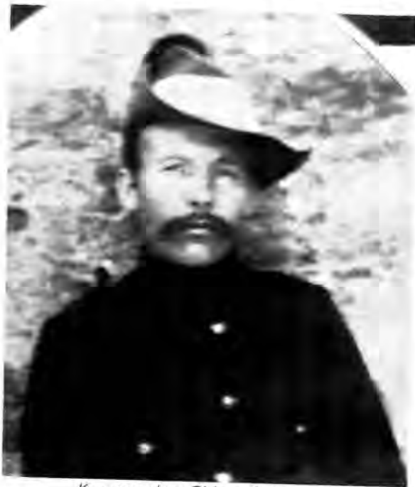
Kommandant Gideon Scheepers.