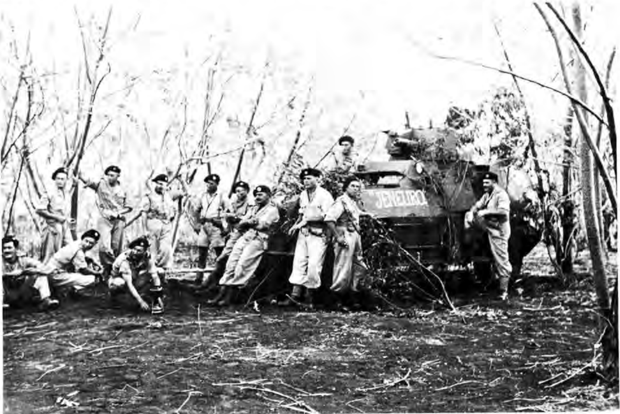
Suid-Afrikaners by 'n pantsermotor.