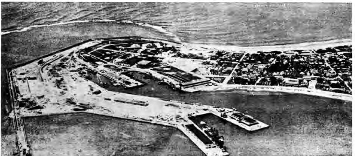
Tamatave, 1942.