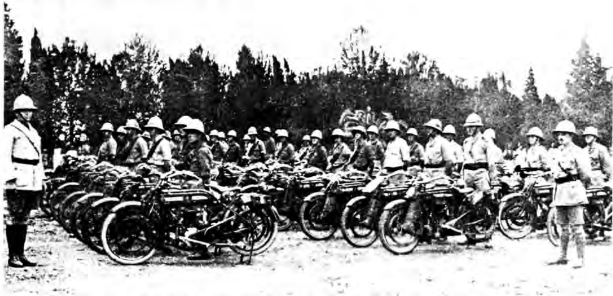
Lede van die Suid-Afrikaanse Motorfietskorp te Zomba, Nyasaland.

teen die Duitse magte wat daarheen opgetrek het. Hier was hulle vir drie dae lank in hewige gevegte met die Duitsers betrokke. Hoewel Von Lettow Vorbeck, die aanvoerder van die Duitse magte in Oos-Afrika, 'n uitstaande bevelvoerder en strateeg was, moes hy egter op 28 Augustus terugval. Slegs 'n aantal skerpskutters het agtergebly om sy agterhoede te dek.