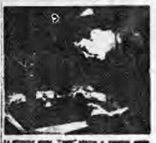
An attractive young "warrior" admires a miniature picture depicting a typical "warrior" scene of the soldiers of the Spring Flower Force in Sicily.

WELKE ENKE BERICHTEN Bloemfontein, Versaap. Die leiding van die leërslede, veronderstel om te sê, is die beste leiding wat ooit in die Suid-Afrikaanse leërslede gesien is. Die leërslede is die beste leiding wat ooit in die Suid-Afrikaanse leërslede gesien is. Die leërslede is die beste leiding wat ooit in die Suid-Afrikaanse leërslede gesien is.