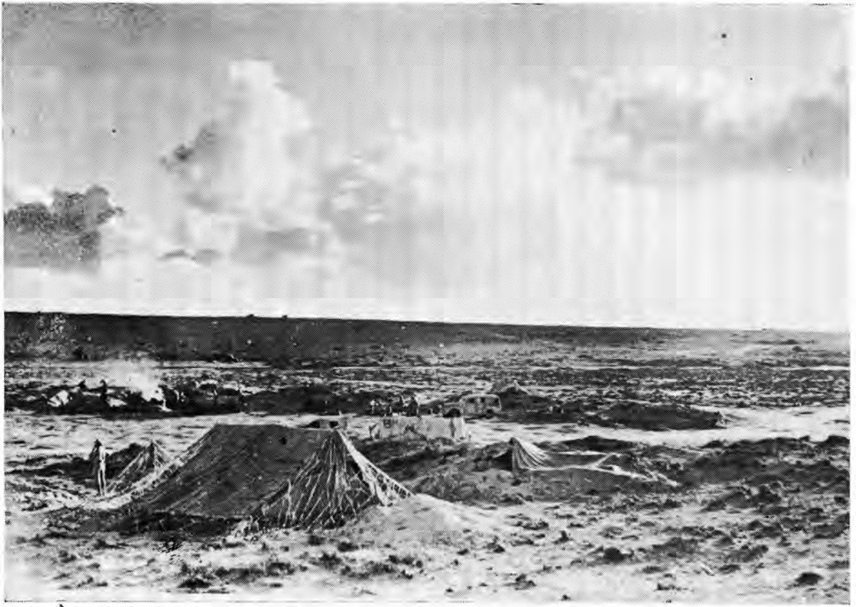
SAOB se frontperskamp by El Alamein. Die kamp was geleë tussen die pad in die kus naby die HK van 1 SA Divisie

Die statiese periode wat op El Alamein gevolg het, het min stories vir die Publisiteitsseksie vir versending na die tuisfront opgelewer. Dit het die gevaar meegebring dat die mense tuis belangstelling in die oorlog sou kon verloor. Gelukkig is in hierdie stil tyd die Victoria Cross aan sers Quentin Smythe toegeken. 'n Frontpersoffisier het die volgende dag hieroor die volgende brief aan die Hoofpersoffisier gestuur: