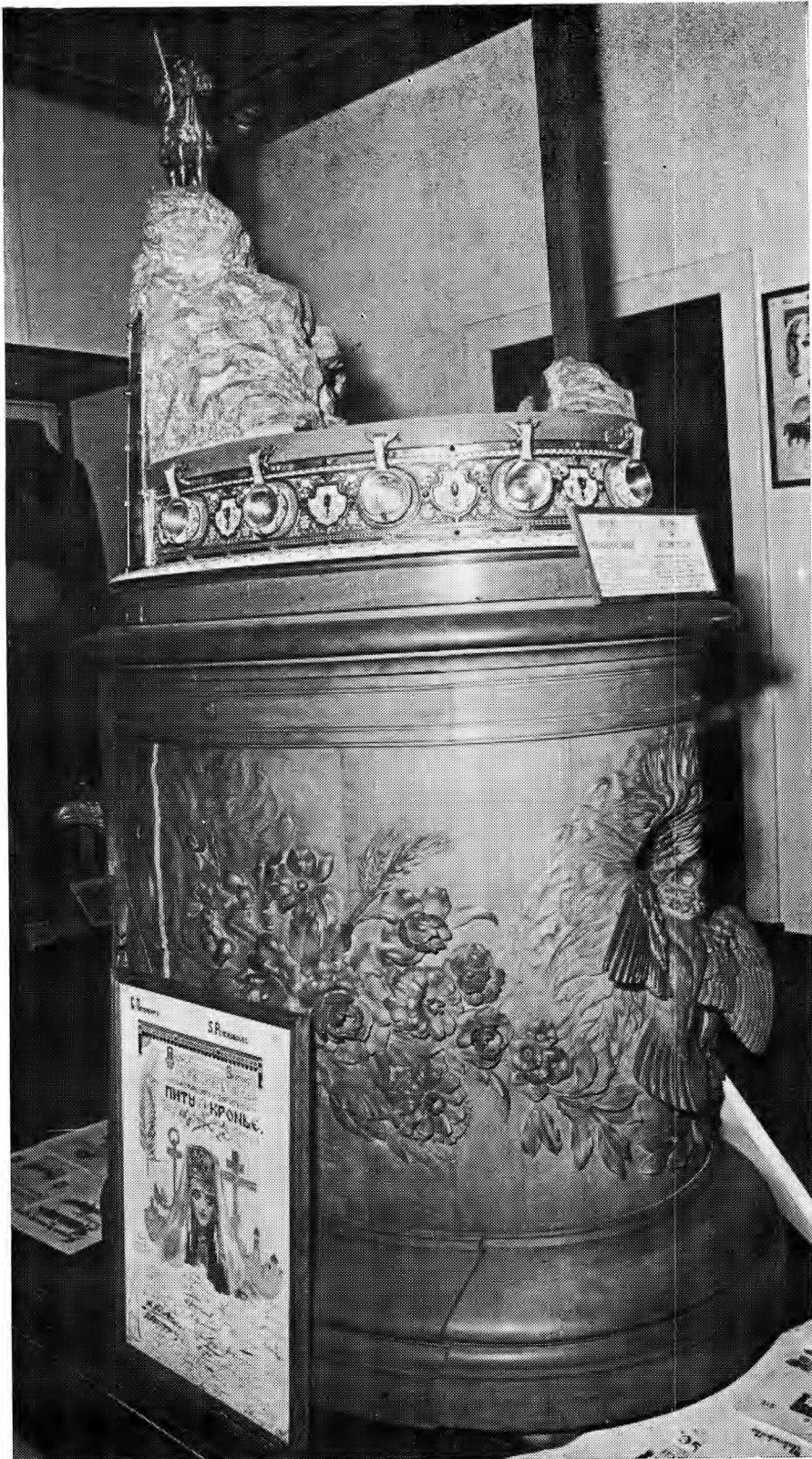
Die bratina wat deur die argitekte Schoené en Tchaguine ontwerp is