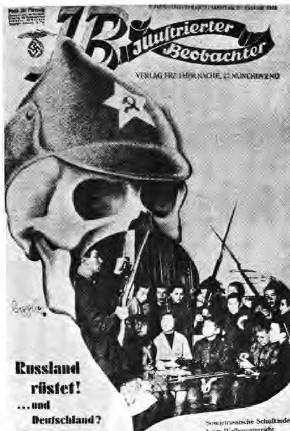
'Rusland bewapen ... en Duitsland?' Burgerlikes word opgeroep tot die stryd.

'n Medium van besondere betekenis wat deur die Kommunisme aangewend word, om buitelandse propaganda te versprei, is front-organisasies. Daardeur word kommunistiese propagandiste in staat gestel om groepe en individue te beïnvloed wat normaalweg nie bereik sou kon word nie, vanweë hul weiering om aan 'n openlik-erkende kommunistiese organisasie te behoort. Onder die voorwend-