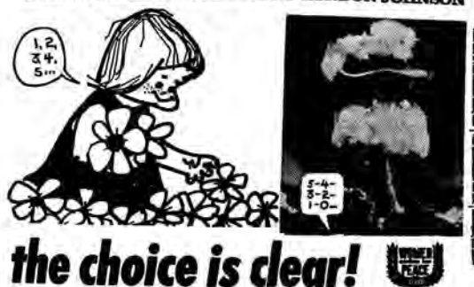
Pleidooi om wêreldvrede.

"Since last November, I have lived every waking hour mindful that a nuclear war would mean in one hour an American death toll equal to 300 World War II's." - PRESIDENT LYNDON JOHNSON