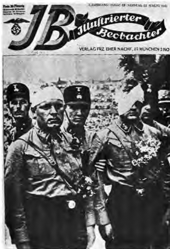
(Foto Z.A.B. Zeman: Nazi Propaganda in 1932. Die byskrif lui: 'Hulle het vir Duitsland se vryheid gely.'

Die liggaam in die Sowjet-Unie wat belas is met alle propaganda-aktiwiteite, binnelands sowel as buitelands, staan bekend as Agitprop , oftewel die Departement van Agitasie en Propaganda van die