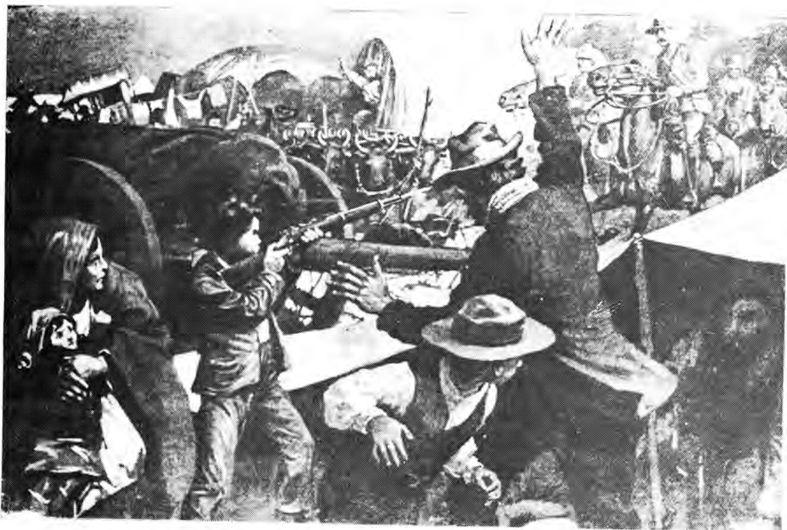
Seun verdedig manhaftig 'n vlugtelingaer wat deur Britse magte oorval is.

Suid-Afrika laas tydens die Anglo-Boereoorlog werklike ongerief beleef het. Wêreldoorlog I en II is deur vrywilligers ver van Suid-Afrika af gevoer. So ook die Koreaanse Oorlog. Vir bykans 74 jaar het Suid-Afrika dus 'n gemaklike en onbesorgde lewe gelei. Baie min ander lande was vir so 'n lang tyd van onrus gevrywaar. Dit het natuurlik die nadeel dat die Suid-Afrikaners nie geredelik ontberings kan of wil aanvaar nie.