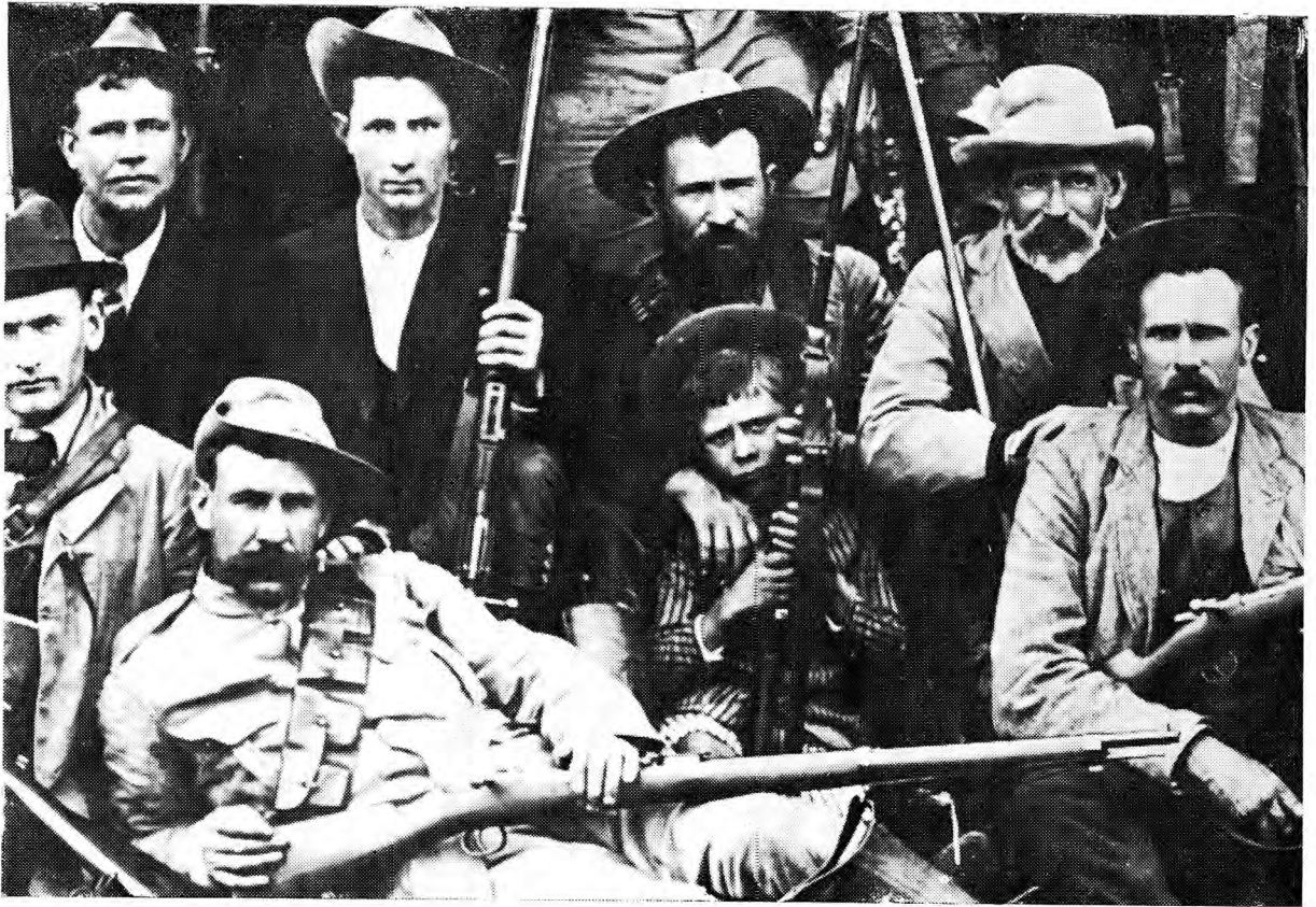
Oud en jonk besied met een ideaal.