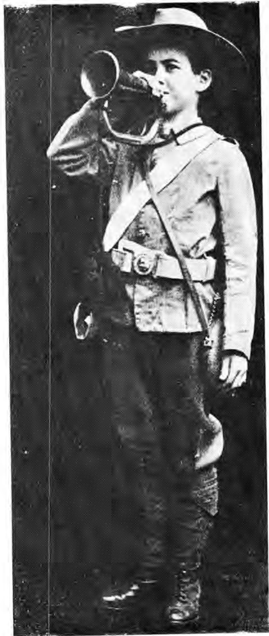
'n Trompetblaser van die 'Rand Rifles'.

Die opleiding van soldate verander met die verloop van tyd, maar die besieling van vaderlandsliefde en die wil tot voortbestaan, bly immer onveranderd.