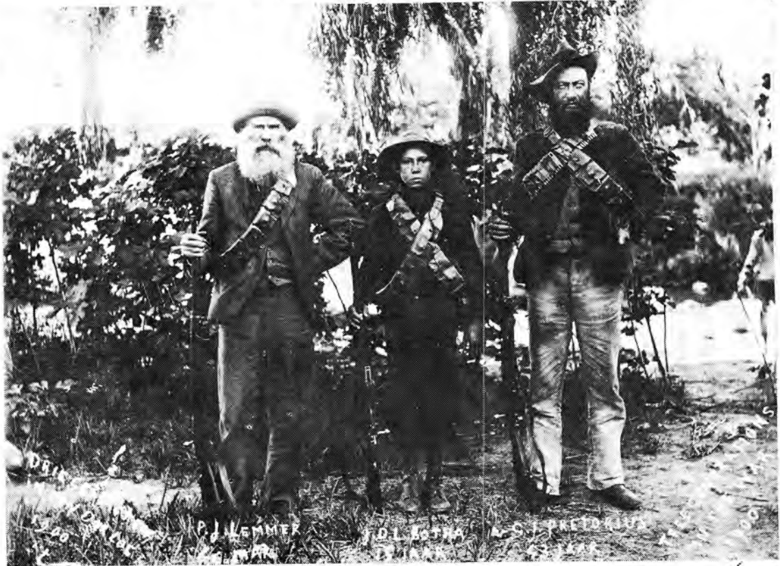
Drie geslagte gelyktydig in diens van hulle land.