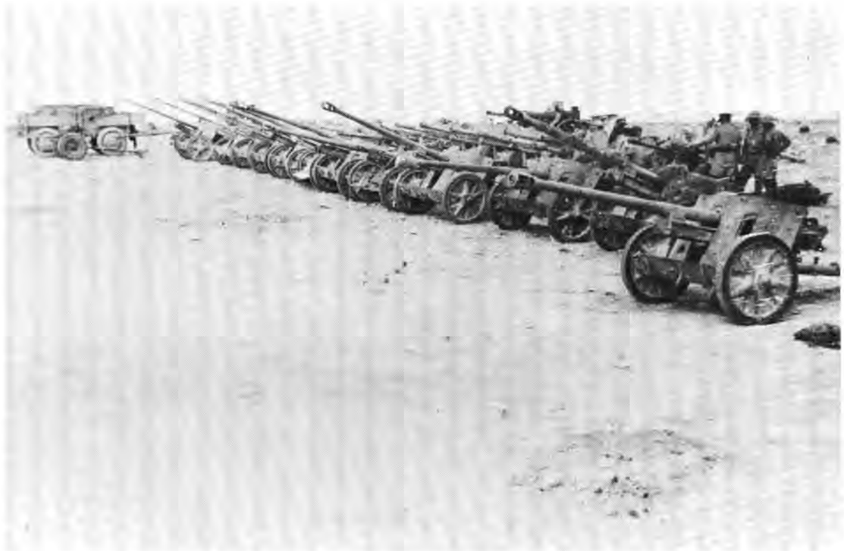
Wapens versamel deur 1 SA Bde na die Slag van Alamein, Nov 1942