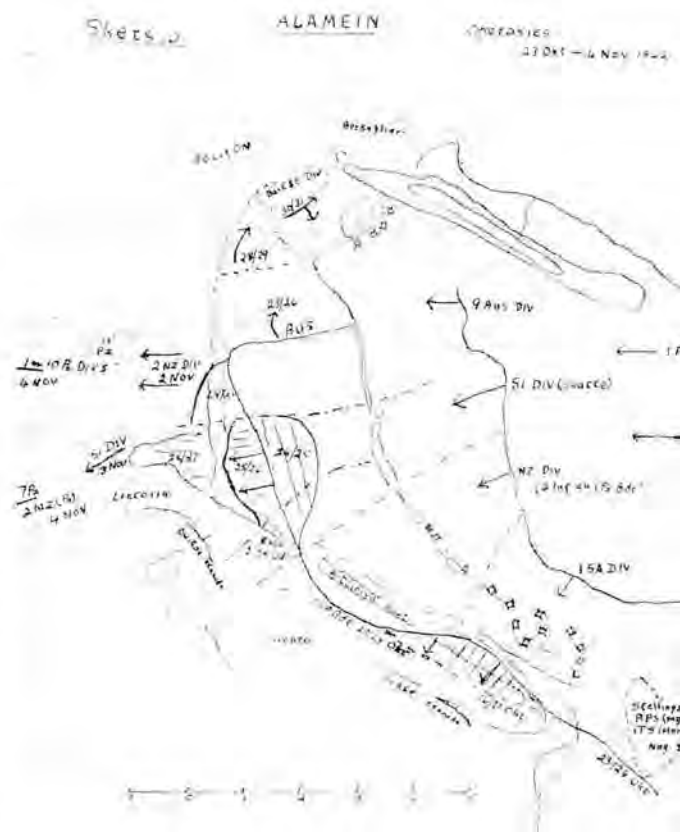
Alamein: Operasies 23 Okt — 4 Nov 1942

Teen die noordelike gedeelte van die vyandelike lyn sou vier divisies deelneem aan die aanval. 1 SA Divisie, suid, met doelwit die oostelike helfte van Miteiyya Ridge, 'n rant sowat twee myl voor ons stellings. Die westelike helfte van hierdie rant was die taak van ons ou rugby opponente, die All Blacks. Hierdie divisie het beskik oor een pantserbrigade. Verder noord was 'n Skotse Divisie, 51 Hoogland Divisie, en heel in die noorde, ons ou vriende, 9 Australiese Divisie. Die plan van genl Montgomery was kortliks, om in 'n nagaanval die hoofstelling van die vyand binne te dring met infanterie, sodat die pantser gebruik kon word om op twee plekke deur te breek en so die vyandelike pantser aan te durf. Hierdie plan is persoonlik aan ons verduidelik (sien skets 10).