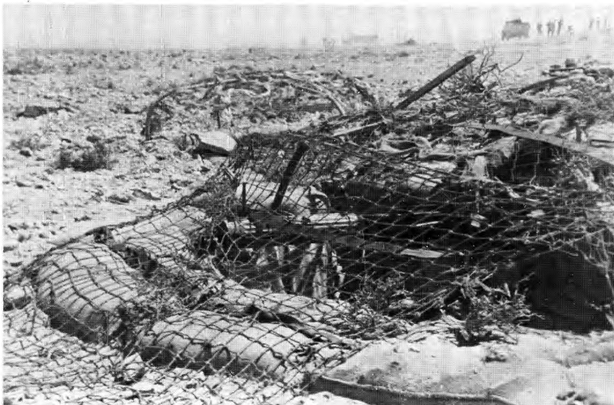
Masjiengeweerstelling in die woestyn.