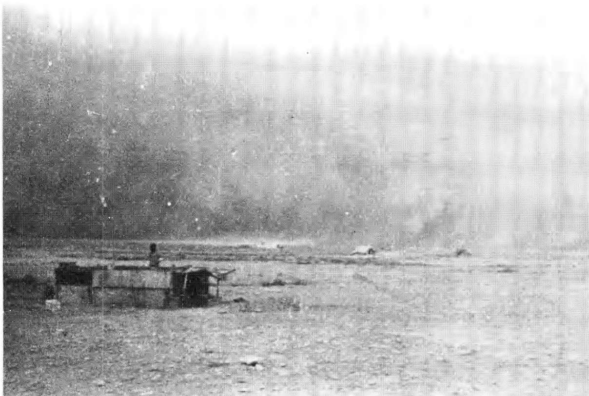
Stofstorm, Gazala 1942.