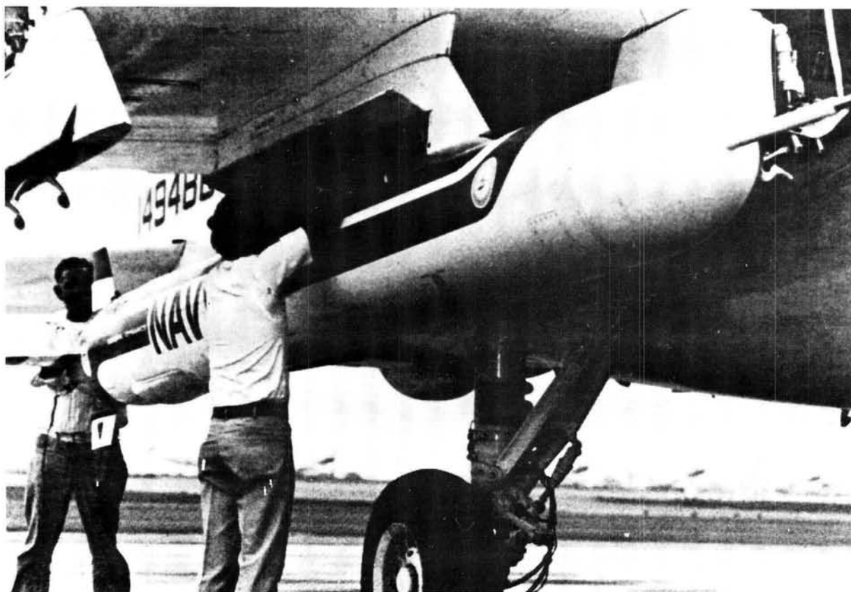
Die Tomahawk-kruisermisiel kan vanaf 'n verskeidenheid van platforms lanseer word. Hier word dit op 'n VSA Vloot A-6 Intrudervliegtuig gelaai.

1974 het die ontwikkeling van 'n strategiese 'air-launched cruise missile' (ALCM) 'n aanvang geneem ten einde die potensiële aanwending van die kruisermisiel-tegnologie verder te eksploteer. Op 13 Februarie 1976 is die eerste toetsvlug van die duikboot-gelanseerde kruisermisiel onderneem en met die aanvang van die tagtigerjare was die kruisermisiel reeds vanaf 'n verskeidenheid lanseerplatforms getoets, soos die duikboot, bomwerper, voertuig en skepe. 17