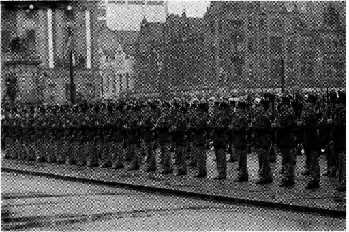
Republiekdag 31 Mei 1961 te Pretoria Inhuldiging van die eerste Staatspresident