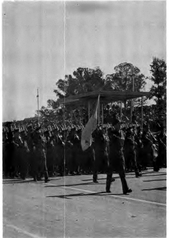
Die SA Weermag tydens die Republiekfees 1966