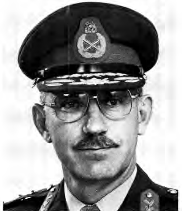
Lt-genl R.F. Holtzhausen, SM Hoof van Staf Personeel sedert 1 Januarie 1981

Gedurende 1915 is die pos Staf-offisier, Generale Staf hernoem na Hoofstaf-offisier, Generale Staf en Adjudant-generaal (AG). Hierdeur is die personeelfunksie erken as afsonderlike staffunksie, maar dit was egter nog 'n 'tweehoed' -aanstelling en die posbekleër vir beide die poste