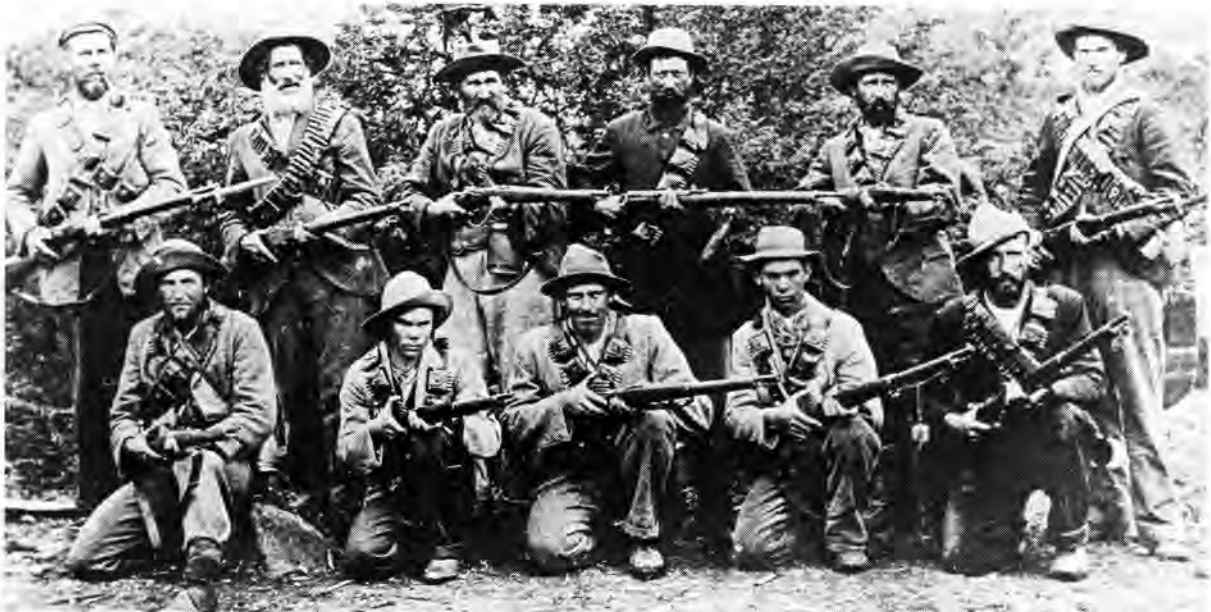
'n Groep Boerekrygers te velde in die Tweede Vryheidsoorlog. Ondanks die felle invloed van eksterne fisiese faktore op die Boeremagte se moreel, kon hulle drie jaar lank die stryd volhou en selfs teen die einde was daar baie wat bereid was om voort te veg

Die finale toets vir moreel aldus Baynes, is of jy bereid is om jouself op te offer. 25 Railey het in sy verslag die moreelkrisis van die Amerikaners in 1941 aan nasionale onsekerheid toegeskryf. Hy stel dit dat as die Amerikaanse politieke leiers 'n militêre doelstelling gehad het, hulle dit nie aan die leër verduidelik het nie. 26