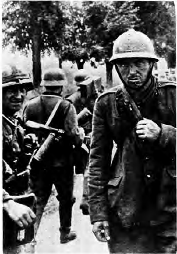
Duitse soldate en 'n Franse krygsgevangene tydens 'n veldslag in die Tweede Wêreldoorlog. Faktore soos 'n effektiewe propagandamasjien, deeglike militêre skoling en totale volksbetrokkenheid het 'n hoë moreel by die Duitse soldaat ingeskerp

king, 'n trots om gekies te wees as soldaat van die vaderland. Die Duitse soldaat is deur homself en deur die nasie as lid van 'n bevoorregte burgerskap beskou. 10