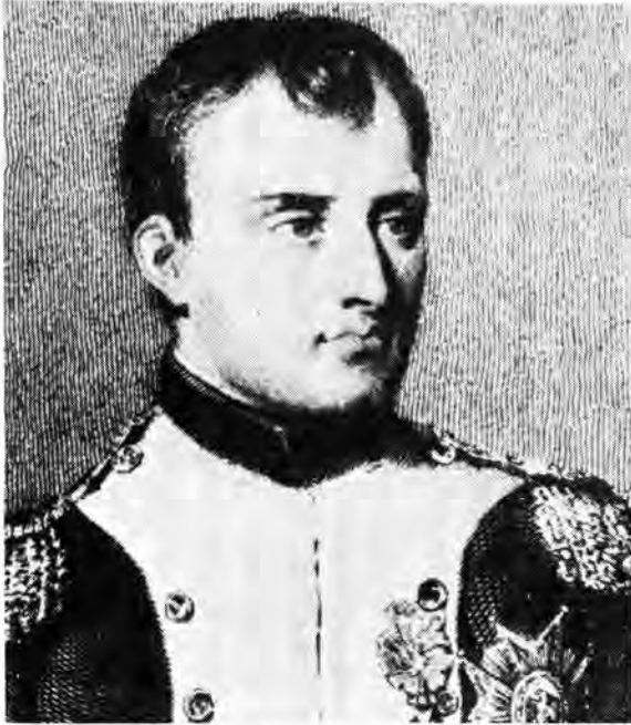
Die Franse veldheer Napoleon Bonaparte wat deur sy besielende leierskap en charisma 'n hoë moreel by sy soldate ingeboesem het

veggees enige leër met 'n lae moreel en 'n swak gees wat drie keer talryker is, kan verslaan. 5