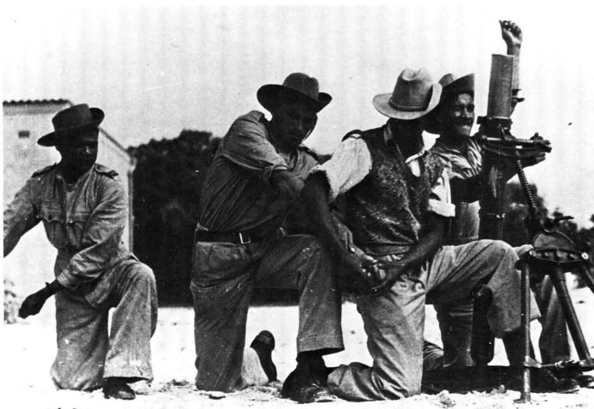
Lede van die Kaapse Korps besig om met mortiere te oefen tydens die Tweede Wêreldoorlog