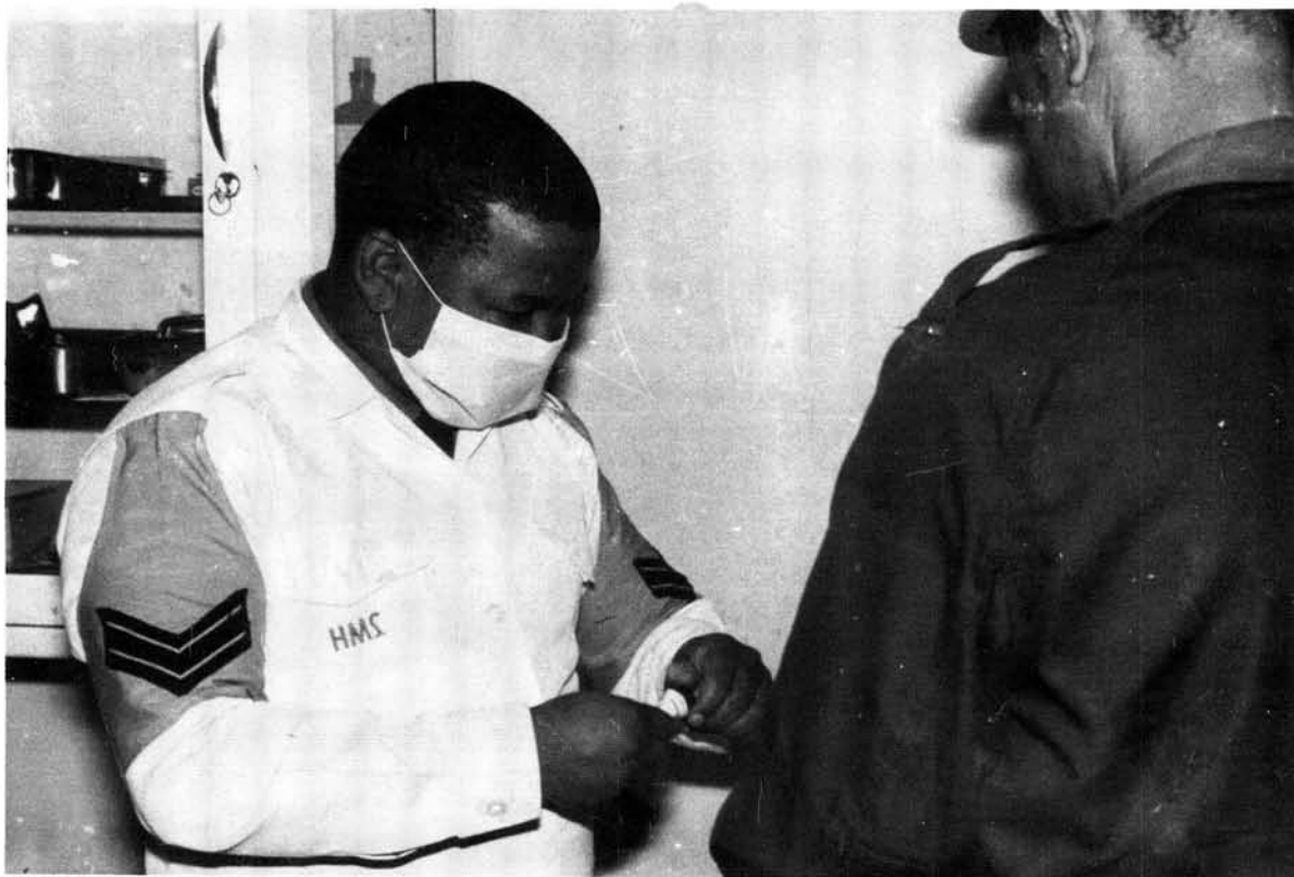
Mediese hulp word deur 'n lid van die Kaapse Korps verleen

Afgesien van die Suid-Afrikaanse Kleurlingkorps, word Kleurlinge ook aangetref in die Suid-Afrikaanse Lugmag, die Vloot, die Suid-Afrikaanse Geneeskundige Diens en die kommando's. Die Vloot het reeds in 1963 met die werwing van Gekleurdes begin en hulle word sedertdien aangewend as stoormanne, seesoldate, kelners, militêre polisie en kokke. Kleurlinge in die Suid-Afrikaanse geneeskundigediens verrig klerklike- en logistiekediens, terwyl die Lugmag wat in 1977 sy eerste Kleur-