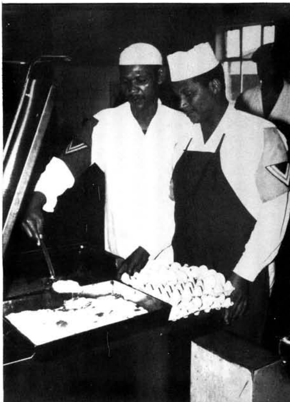
Kokke van die Kaapse Korps besig met voedselvoorbereiding

linge aangestel het hulle as grondpersoneel opgelei het.