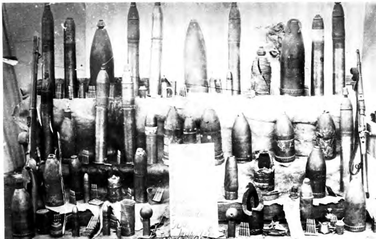
Koeëls en patrone Tweede Vryheidsoorlog (761000774)