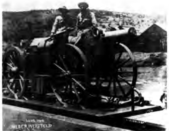
'n Erg beskadigde Long Tom kanon is in die werksplaas van die Nederlands-Suid-Afrikaanse Spoorwegmaatskappy herstel en is hier onderweg na Kimberley. (771000852)