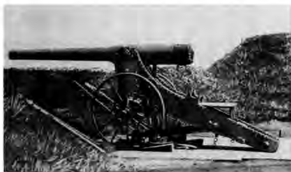
'n Long Tom (Creusot) 75 mm