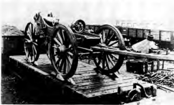
'n Long Tom kanon onderweg na die front, word per trein vervoer (771000854)