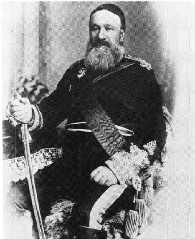
Genl P.J. Joubert