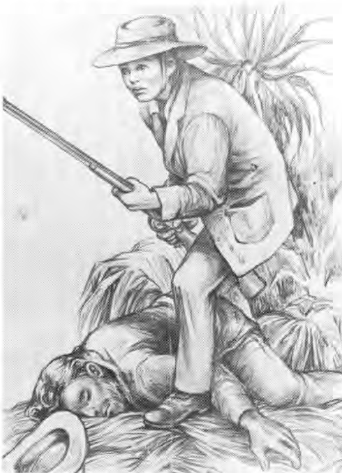
Dirkie Uys het sy vader teen 'n oormag Zoeloes probeer beskerm en met sy lewe vir sy heldedaad geboet

Gedurende hierdie tydperk reeds het die Suid-Afrikaanse jeug gewys van watter stoffasie hulle gemaak is. In 1838 het Dirkie Uys sy lewe vir sy vader gegee in 'n geveg teen die Zoeloes by Dingaan se stat. (Sien Militaria 15/1).