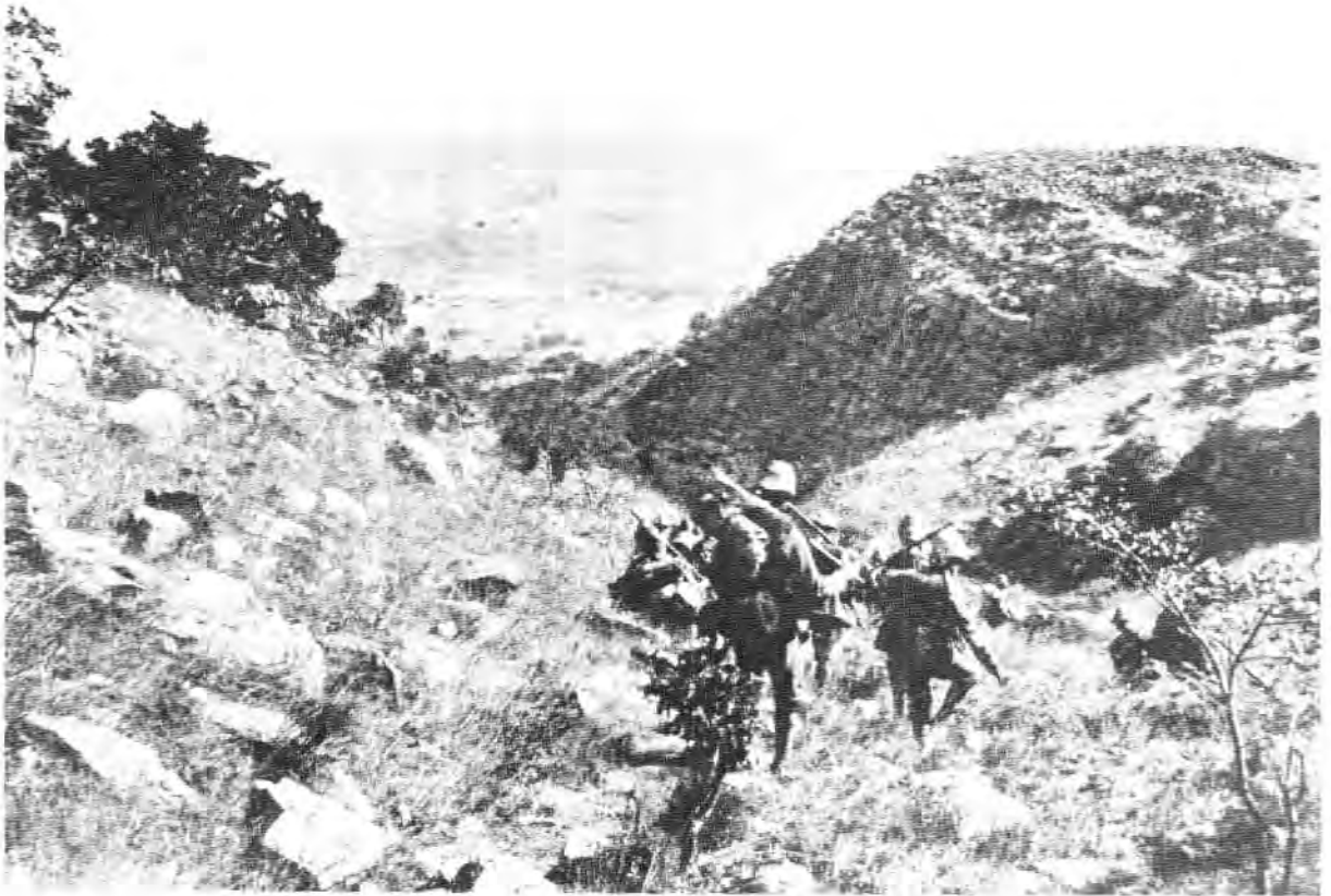
Britse Infanterie tydens die slag van Donkerhoek