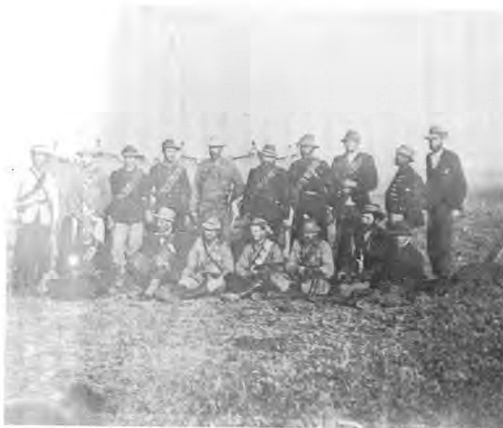
Gen Botha by Donkerhoek

Louis Botha wat die hele dag lank die siele van die Boereverdediging was, het uiteindelik burgers uit die middel onttrek en na die linkerflank gestuur om dit teen die geweldige oormag te versterk. In die aangesig van Pole-Carew se mag, wat sy sentrum bedreig het, het Botha beseft dat hy die verdediging van sy linie daar gevaarlik uitdun, maar hy het geen ander keuse gehad nie omdat daar nie genoeg burgers aan sy front was om die linie oral behoorlik te verdedig nie. 35