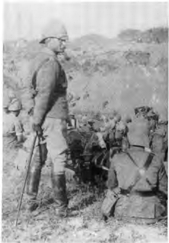
Gen Pole-Carew Bevelvoerder van 11 Divisie

In die sentrum het Lt genl Pole-Carew teen dagbreek met sy twee infanteriebrigades van hulle kamp af na die plaas Christinen Hall gemarsjeer, vanwaar hy hulle oor 'n reeks klein koppies in die gebied, wat suidwaarts na Mooiplaats uitstrekk, ontplooi het. Die bereide infanterie het hy aangewend om sy front en flanke te dek. Sy opdrag was om nie aan te val nie, maar sy mag gereed te hou in afwagting op die verloop van die ruitery se omvleuelingsbeweging. 28