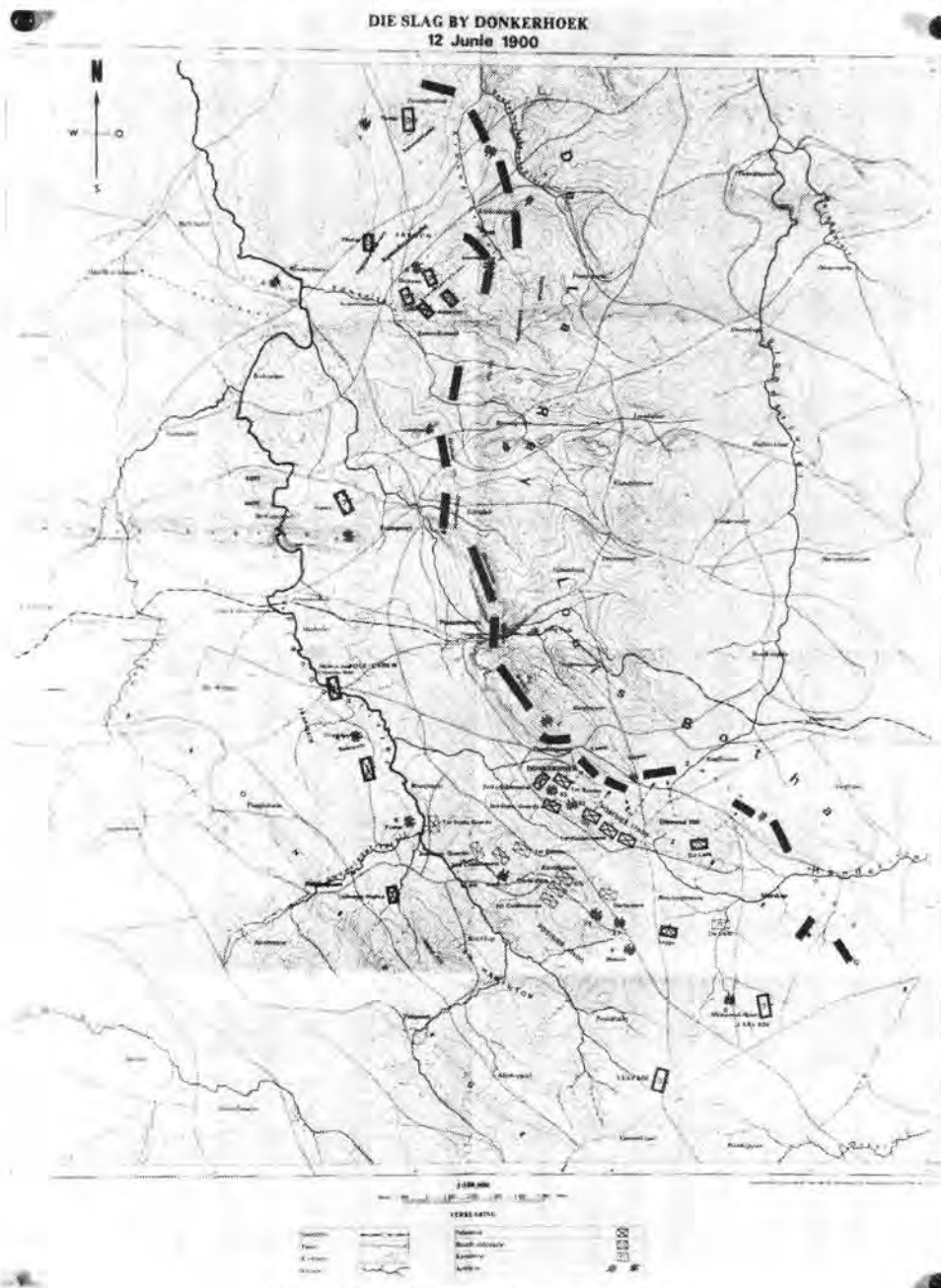
Die slag van Donkerhoek 12 Junie 1900

Albei kante het daardie nag voorbereidings vir die volgende dag se geveg getref. Die oggend van 12 Junie, reeds om 03h00, het Roberts sy finale bevel aan Pole-Carew getelegrafeer. Daarvolgens moes Pole-Carew die aanval van Ian Hamilton dieselfde oggend ondersteun. Sy sentrum moes hy hou, bygestaan deur die 5dm kanonne, en sy regterflank verder uitstoot. 31