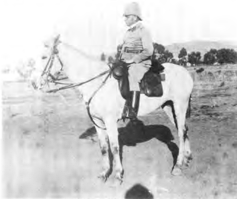
Gen maj J.D.P. French te Pretoria

duisternis welkome verligting gebring. In plaas daarvan dat hy die Boerelinie omvleuel het, is hyself met omsingeling bedreig. Sy mag het die perke van sy vermoëns bereik en kon homself alleenlik met die uiterste inspanning handhaaf en die terugtoglinie oophou. Ten spyte van sy benarde posisie het hy egter besluit om in sy posisies vas te skop ten einde die volgende dag 'n groot deel van Botha se magte voor hom vas te pen. 12