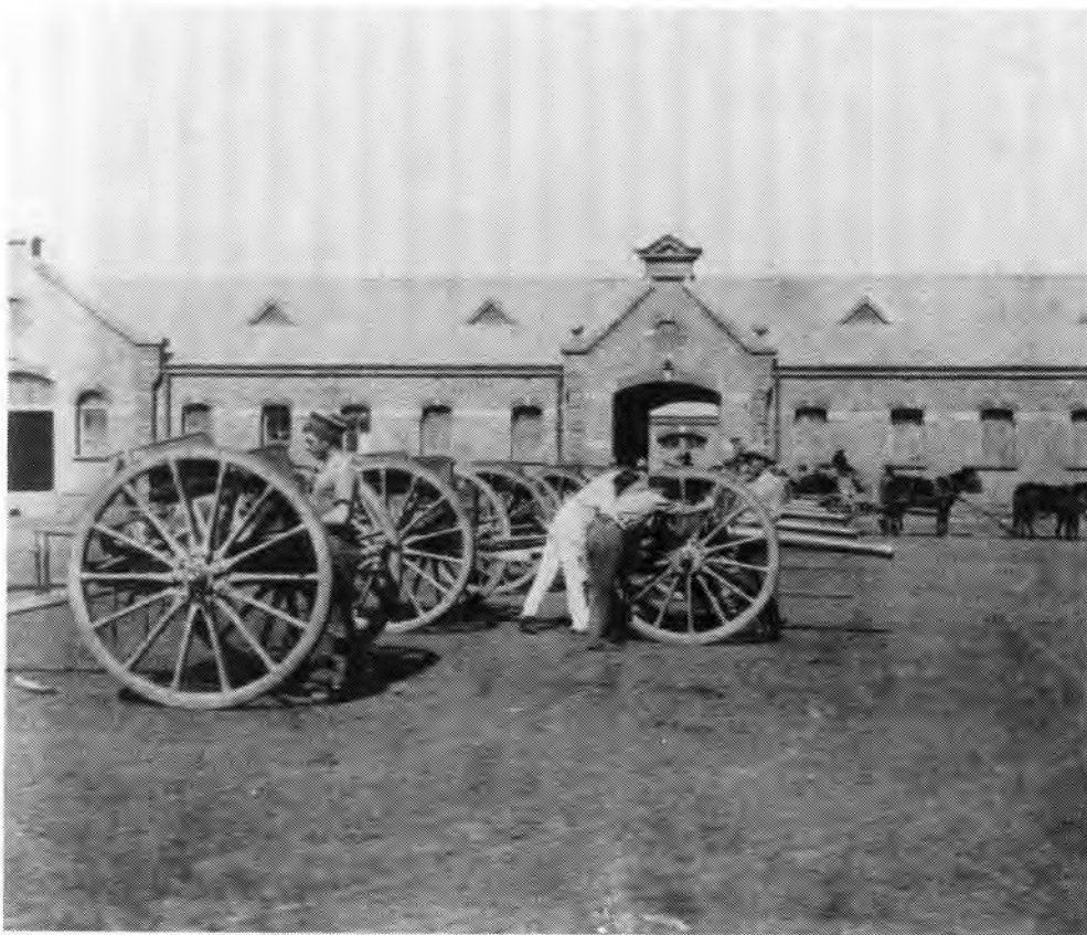
Kanonne van die 75e Royal Field Artillery in die Barakke te Pretoria