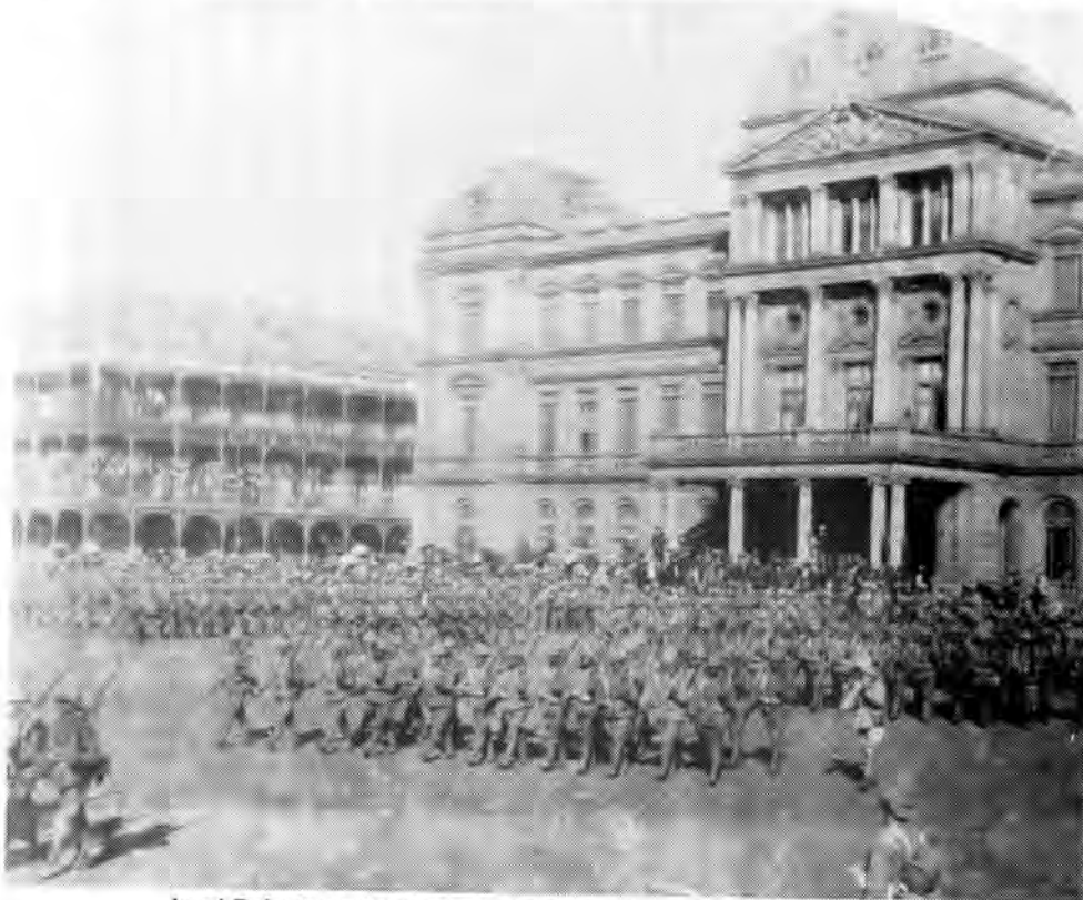
Lord Roberts se troepe voor die ou Raadsaal, Pretoria, Junie 1900