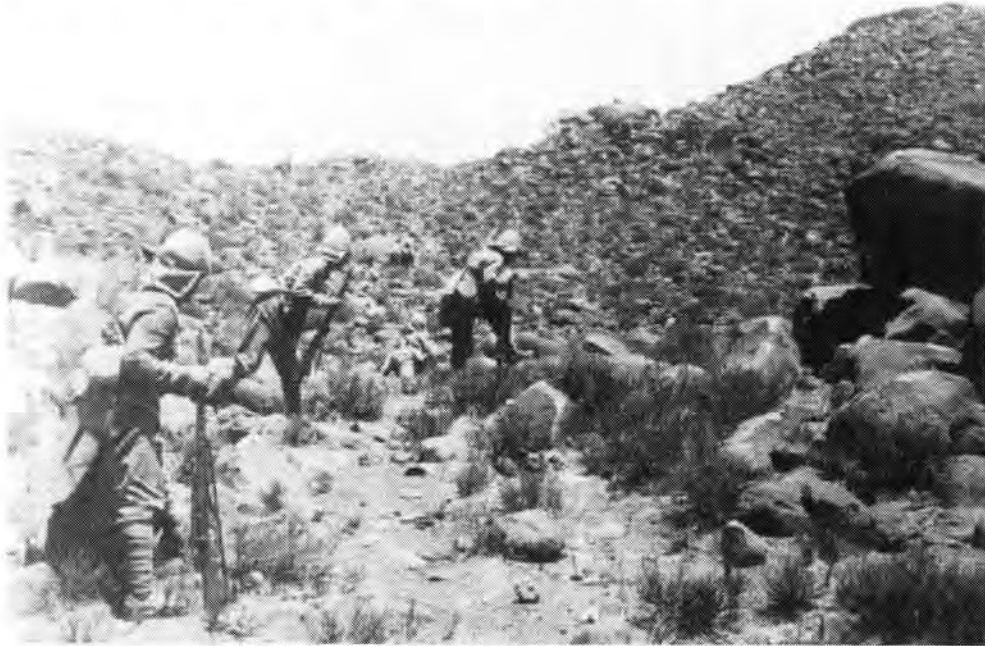
Britse Infanterie tydens die Slag van Donkerhoek