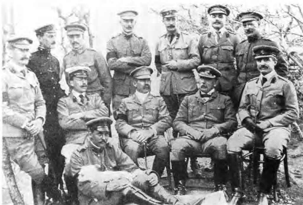
Gen maj J.D.P. French en sy personeel