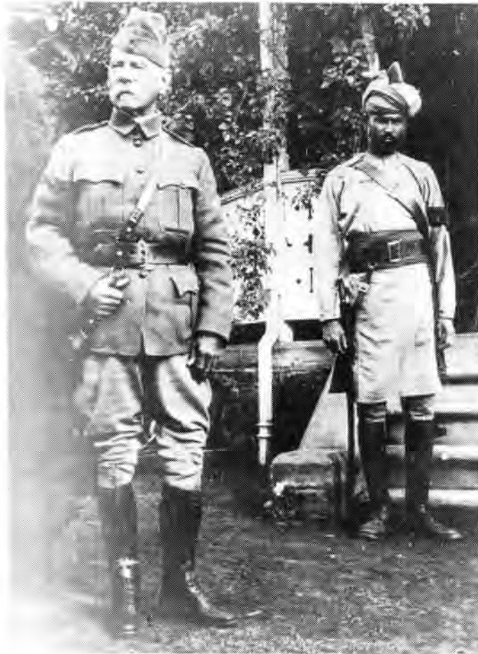
Lord Roberts te Pretoria 1900

Die hele dag het sy burgers, volgens Botha, hard en swaar geveg, sodat hy pres Kruger verseker het dat "ik onze menschen nog nooit