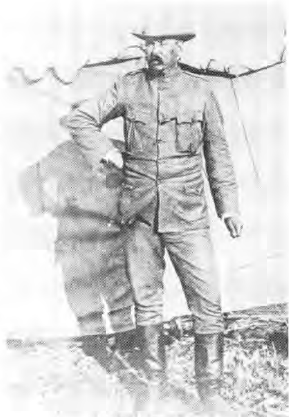
Gen Louis Botha

Louis Botha was ewe vasberade om die oprukende ruitery tot stilstand te dwing. Van Diamond Hill af het hy afdelings burgers gestuur om dwarsoor Boardwood se aanmarsroete posisie in te neem en sy kolonne in die front te stuit. Teen ongeveer 11h00 was Broadwood verplig om sy brigade tot stilstand te roep en het hy Lt Connolly met 2 kanonne gestuur om die vyand uit die pad te vee voor hulle kans kon kry om hulself stewig in posisie te vestig. 16