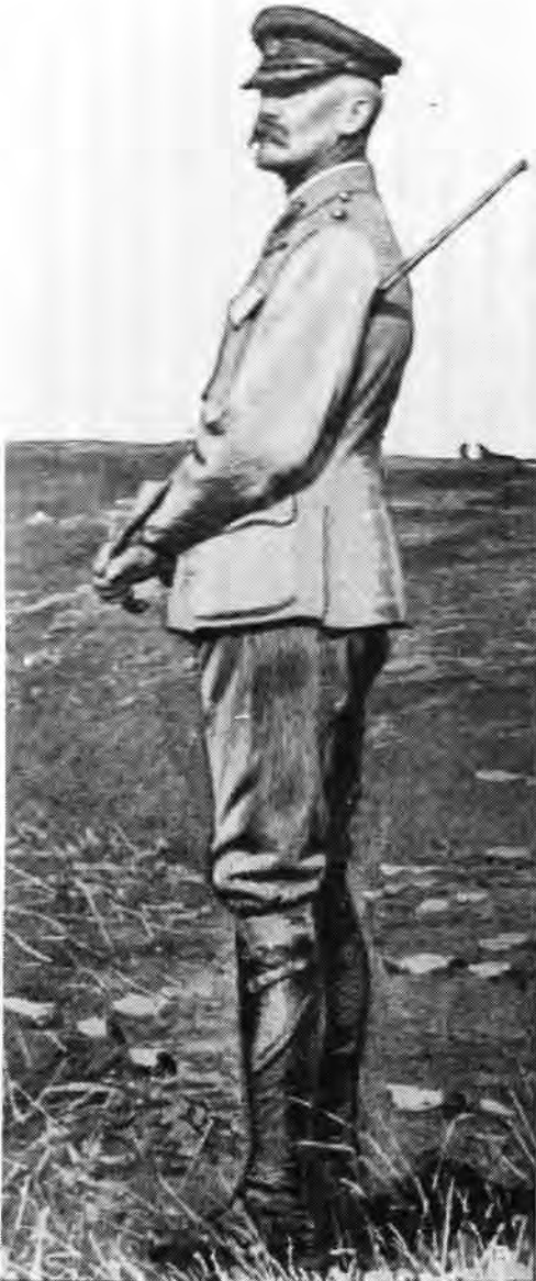
Gen maj Sir Bruce Hamilton

gemaak en die Boerestellings geleidelik van regs af begin oprol. 25