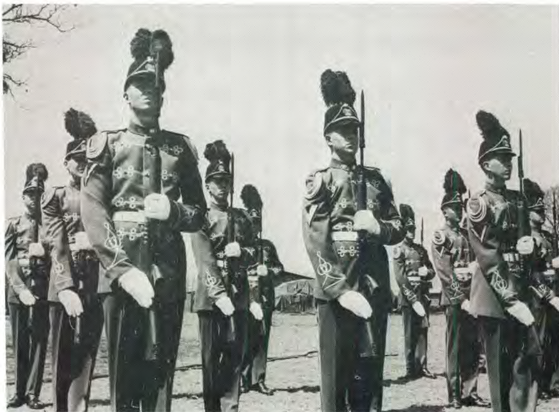
Die Staatspresidentswag in die latere uniform tydens 'n seremoniële geleentheid. Die baadjie is met 'n wit gordel by dié geleentheid gedra.

The State President's Guard wearing the more recent uniform, during a ceremonial occasion. On such occasions, the jacket is worn with a white belt.