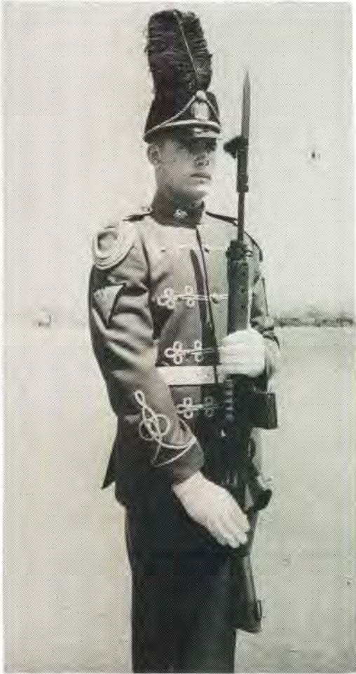
Groen uniform van die Staatspresidentswag met as hooftoetsel die swart Leërgimnasiumpet met die Republiekwapen voorop en die swart volstruisvere bo-op.