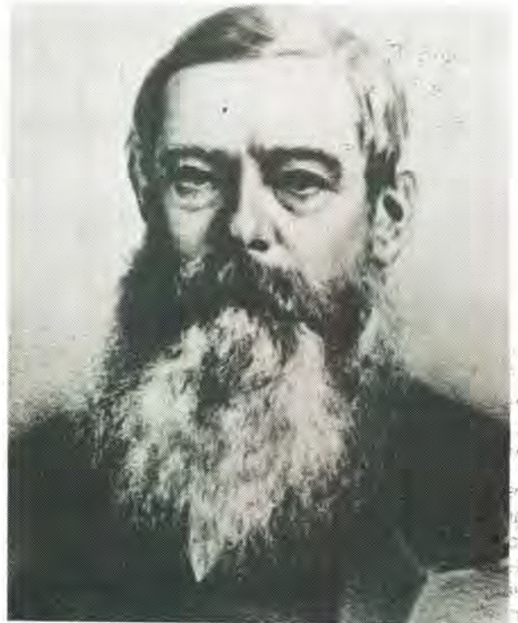
President J.H. Brand, Stigter van die Vrystaatse Artilleriekorps.

Tot op die stadium was die posisie van die Staatspresident niks meer as 'n blote voortsetting van die amp van Goewerneur-Generaal met 'n naamsverandering nie. Daar is voorts besef dat alles moontlik gedoen moes word om die Staatspresident se beeld groter en waardiger te maak. Aanvanklik het die Staatspresident geen permanente wag gehad nie en sedert die vroeë vyftigerjare het die Leër, Lugmag en Vlootgimnasiums om die beurt as wag eers vir die Goewerneur-Generaal en daarna vir die Staatspresident opgetree. Vervolgens is die Opperbevel van die Weermag versoek om 'n Staatspresidentswag op die been te bring.