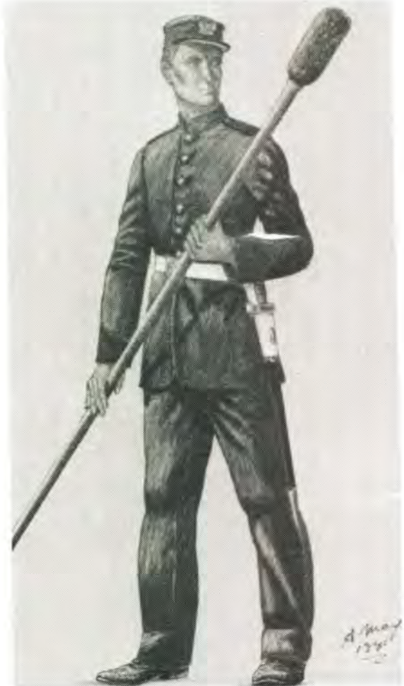
Bombardier in eerste uniform van OVS se Artillerie in 1870.

A lieutenant of the OFS State Artillery in 1870 wearing the earliest uniform.