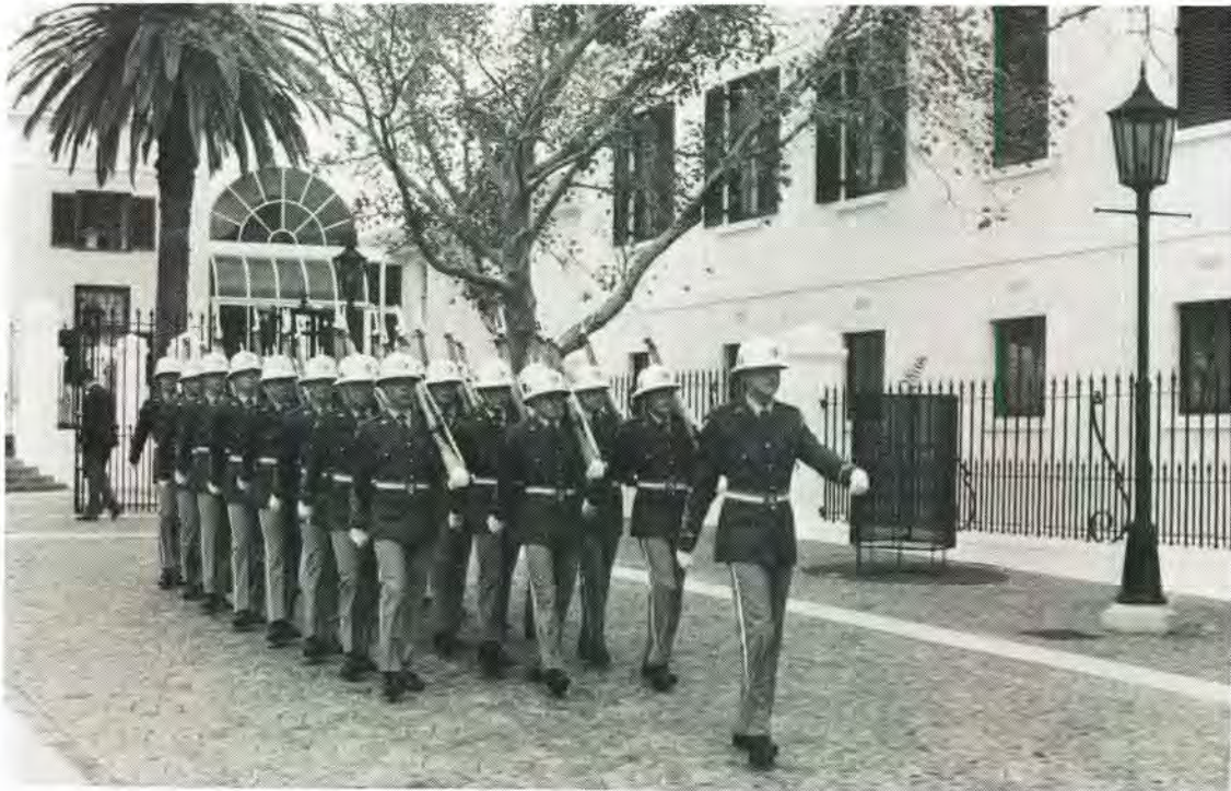
Die Staatspresidentswag op parade in hul nuwe seremoniële uniform. The State President's Guard on parade in their new ceremonial uniform.

met die standaard Leëruniform uit te reik aangesien die eenheid op die Leër se sterkte is en infanterie opleiding ondergaan sowel as die normale infanterie take uitvoer wat van so 'n eenheid verwag word.