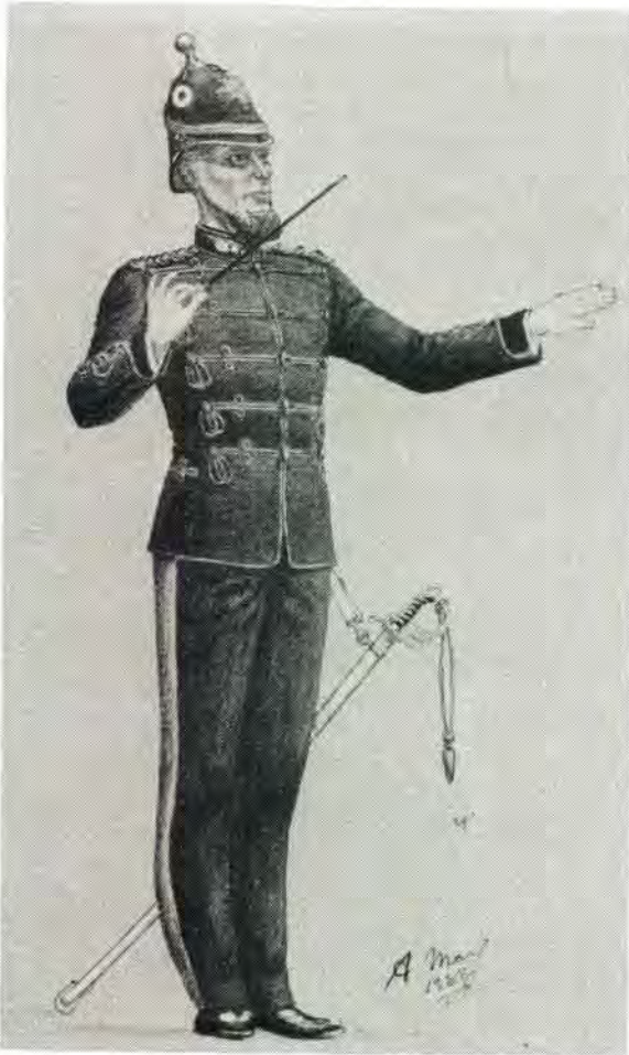
Orkesmeester van die Vrystaatse Artillerie 1880–90 in tweede uniform vanaf die Britse patroon oorgeneem.

leriste vasgelê is, het hulle vir drie jaar, waarin hulle nie toegelaat is om te trou nie, tot aktiewe diens verbind. Hulle moes tussen 16 en 20 jaar oud wees, toestemming van hul ouers of voogde gehad het om by die korps aan te sluit en fisies gesond wees. Verder moes hulle 'n edel karakter hê, godsdiensoefeninge bywoon en sorg dra dat hulle wapens, saals en tooms gedurig in orde is.