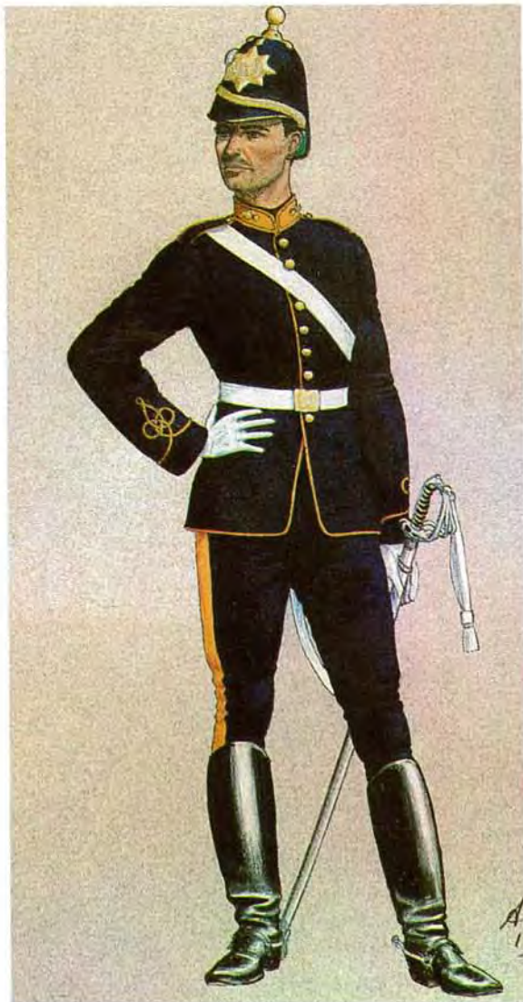
'n OVS Staatsartillerie artilleris in volle mondering aangeneem en gedra tussen 1880–90.

A sergeant wearing the old republican field service dress between 1880–90. The second uniform of the OFS State Artillery.