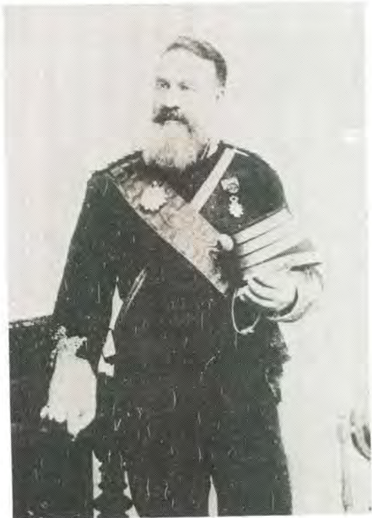
President T.F. Burgers, stigter van die Transvaalse Staatsartillerie.

President T.F. Burgers, founder of the Transvaal State Artillery.