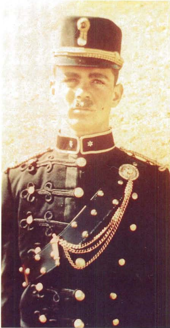
Donkerblou parade of winteruniform wat met koringblou omgeboor was.

Dark blue parade dress or winter dress, with cornflower blue piping.