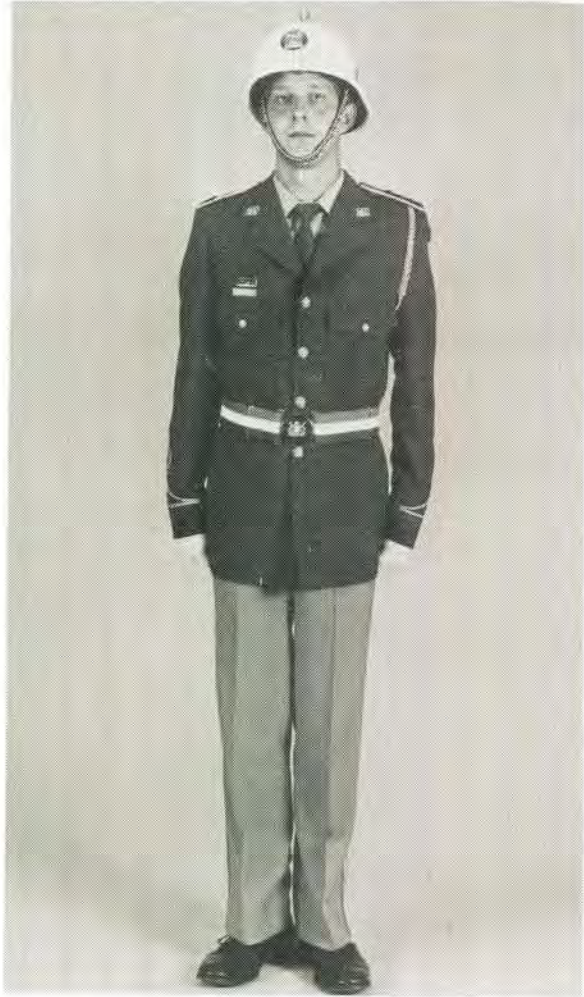
Winter- en parade uniform van 'n offisier. Winter uniform and parade uniform of an officer.