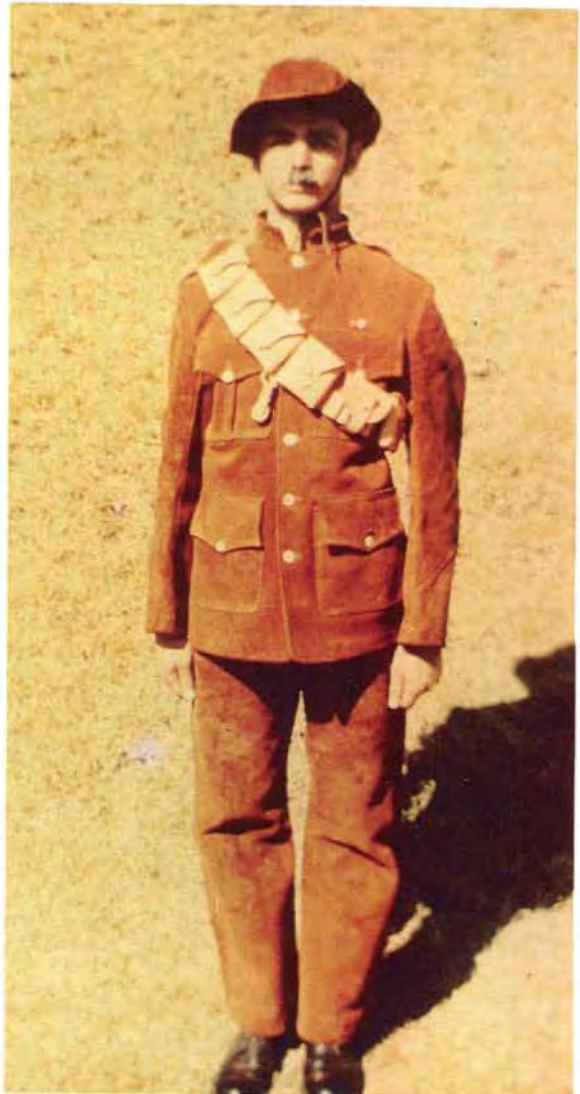
Burgerlike klere wat deur die Staatsartillerie gedra is in die tagtigerjare. Civilian clothes worn by the State Artillery in the Eighties.