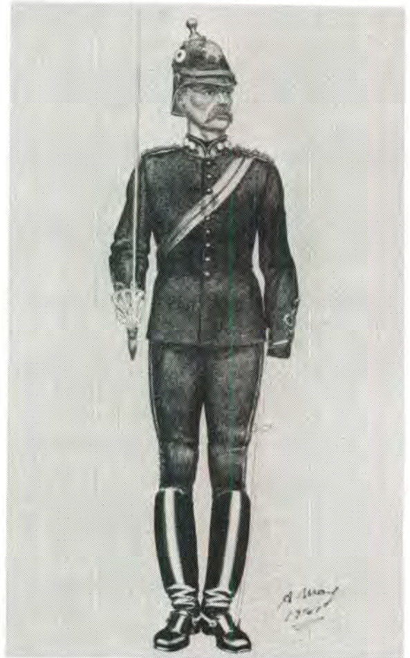
Offisier in die Vrystaatse Artillerie op parade 1880–90 Tweede uniform van Britse tipe.

Regulasies wat in 1876 vir die Vrystaatse artil-