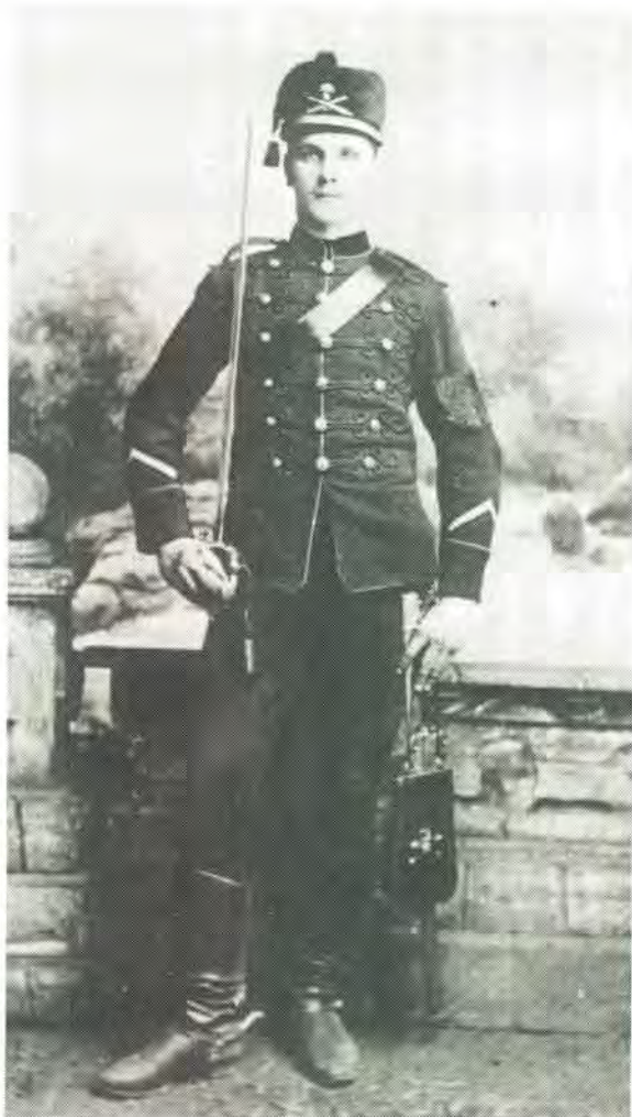
Winter of Parade uniform van 'n korporaal. Winter dress or parade dress of a corporal.