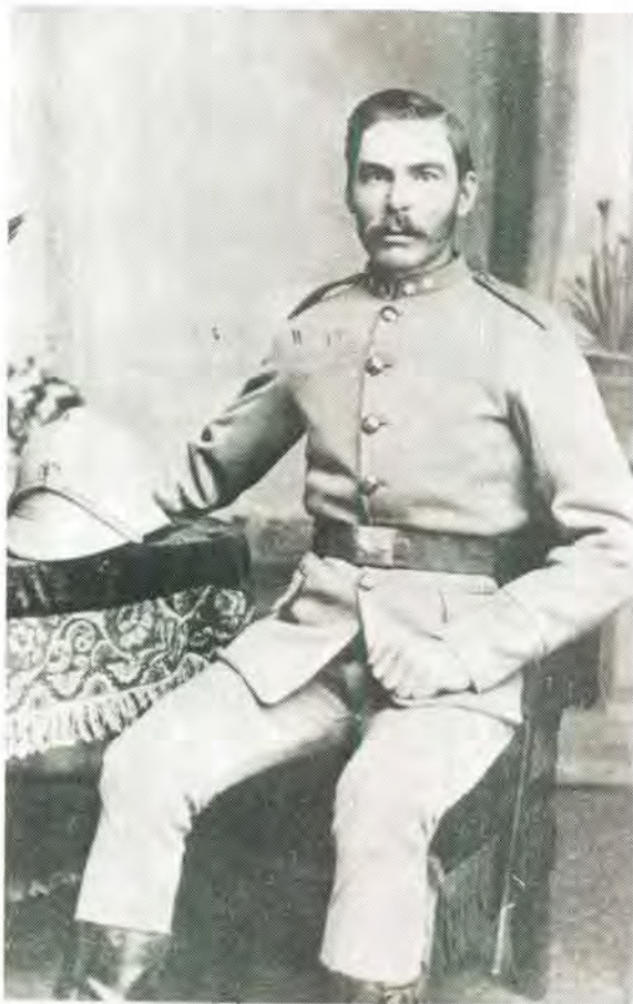
Winteruniform. Let op helmet met wit pluim. Winter dress. Note the helmet with white plume.

Die parade uniform het heelwat meer versierings as die velddiensuniform gehad, onder meer drie rye van ses knoppe elk, regopstaande wit kwaste op die sierlike mus en rye sierkoord in mooi