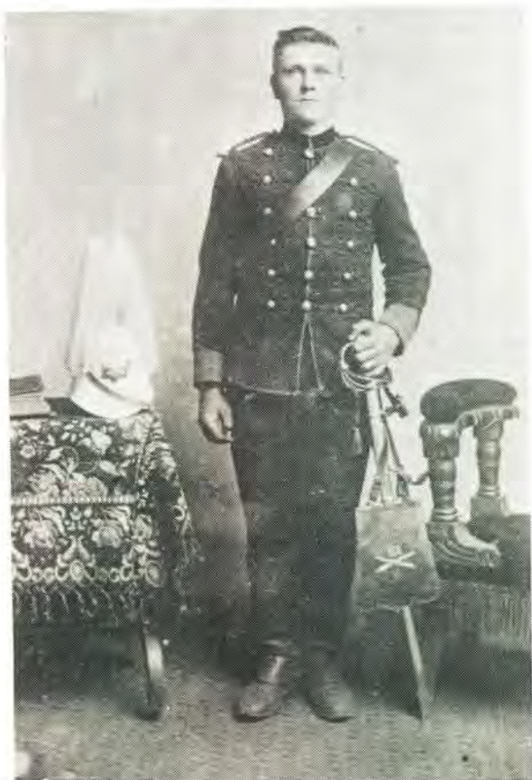
Plumbe & Brouckmann SOON-STE PRETORIA