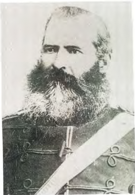
Genl Piet Joubert, Transvaalse kommandant-generaal. General Piet Joubert, the Transvaal Commandant-General.

Die vereistes vir lede van die korps was dat hulle gewerf moes word uit gebore en genaturaliseerde burgers van die Suid-Afrikaanse Republiek; hulle moes minstens 16 jaar oud wees; ongetroud wees; as liggaamlik geskik deur 'n geneesheer aanbeveel word en laastens op grond van goeie gedrag kwalifiseer.