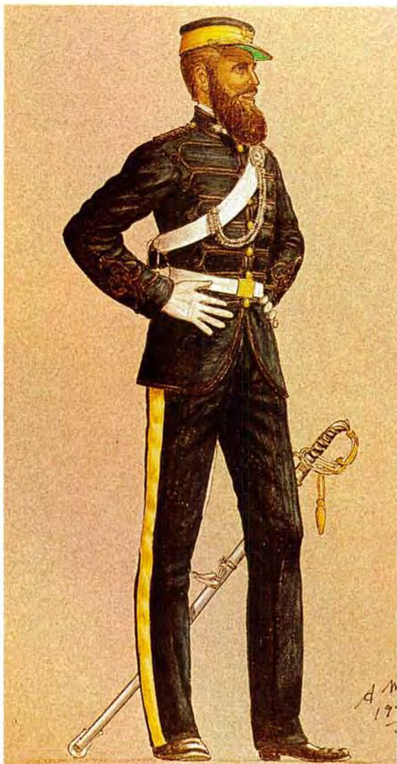
'n Luitenant van die OVS Staatsartillerie in 1870 in die eerste uniform.

A lieutenant of the OFS State Artillery in 1870 wearing the earliest uniform.