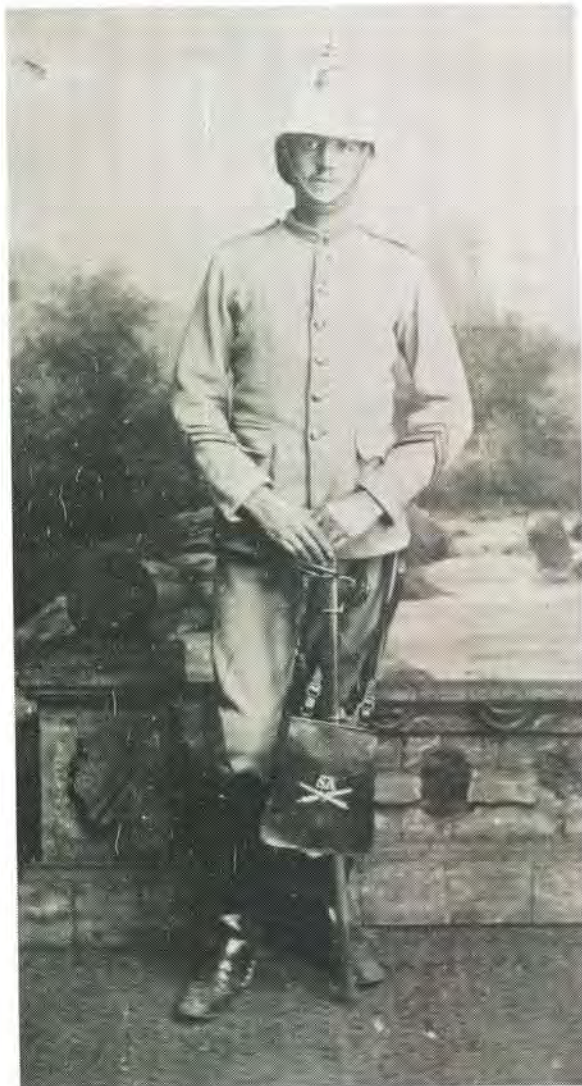
Somer of velddiens uniform van 'n wagmeester in die Staatsartillerie met wit helmet.

President T.F. Burgers, founder of the Transvaal State Artillery.