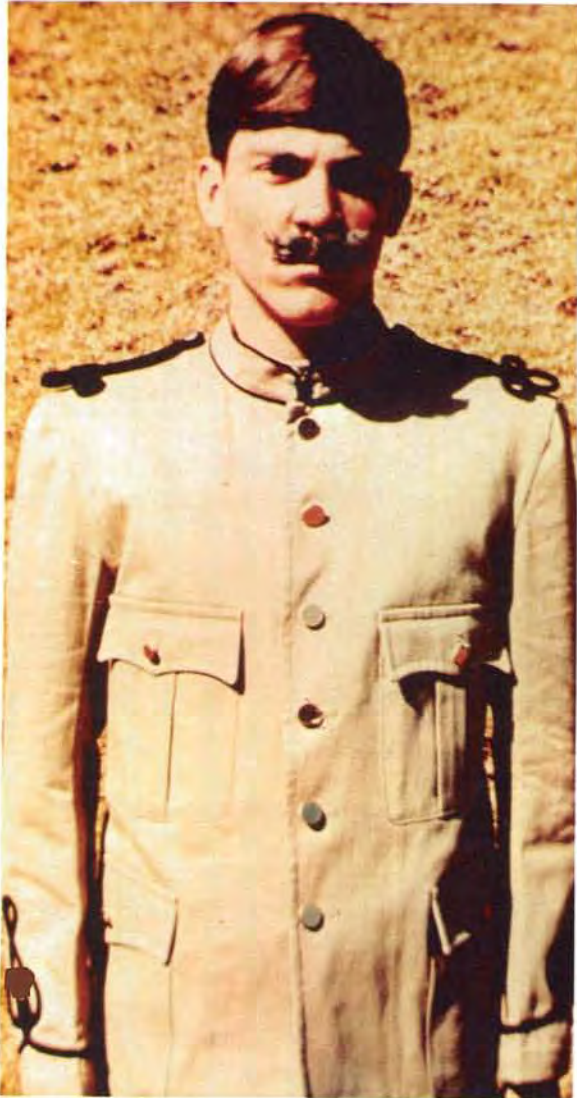
Somer of velddiensuniform van Staatsartillerie. Summer or field dress of the State Artillery.