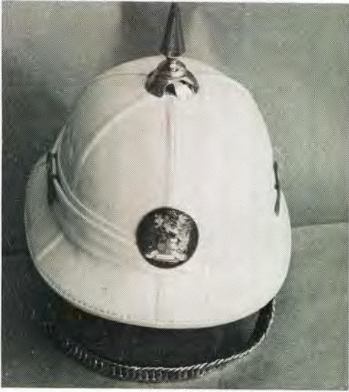
Wit punthelm met penteken. White cork helmet with spike.

en praktieser sou wees as die een wat op daardie stadium in gebruik was.