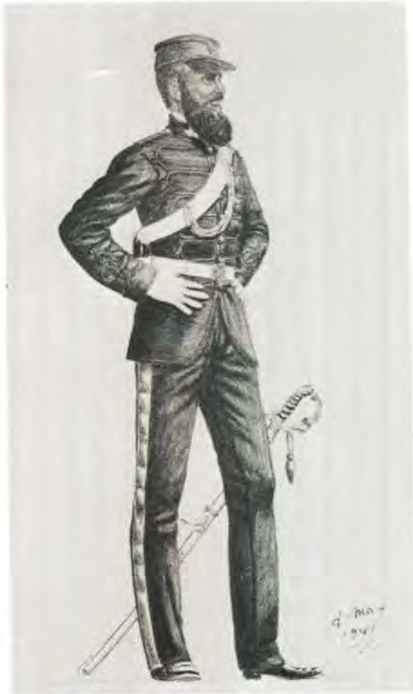
Luitenant OVS Staatsartillerie in 1870 in vroegste uniform.

Hoewel die ontdekking van diamante en die aneksdasie wat daarop gevolg het as spoorlag gedien het om die artilleriekorps op te knap, is daar eers in 1875 werklike pogings aangewend om die korps op 'n beter grondslag te plaas.