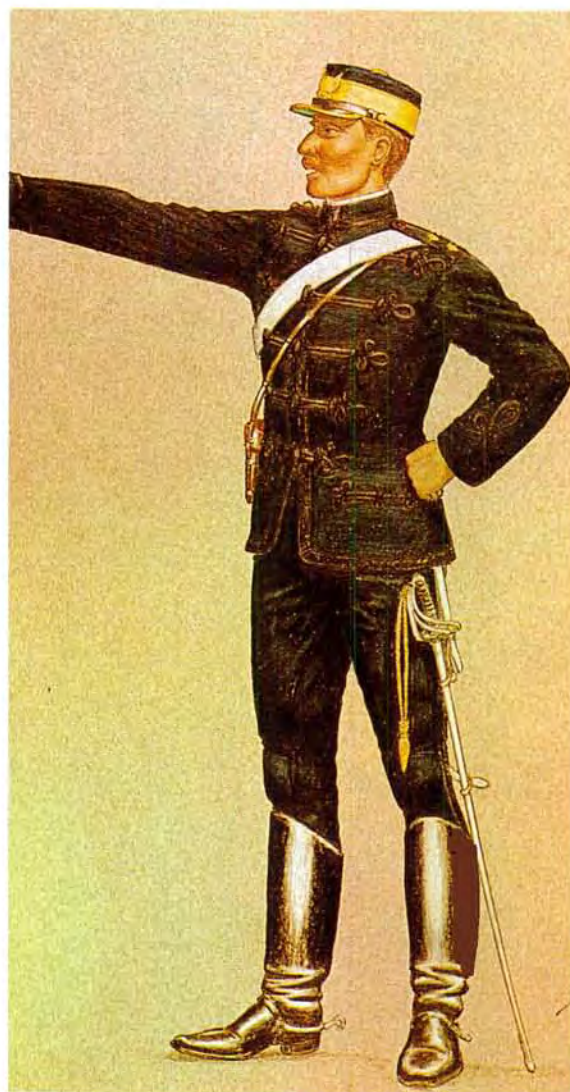
'n Luitenant in die Velddrag van die OVS staatsartillerie. Die tweede patroon is in 1880-90 gedra.

A lieutenant of the OFS State Artillery in 1870 wearing the earliest uniform.