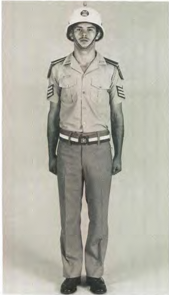
Someruniform van 'n onderoffisier. Summer dress of a non-commissioned officer.