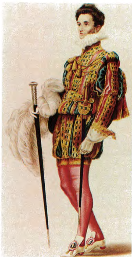
'n Luitenant tydens die kroning van George IV in 1820. Die Middeleeuse glorie het onder hom herleef en Pensioners is op die koning se koste met aanskoulike Tudor uitrustings voorsien. Die uitrusting was bloedrooi met blou Invoegsels en bedek met talryke goue knope. Die kostuum is afgerond met rooi sykouse, wit skoene met rooi rose daarop, wit handskoene en 'n swart hoed met rooi en swart vere.