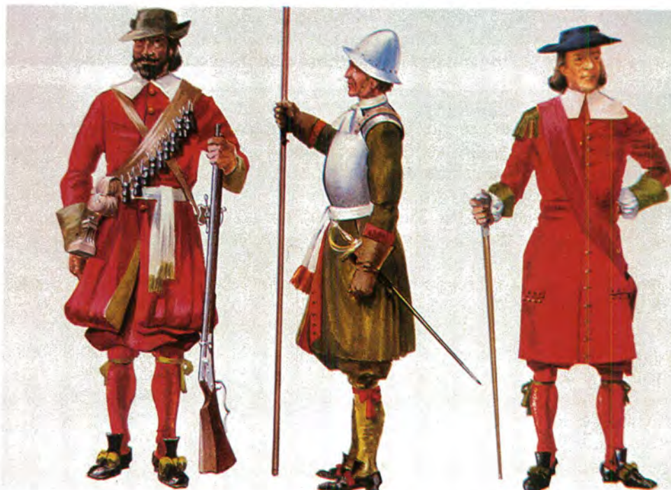
Uniforms van die Britse infanterie in 1670. Van links na regs 'n musketier – 'n piekdraer en 'n tamboermajoor.