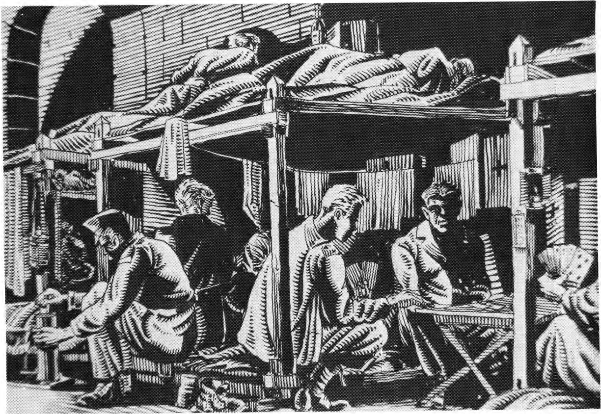
Hierdie sketse is ook deur Ogilvie geskets. Dit is tonele wat hulself in die kampe afgespeel het waar Ogilvie-hulle gevange gehou is