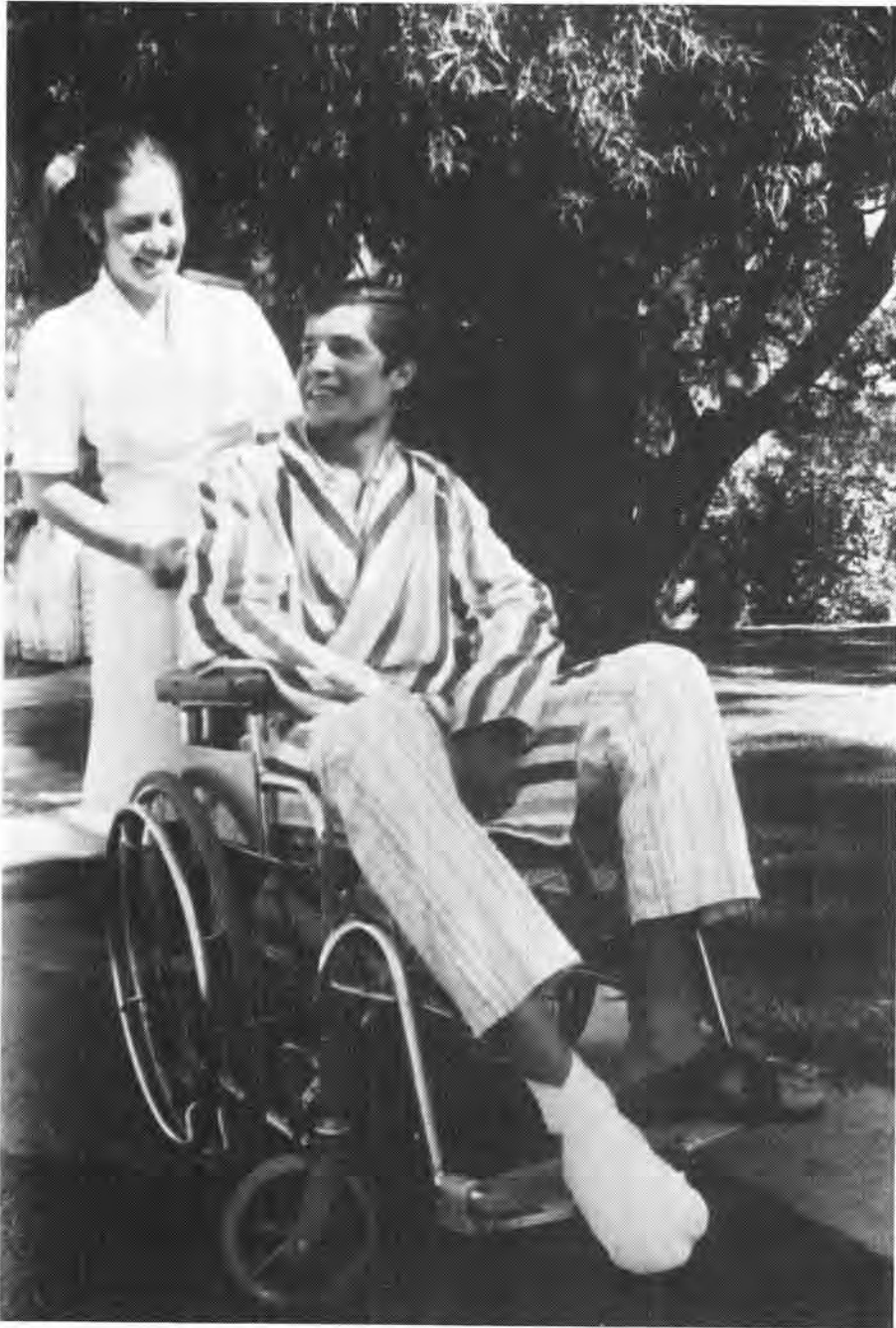
'n Verpleegster van die Militêre Hospitaal besig met nasorg van 'n beseerde soldaat

Met die verandering van die funksie en beeld van die vrou in uniform elders, het dit hier te lande ook by die eise van die tyd aangepas. Die benadering van die SA Weermag tans is dat die vrou se rol hoewel andersoortig, tog net so belangrik as die van die man is. Die militêre beeld moet nie onvoorwaardelik deur die vrou nagestreef word nie, terwyl sy haar eie vroulike identiteit steeds moet behou. Die vrouelid betree 'n tradisionele manswêreld waarin aanpassings gemaak moet word om suksesvol by die Weermag in te skakel. Belangrik om op te let is dat