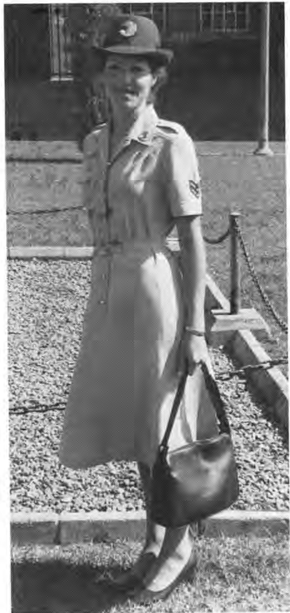
Die verbeterde uniform vir leërvroue wat in 1985 uitgereik is

Uiteenlopende en gemengde reaksies uit alle oorde het oor die aangeleentheid opgeklank. Reaksies uit die geleedere van vroue was oor die algemeen positief en gunstig en dit was vir hulle om't ewe of vroue in die gewapende magte of in die hulpdienste moes dien. Daar was diegene wat nie ten gunste was van verpligte militêre opleiding nie, maar wel dat meisies vir vrywillige burgermagopleiding moes aanmeld.