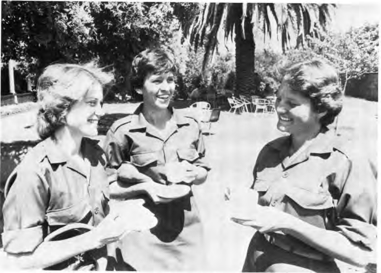
Studente van die SA Leërvrouekollege ontspan tussen lesings

Die toenemende rol wat deur vroulike militêre personeel in die SA Weermag sedert 1972 gespeel is, is ook in die SA Geneeskundige Diens se programme weerspieël. In Januarie 1979 het die SA Geneeskundige Diens se Opleidingsen-