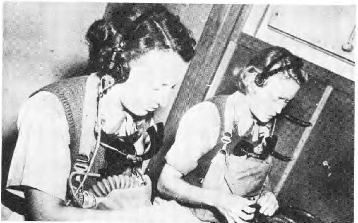
Kusartillerie spesialiste van die VHLD werk met afstandmetertoerusting in 'n ondergrondse bomvrye kamer.

Die beleid om vroue in militêre poste aan te