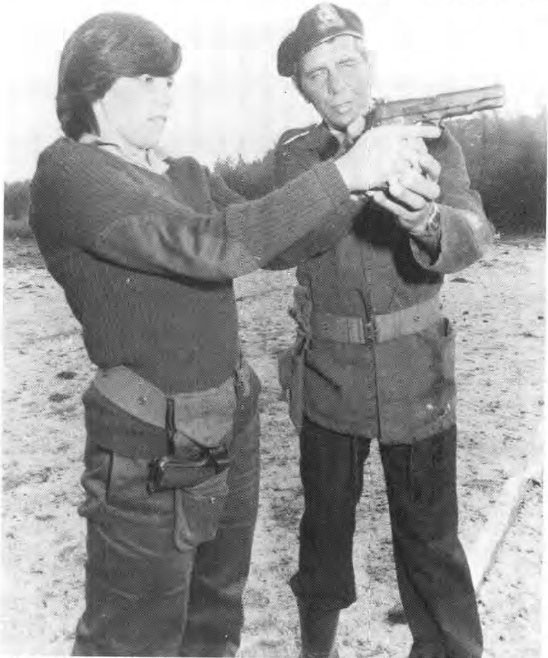
Hoewel vroue in die Staande Mag in 'n nie-vegtende hoedanigheid aangewend word, ontvang hulle tog wapenopleiding as deel van basiese opleiding

Redes wat aangevoer word waarom sy nie in 'n gevegsrol aangewend word nie, is dat Suid-Afrikers nie gereed is vir die vegtende vrou en alles wat daardeur geïmpliseer word. Dit is vir die man moeilik om die vrou in die geveg te