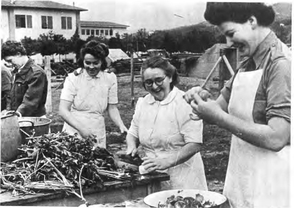
Diëtkundiges van die Vrouehulpleërdiens (VHLD) besig om 'n maaltyd voor te berei vir gewonde SA soldate in die Algemene Hospitaal in Italië in 1944.