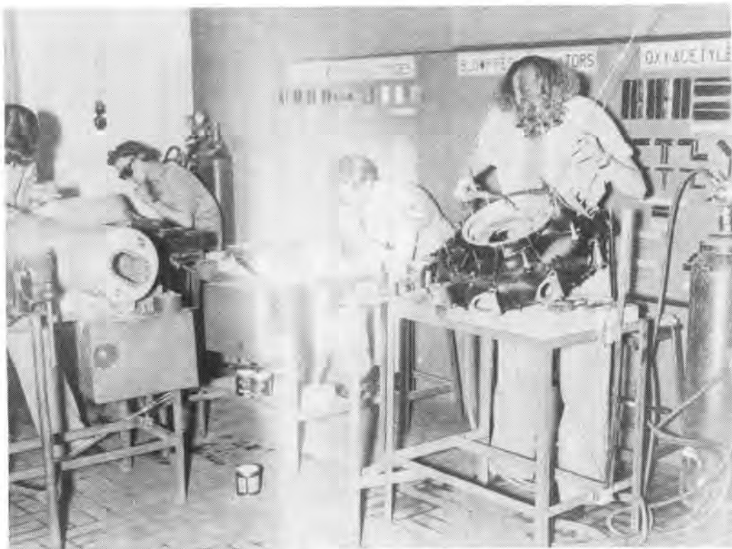
Tegnici van die VHLM besig met herstelwerk van vliegtuigonderdele (1942–1943)

Aanvanklik is 150 vroue per jaar by die kollege in George nie net in tegnieke van burgerlike beskerming opgelei nie, maar ook in 'n wye spek-