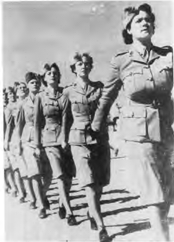
Lede van die Vrouehulplugmag (VHLM) op parade in die Midde-Ooste in 1942

Die getal Suid-Afrikaanse vroue wat in die Tweede Wêreldoorlog by die oorlogspoging betrokke was, is veel indrukwekkender as die met die Eerste Wêreldoorlog nl sowat 4 000 verpleegsters en 21 000 ander lede.