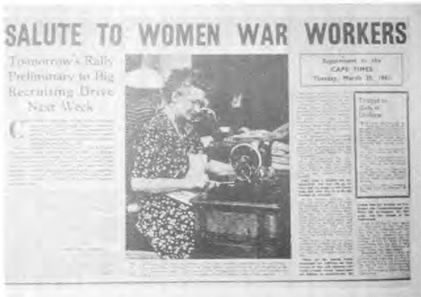
In Maart 1941 het die Vrouehulpdienste 'n werwingsveldtog geloods om meer vroue by die oorlogspoging te betrek

vroueklerke tot gevolg sou hê om vakatures te vul. Om voorsiening vir hierdie moontlikheid te maak, het die Vrouehulpdiens tot stand gekom. Vroue in die leer het diens gedoen as motorbestuurders, klerke, seiners, rapportryers, kokke, radiografiste en kusartillerie spesialiste.