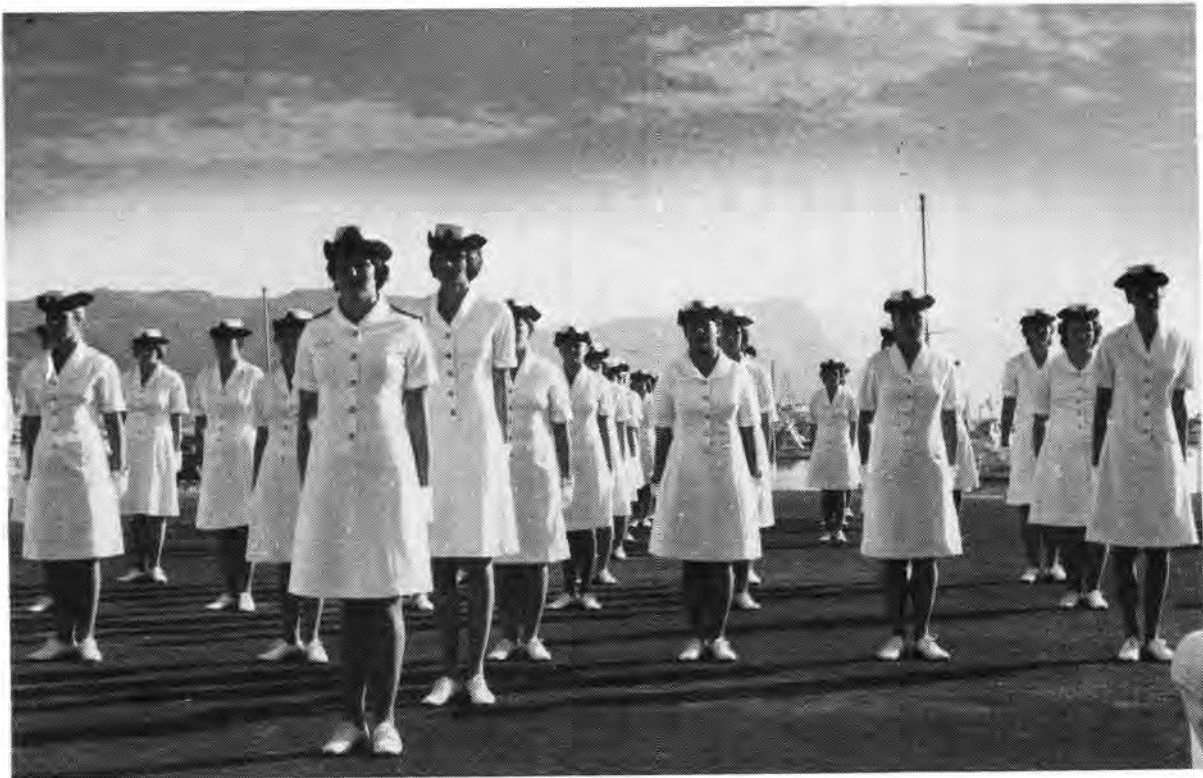
Uitpasseringsparade van Vlootvroue na basiese opleiding