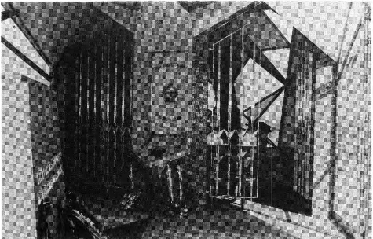
Ingang tot die Kapel. Krans gelê op 6 Mei 1984 tydens die jaarlikse gedenkdiens