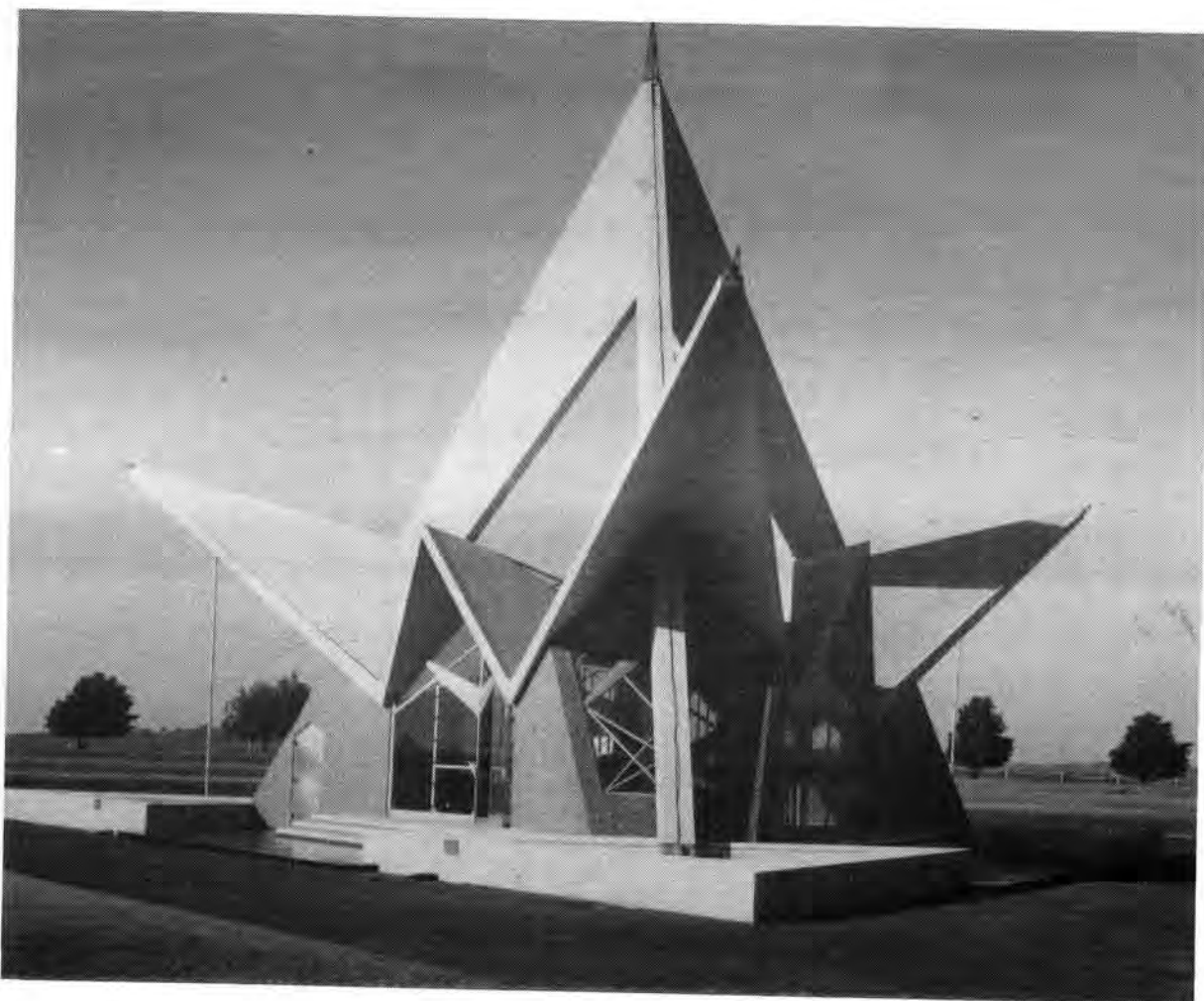
Gedenkteken van sykant. Die deurgaanse gebruik van die driehoek-effek kan duidelik bemerk word

hemelwaarts getrek moet word, daarom is maksimaal van glas in die dakstruktuur gebruik gemaak. Ook wanneer binne die Gedenkteken gestaan word, moet die buitewaartse sig 'n gewyde atmosfeer skep. So ook die gebruik van getinte glas in die kapel – 'n rustige en gewyde atmosfeer heers daar.