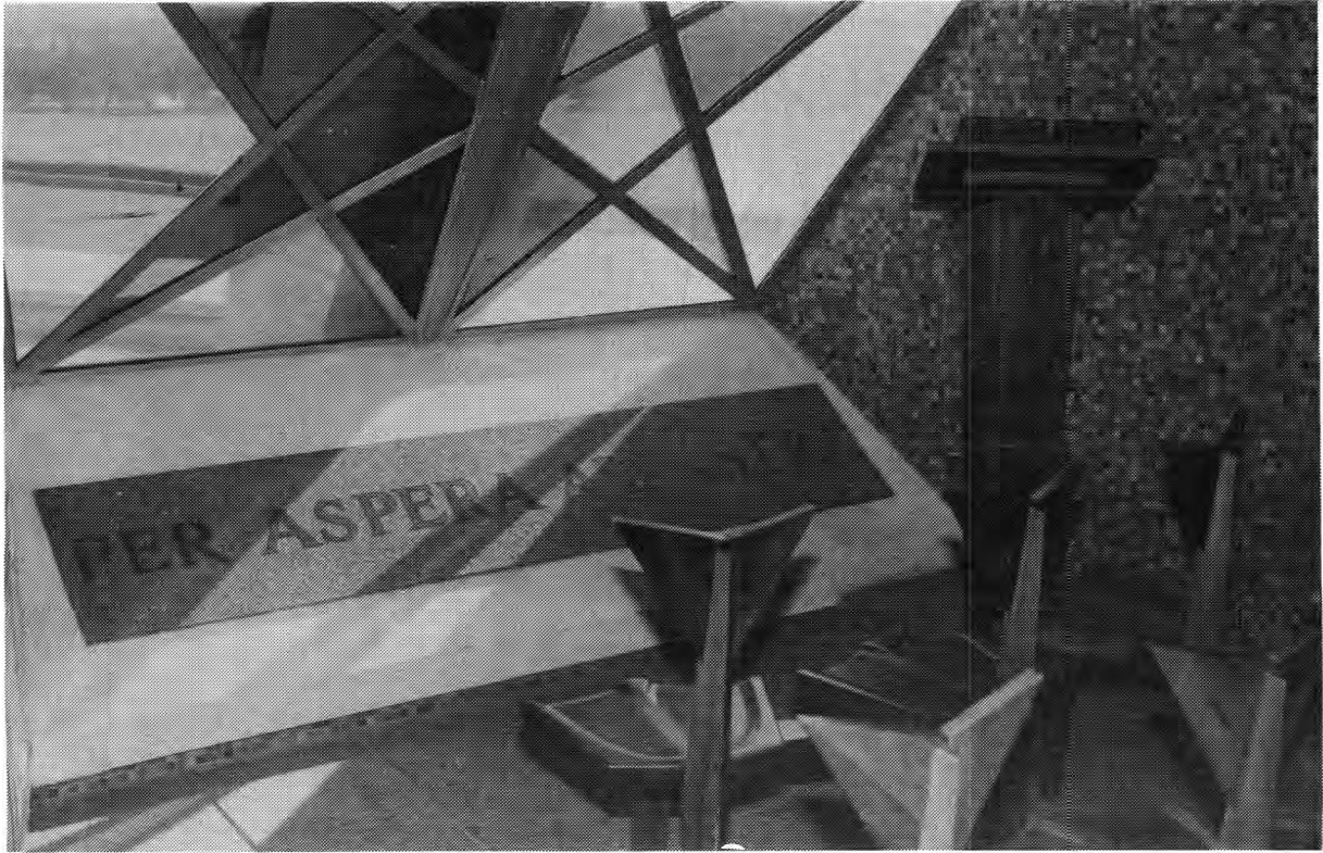
Binne-in die Kapel