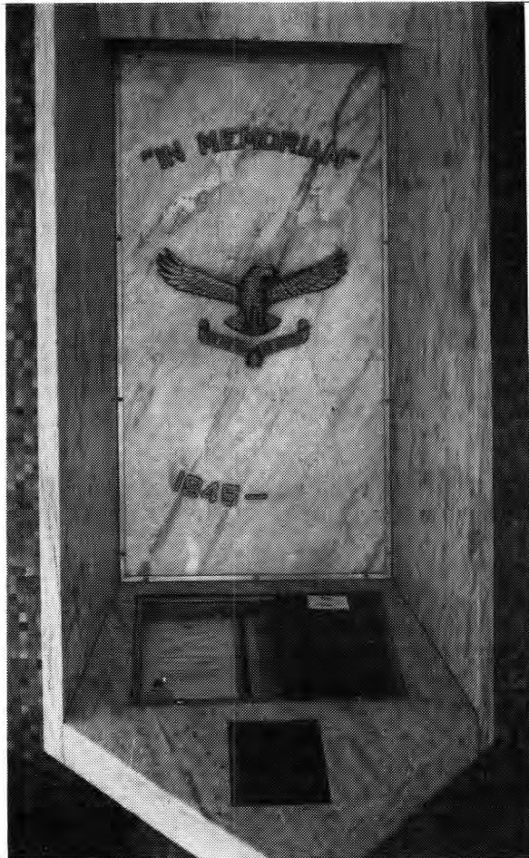
Verskillende "In Memoriam" tydperke wat in die Kapel verewig is