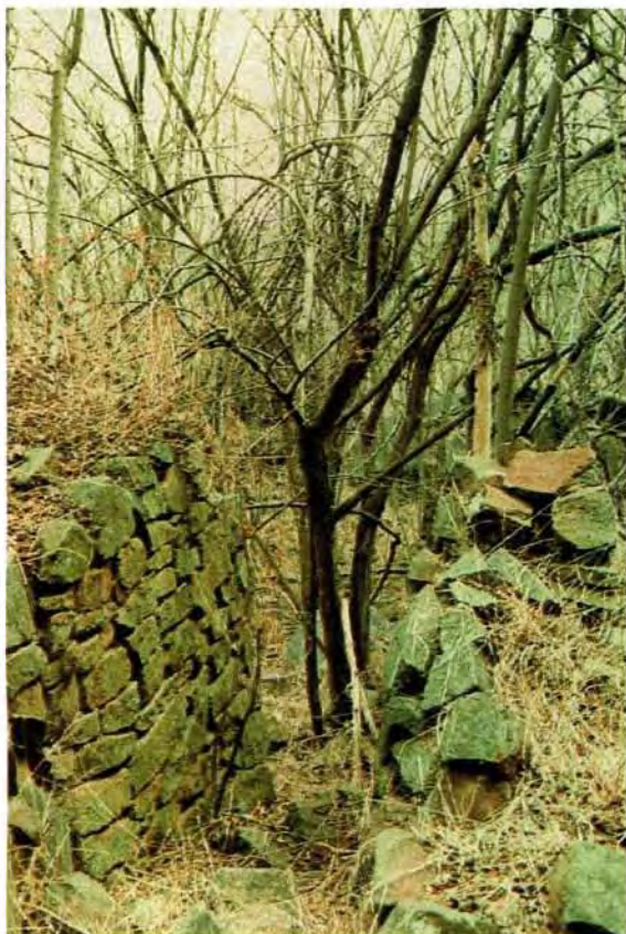
'n Toegegroeide loopgang tussen twee skansmure