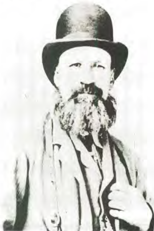
Genl P.J. Joubert, aanvoerder van die Boeremagte tydens die Mapoch-oorlog (1882–1883)

Die oorlog teen die Ndzundza was een van die moeilikste kampanjes teen 'n Swart stam waarmee die Transvaalse Boere tot en met 1882 te doene gekry het. Na die verslaving van die Bapedi en Zoeloes in 1879, was die Ndzundza naas die Swazis militêr gesproke een van die sterkste en bes georganiseerde onafhanklike stamme in Suidelike Afrika. 12 Vir die Transvaalse Boer was dit ook simbolies 'n beslissende stryd. Theal het bevind dat "upon the result of the campaign would largely depend the supremacy of the European race in South Africa – such another disastrous event as the failure of the Cape Colony to suppress rebellion in Basutoland would certainly ruin the prestige of the White man in all parts of the country." 13 Dus moes die stryd tot elke prys gewen word. Theal se bewering verklaar dan ook waarom die Britse regering sy steun aan die Zuid-Afrikaansche Republiek in die oorlog toegesê en begrip gehad het vir die "difficulties which have been forced upon it by the action of that chief and his people." 14