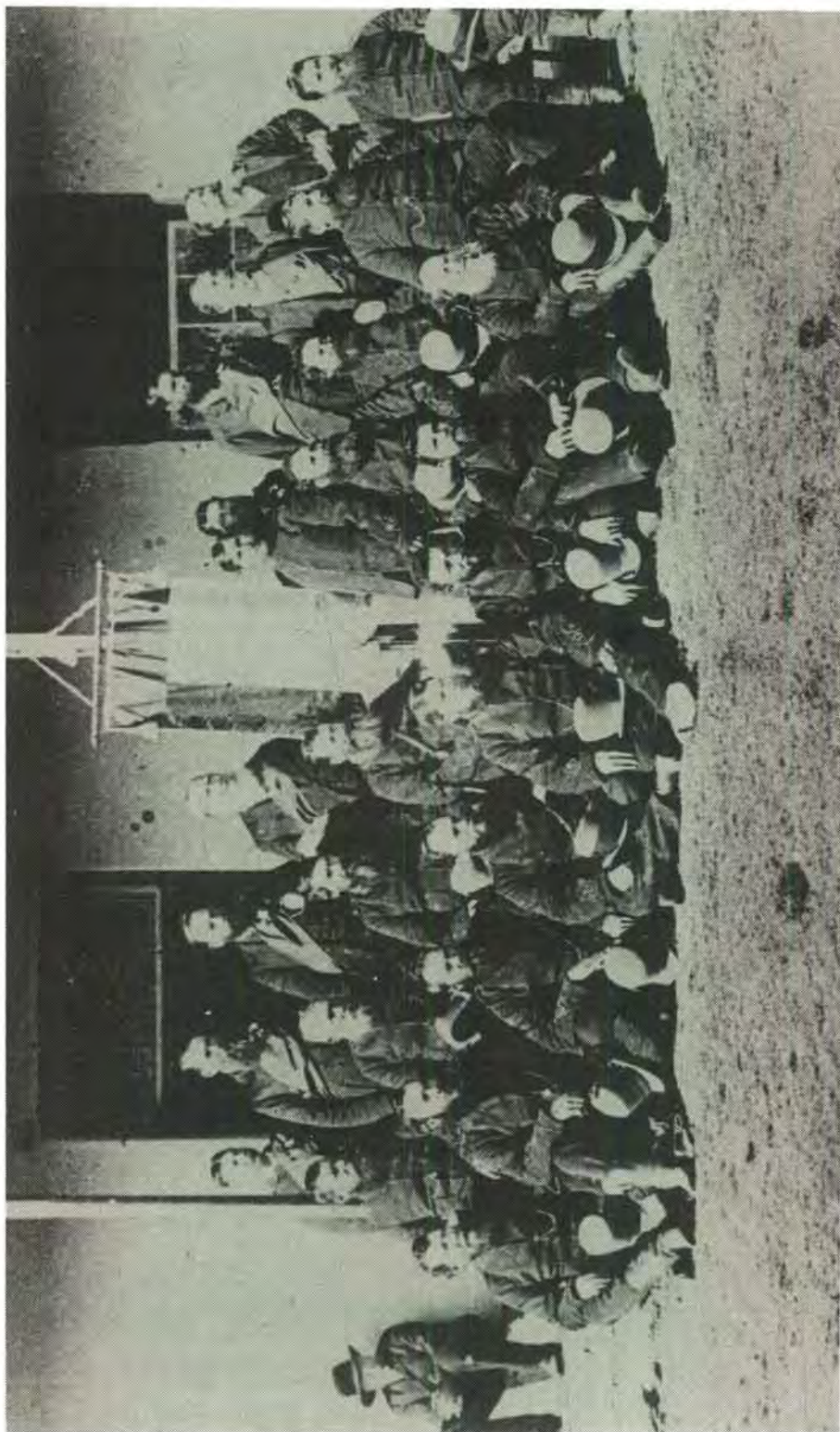
Kommando na afloop van die Mapoch-oorlog in Julie 1883 in Pretoria

stroom, waarop twee waens dadelik na die nabygeleë sendingstasie Bothsabelo gestuur is om te gaan meel haal. 56 Kennis van Nyabela se oorgawe is dadelik aan die Britse Resident gegee, 57 terwyl die kommandant-generaal die regering in Pretoria versoek het om 'n landswye dankdag af