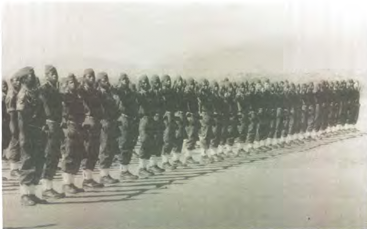
Lede van 115 Bataljon op parade tydens die amptelike opening van hul nuwe basis by Shanandoua op 30 Augustus 1985

Fenomenale ontwikkeling op haas elke terrein het gedurende die afgelope agt jaar in KwaNdebele plaasgevind. Dit word ook verwag dat die Ndebele regering die Sentrale Regering in 1986 sal nader om volle onafhanklikheid te verkry.