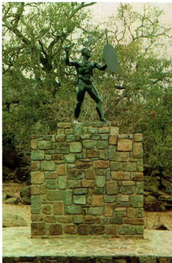
Standbeeld van kaptein Nyabela by Erholweni naby Roossenekal wat in 1970 opgerig is