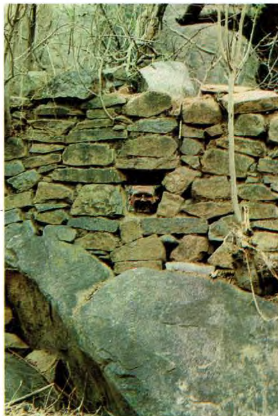
Die talle skietgate in die skansmure het aan die verdedigers 'n redelike skootsveld gebied