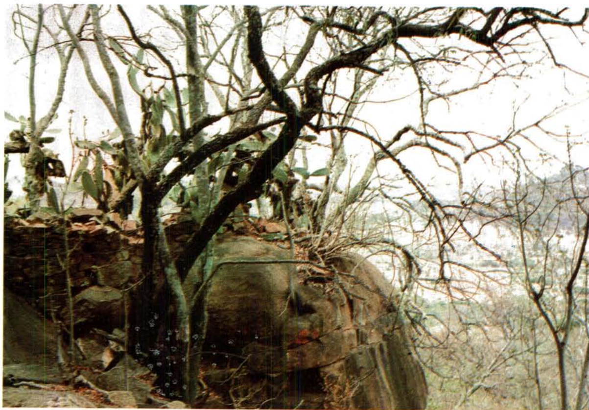
Soos hierdie foto aandui, was Nyabela se bergvesting uiters onbegaanbaar en kon dit maklik verdedig word