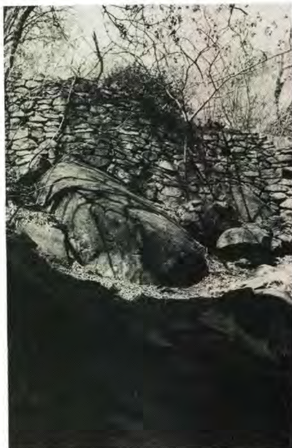
Klipmuurverskansings met skietgate by Erholweni

siediens verrig. Die landerye is teen die laer hange van die vestings aangebring terwyl water uit omliggende spruite en fonteine verkry is. 17 Die strategie van die Boeremagte was om die Ndzundza met behulp van die oprig van tydelike forte effektief te beleër en hulle so van hul voedselvoorrade af te sny, wat hul uiteindelik tot oorgawe moes dwing. 18