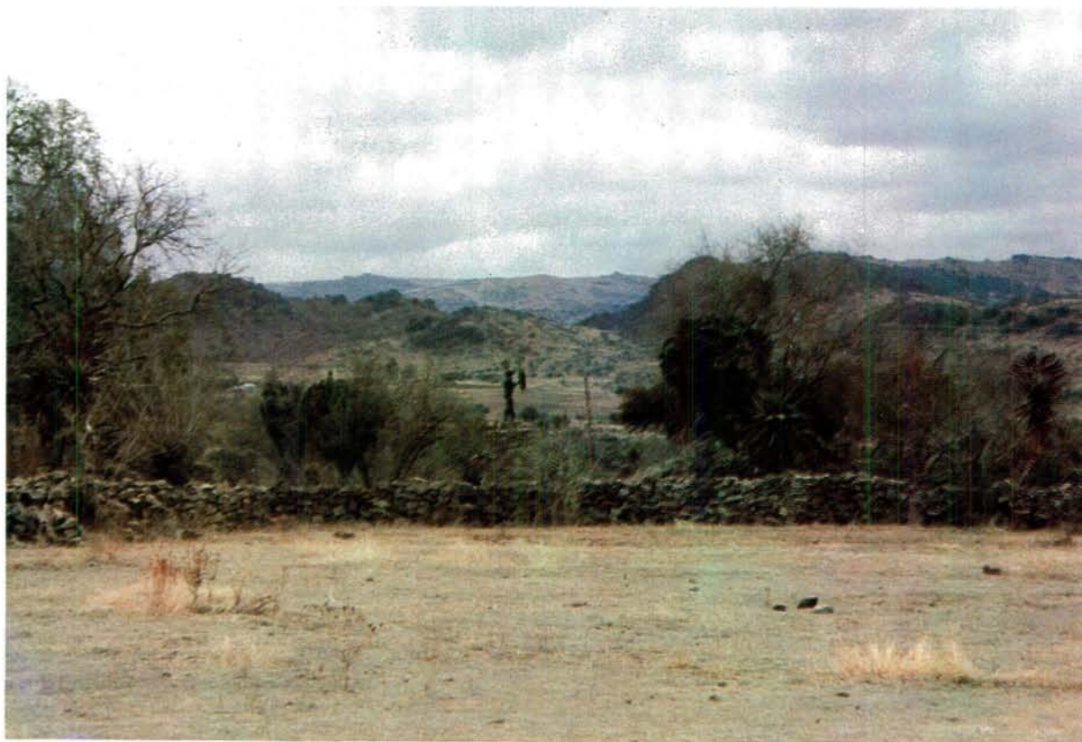
Die oop terrein onder Nyabela se bergvesting waar sy krygers gewoon het. Let op die standbeeld van Nyabela in die agtergrond