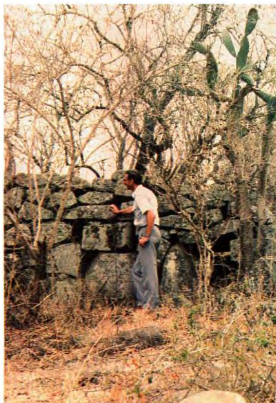
'n Deel van die skansmure wat deur die Ndebele om hul bergvesting opgerig is