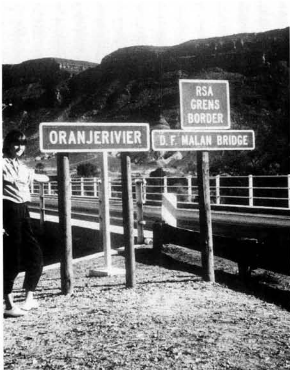
Die Oranjerivier vorm die suidelike grens van Suidwes-Afrika. Hier volg die grens die noordoewer van die rivier.

By die ou verdragopstellers was riviergrense byna net so gewild as geometriese grense. Ook hier was die rede voor-die-handliggend. Reisigers het dit maklik gevind om riviere eerder as ander topografiese gegewens op kaart aan te bring. Terselfdertyd is dit as lynvormige verskynsels gevisualiseer wat as akkurate verdeelingslyne gebruik kon word. Tog is riviere in werklikheid sones en nie 'n enkelvoudige lyn nie. Grensvasstellings kan dus op verskillende maniere plaasvind. Riviergrense kan dus of die mediaanlyn of die bevaarbare kanaal of een van die oewers of verskillende vaste punte ("running points") wat in die stroom bepaal word volg. Normaalweg volg grense die hoofkanaal of "thalweg" wanneer die rivier bevaarbaar is. Indien nie, word die mediaan- of swaartelynbeginsel gevolg (Pounds 1972; 88).