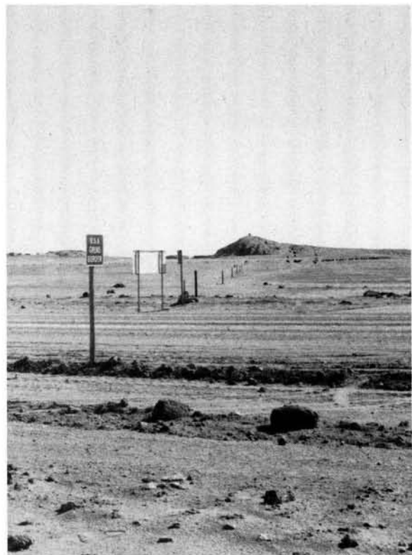
Pale en sandge vulde konkas vorm die geometriese grenslyn tussen die Walvisbaaigebied en Suidwes-Afrika digby die LMB Rooikop.

In die afbakening van die geometriese grens tussen die Kunene- en Kavangorivier is ooreengekom dat permanente bakens opgerig sou word wat nie verder as 10 kilometer van mekaar sou wees nie. Daar is ook onderneem om "minder permanente" bakens aan te bring waar paaie, voetpaaie, riviere, strome en "oshanas" en "mololas" die grens sou kruis. Terselfdertyd