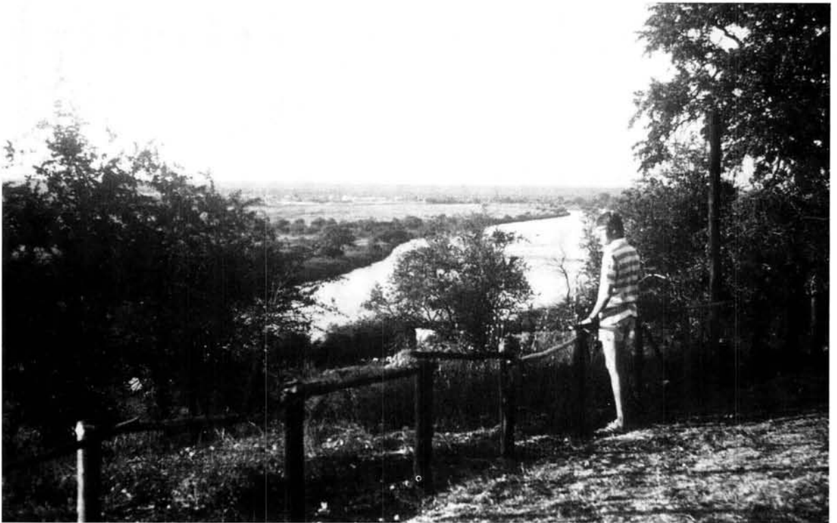
Die Okavangorivier vorm vir 'n gedeelte van die grens tussen Angola en Suidwes-Afrika. Hierdie foto is by Rundu geneem. In die agtergrond lê die nou verlate Angolese dorpie, Calai.

Soos reeds voorheen vermeld volg die grens vanaf Kakeri die middel van die Kavangorivier tot in die omgewing van Andara.