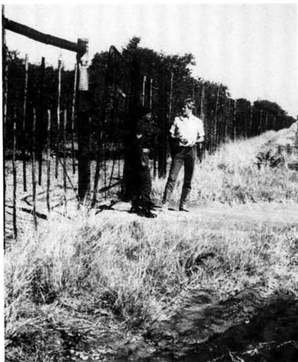
Die suidelike geometriese grenslyn ('n skuinslyn) van die Caprivistroom. Hierdie foto is by die Mohembohek digby die Okavangorivier geneem.

Tussen die Dikuju-eilandbaken en die Kwando- of Mashirivier is 23 bakens opgerig, terwyl nog sewe tussen die vermelde rivier en Katima Mulilo aangebring is. Onsekerheid het egter bestaan oor presies waar die grens die Kwandorivier moes kruis. Hierdie driepunt, presies daar waar die grondgebied van Angola, Zambië en Suidwes-Afrika bymekaarkom, is eers op 18 November 1954 deur Anglo-Portugese verdrae bepaal en op 21 Oktober 1964 nav notawisseling deur die Suid-Afrikaanse regering aanvaar (Kyk Brownlie 1979; 1027, 1292–1294).