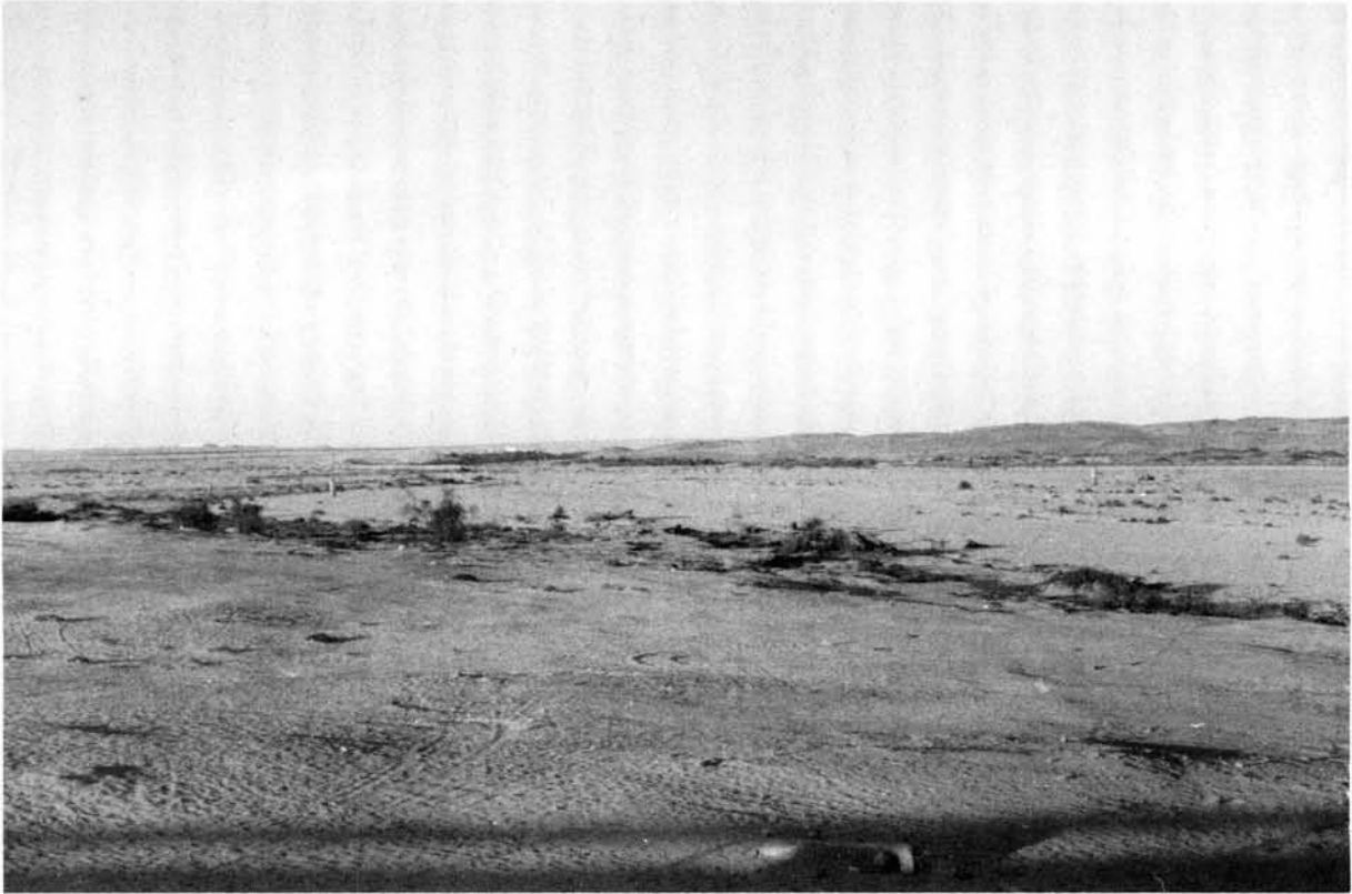
Die Walvisbaaigebied, 'n eksklawe van die Republiek van Suid-Afrika, word in die noorde dmv die droë Swakoprivierloop van Suidwes-Afrika geskei.

was) afgebaken. Die grens wat op hierdie wyse tot stand gekom het is op 29 April 1931 deur 'n notawisseling goedgekeur (Kyk hieronder).