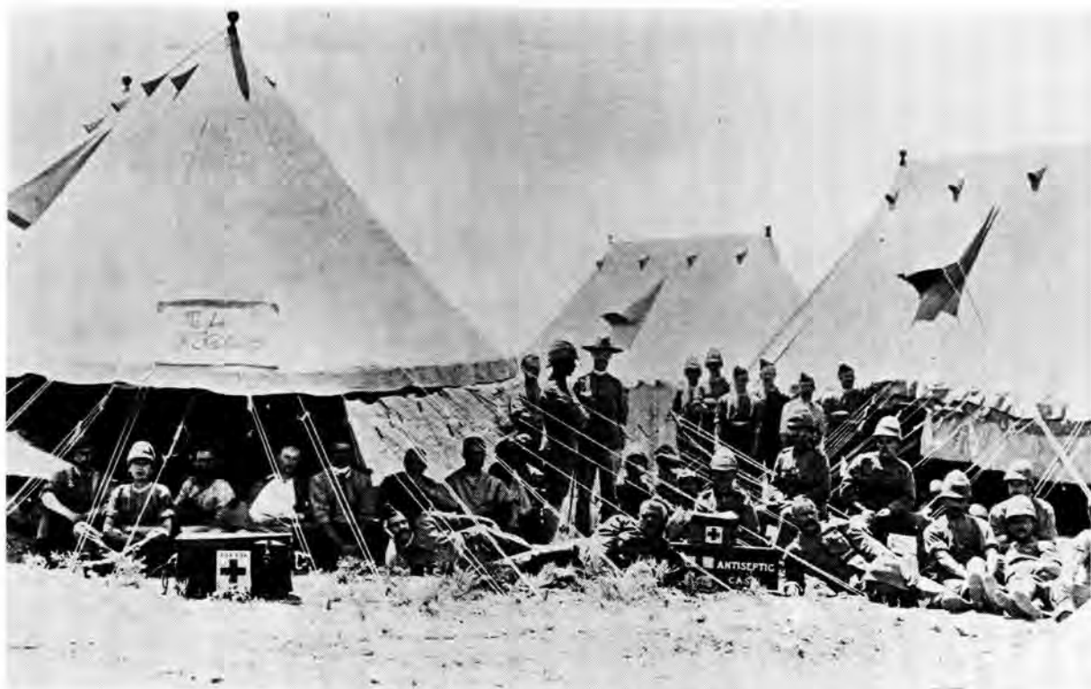
Britse veldhospitaal langs die Oranjerivier.

herstel nie. Hoe gedaan ek toe al was, kan seker begryp word, maar ek het niks daarop gesê nie; vir my het dit nie veel saak gemaak wat verder gebeur nie. Ek was moeg van die maandelange lyding in die hospitaaltentjie. Dit was beslis iets anders as die gerieflike hospitale van vandag met al die moderne hulpmiddels.