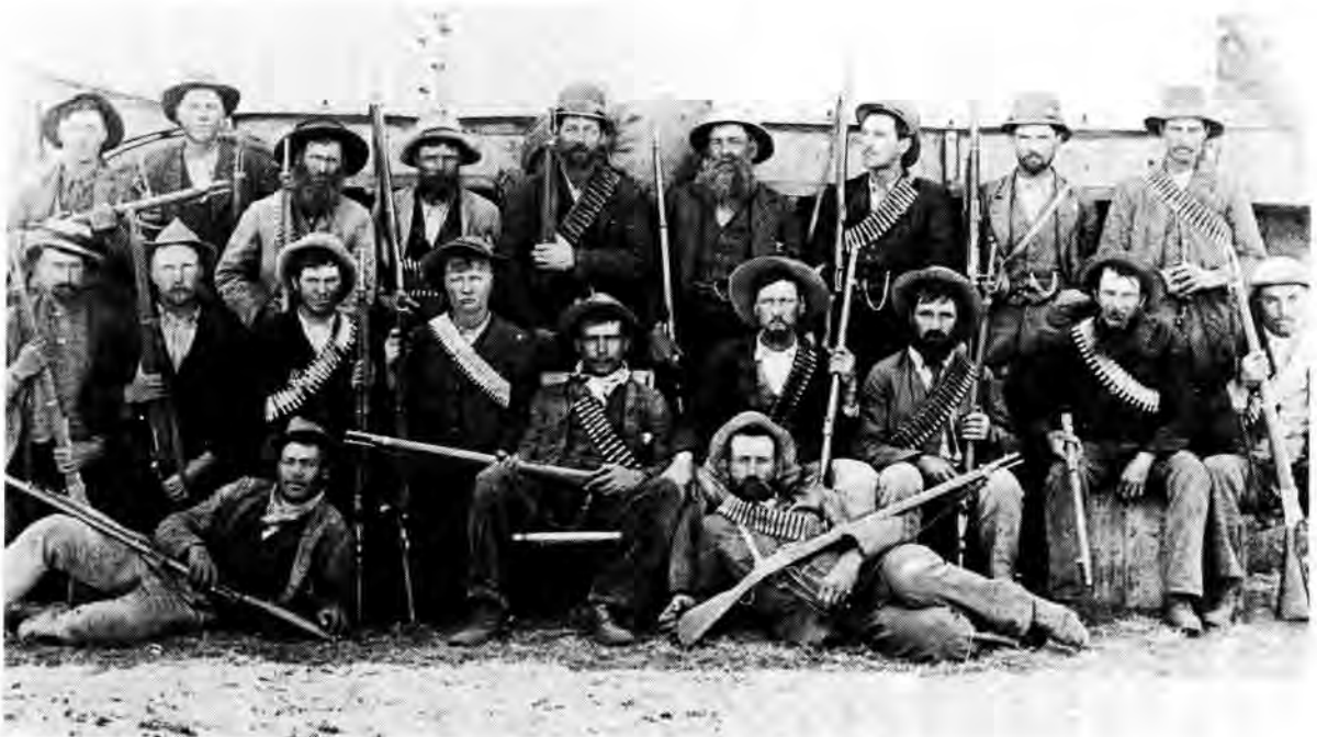
Groep Boere met gewere en bandoliere.

Die Engelse het toe weer 'n ramkraal gevorm, maar dié keer het dit nie so voorspoedig gegaan met my klompie burgers nie. Met die uitjaag het daar, as ek reg onthou, sestien van hulle in die slag gebly en is gevang. Dit was treurige nuus. Ek het my manne geken en geweet waartoe hulle in staat was, daarom kon ek dit byna nie glo nie. Sou die Engelse 'n nuwe taktiek ontwikkel het om die onverskrokkenheid van die Boer die hoof te bied?