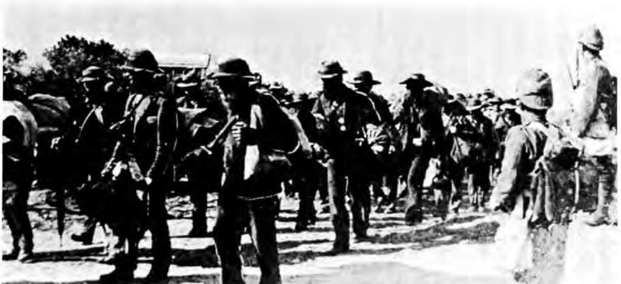
Aankoms van Boerekrysvangenes te Simonstad.

Die papbroekige gees het toe oral kop uitgesteek. Nog voor die twee van ons kommando weggedros het, het 'n betroubare vriend wat van generaal De Wet se kommando gekom het, my die volgende vertel: Hulle was tussen Kroonstad en Lindley toe daar op 'n dag twee kêrels aangery kom. Die generaal het dadelik vermoed dat alles nie pluis was nie, hulle gevang en by die kommando gehou. Toe het dit gebeur dat die Engelse skielik opdaag en daar moes haastig opgesaal word. Die twee is aangesê om hulle kar self in te span en baie gou ook, maar hulle was so tydsaam as wat moontlik was. Die een wou glad eers in die spruitjie gaan was, voordat hulle gaan. Dit was natuurlik duidelik dat hulle tyd probeer wen het om weer tussen die Engelse