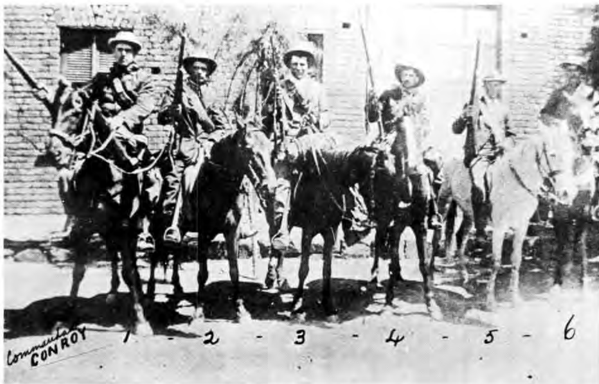
Lede van 'n Kommando.