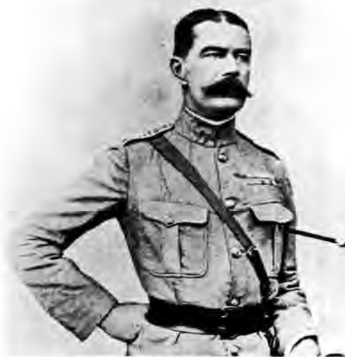
Lord Kitchener.

Daar is verneem dat lord Kitchener per trein van die Kolonie af sou kom en toe hulle seker was van die dag van sy aankoms op Kroonstad, is ons aangesê, almal wat moontlik kon loop, om op die stasie te wees as hy arriveer. Die stasie was nou wel naby die hospitaal, maar ek was behoorlik vies vir die affêre. Daar was egter geen salf aan te smeer nie en ek het saam met die tommies ingeval.