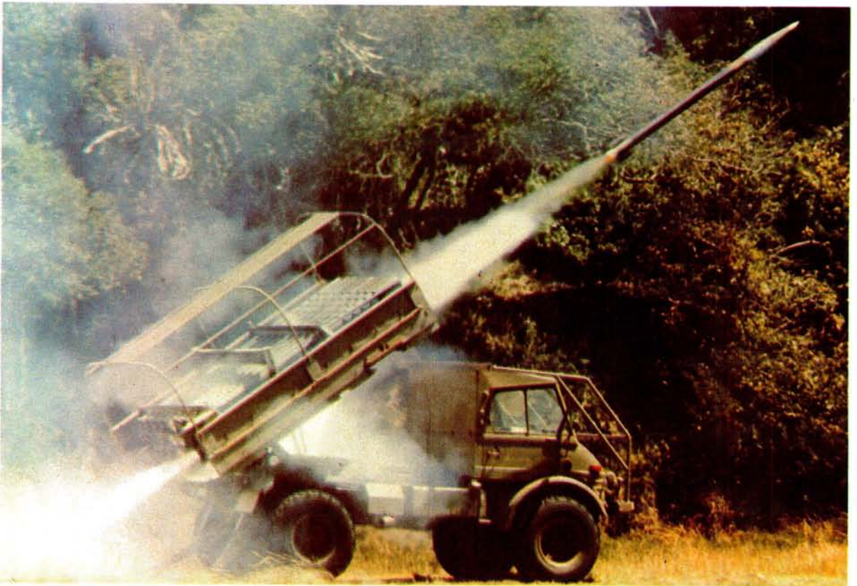
Die Valkiri 127-mm meervoudige vuurpyllanseerder is plaaslik vir die Suid-Afrikaanse Leër ontwikkel as teenvoeter vir die Russiese BM-21 stelsel wat die Suid-Afrikaanse magte probleme gedurende Operasie Savannah besorg het. Die Valkiri is sedert 1981 met groot welslae in operasies aangewend