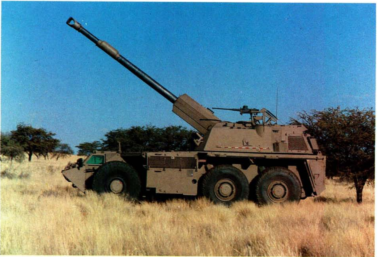
Die G6-sefaangedrewe medium kanon is deur KRYGKOR ontwikkel en is gebore uit die ervaring van die Suid-Afrikaanse Artillerie in Operasie Savannah en latere krygsoperasies