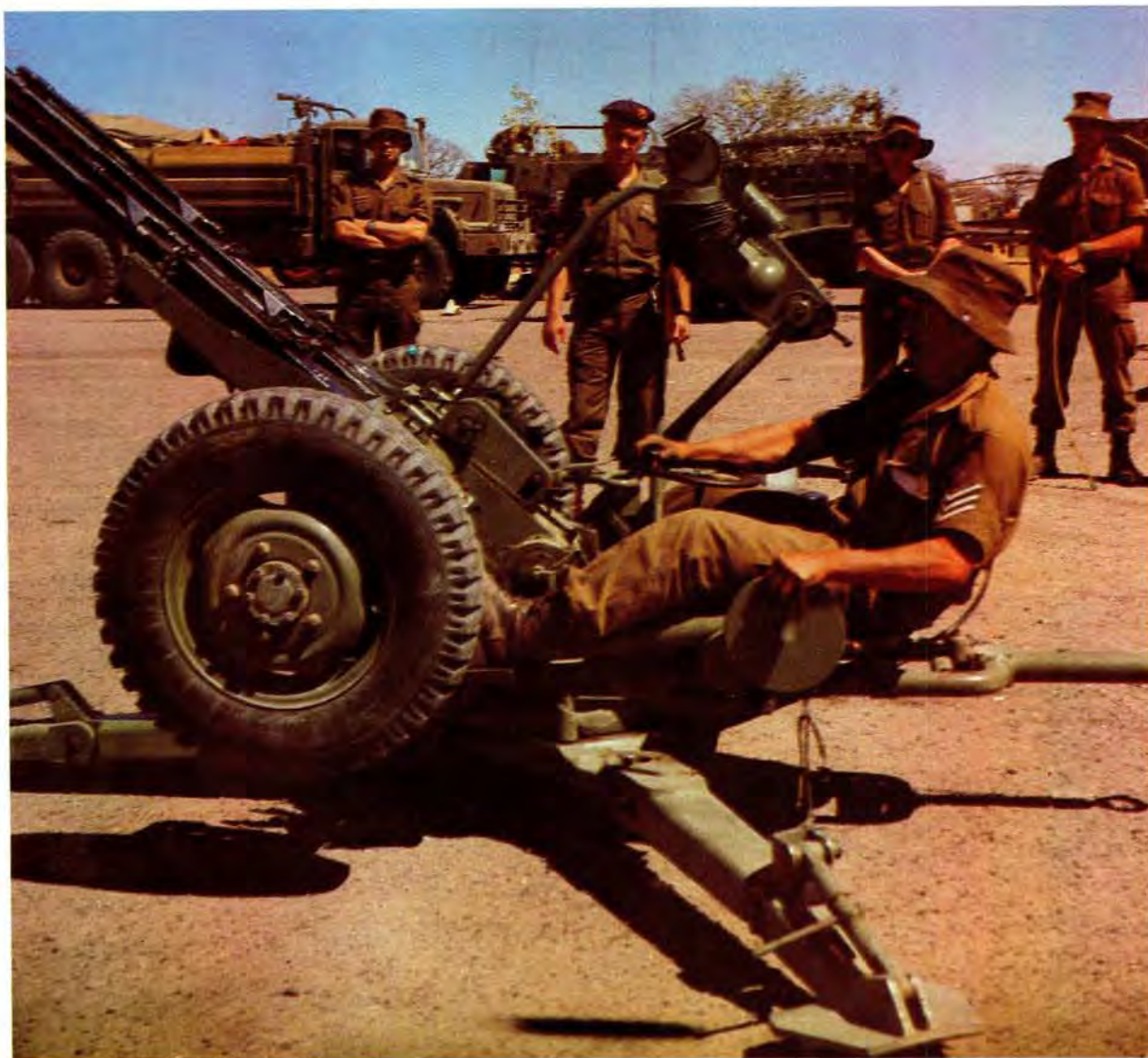
Lede van die Suid-Afrikaanse magte by 'n lugafweerkanon wat in 'n operasie van SWAPO gebuit is

heidsmagte se 21 ongevale in Operasie Askari is tydens hierdie botsing gely.