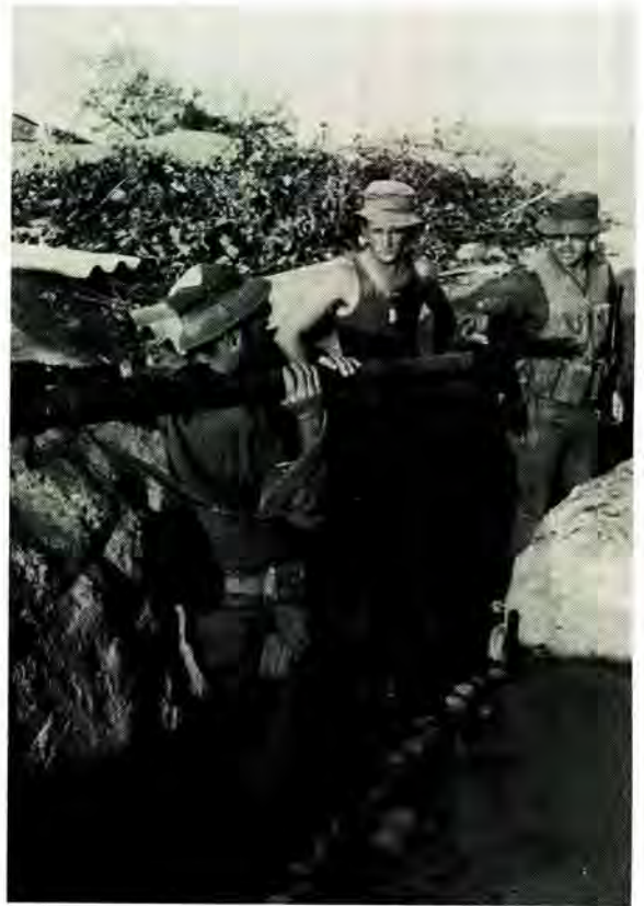
'n Suid-Afrikaanse soldaat met 'n buitgemaakte geleide SA-7 grondlugmissiel-lanseerder in 'n loopgraafstelsel by Xangongo. Die foto is tydens Operasie Protea geneem

In hierdie tyd het FAPLA self ook 'n meer uitdarende houding teenoor die veiligheidsmagte ingeneem. Sy lugverdedigingstelsel het 'n besliste