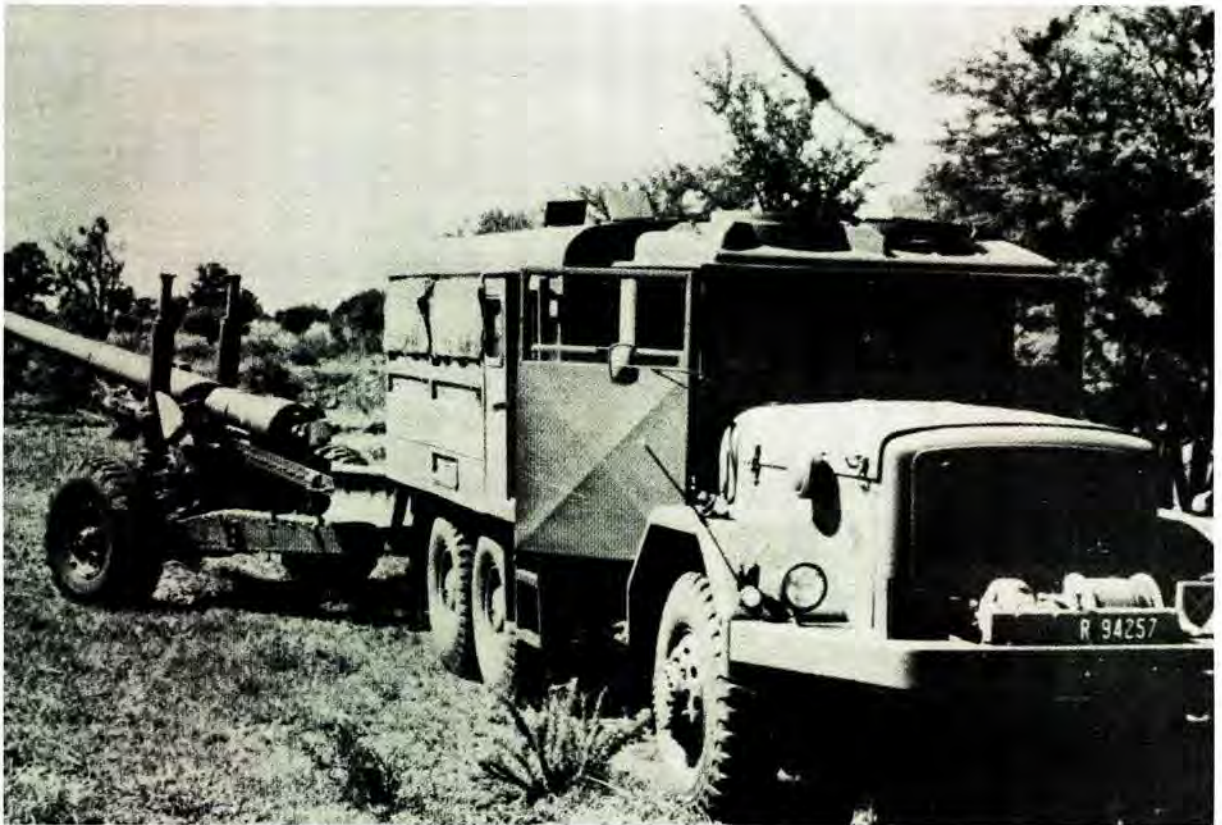
'n 140-mm kanon word deur 'n Magirus Deutz gedurende die veldtog in Angola (Operasie Savannah) gesleep

1976 was die onttrekking afgehandel. Burgermagineenhede wat as vier veggroepe in Suid-Angola ontplooi is om die Calueque/Ruacana-waterskema en vlugtelingskampe te beskerm, het Angola op 27 Maart 1976 verlaat.