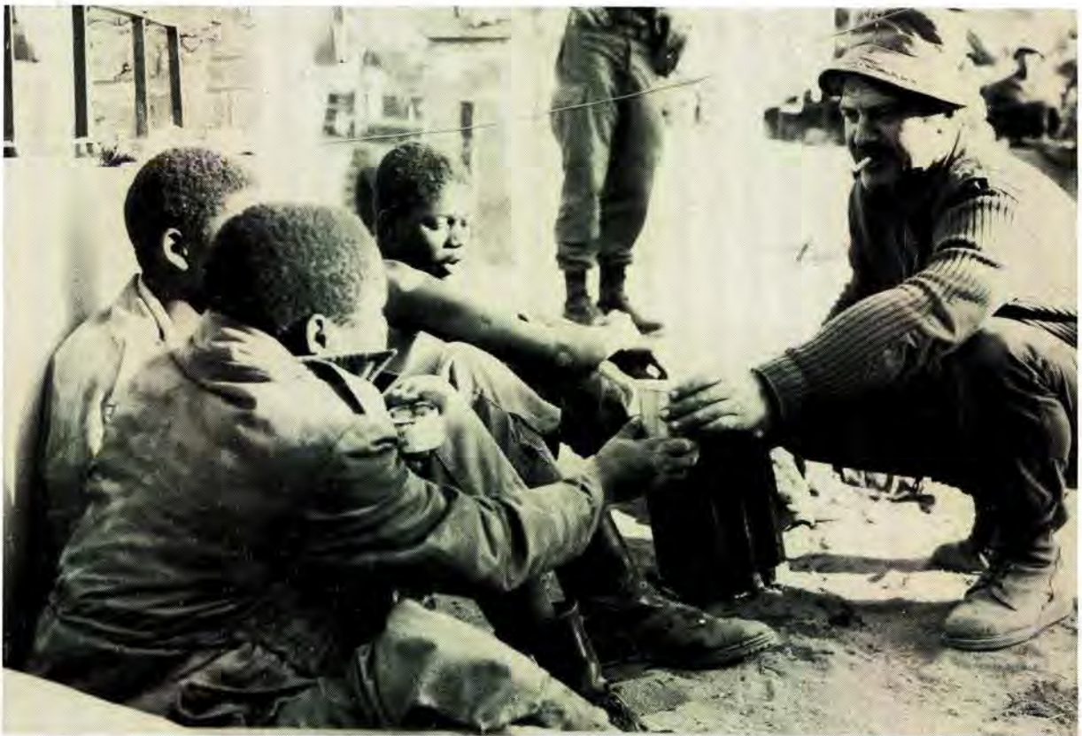
'n Offisier van die Suid-Afrikaanse magte gee kos en water aan drie SWAPO-terroriste wat tydens 'n voorsprongoperasie in Angola gevang is

122mm vuurpyle. Een hiervan het deur die dak van 'n kaserne gedring en 10 soldate gedood.