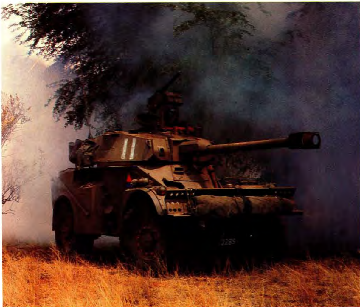
Die Eland 90-pantserkar, die Suid-Afrikaanse magte se primêre pantserwapen in operasies in Angola en Suidwes-Afrika

voorsiening gemaak vir die staking van alle vyandelikhede in die gebied vanaf 10 Augustus 1988. Tweedens moes onverwyld 'n aanvang gemaak word met die onttrekking van vreemde magte aan Angola. Suid-Afrika het die onderneeming gegee dat die onttrekking van sy magte op 1 September 1988 afgehandel sou wees.