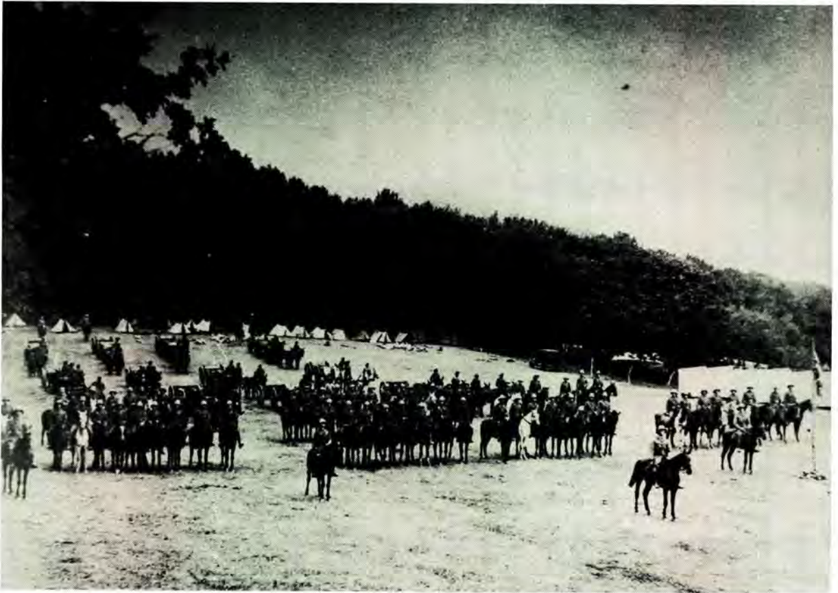
Die kamp van die THA te Grootte Schuur (Kaapstad) net voor hul vertrek na Duits-Suidwes-Afrika in Januarie 1915

ingevolgte die mandaatstelsel onder SA se administrasie geplaas is.