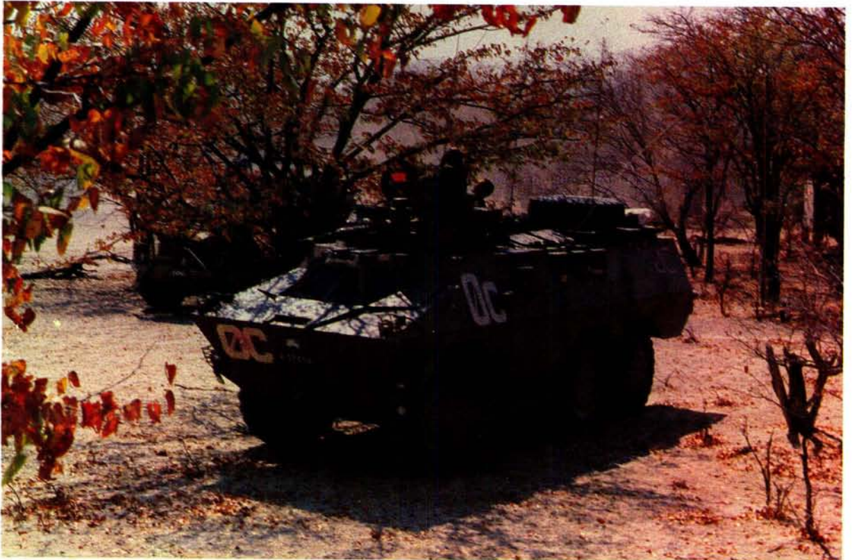
'n Ratel-infanteriegevegsvoertuig in die suide van Angola tydens 'n militêre operasie teen SWAPO-terroriste. Die Ratel-infanteriegevegsvoertuig is die troepedraer van die gemeganiseerde infanterie. Die Ratel is met groot welslae in voorsprongoperasies soos onder meer Operasie Reindeer teen SWAPO-basisse aangewend