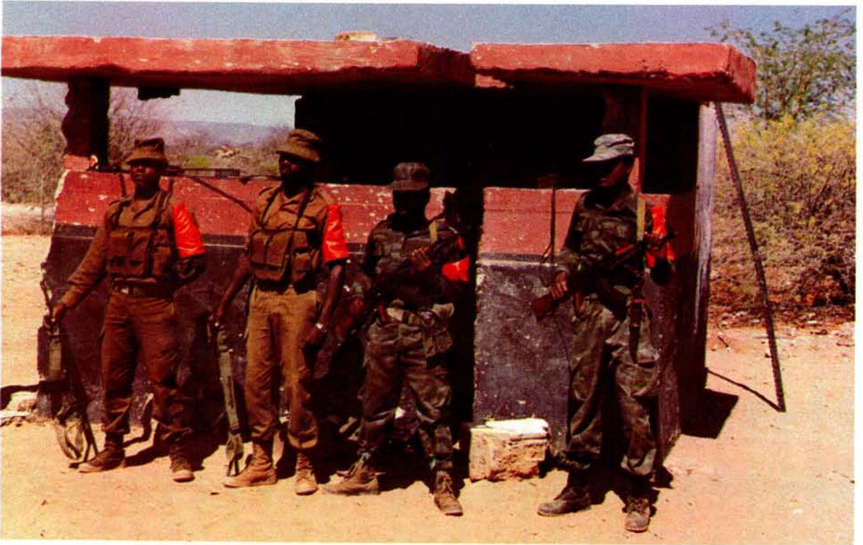
Militêre personeel van die Gesamentlike Militêre Kommissie wat op 30 Augustus 1988 tot stand gekom om die onttrekking van Suid-Afrikaanse magte aan Angola en die staking van vyandelikhede te monitor. Die foto is by 'n grenspos naby Ruacana geneem