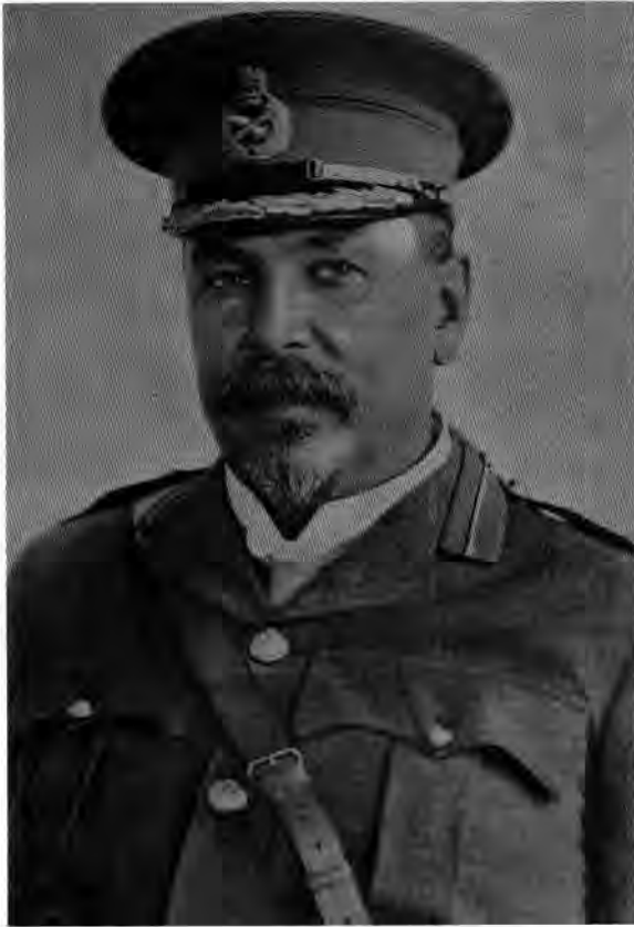
Generaal Louis Botha (1862–1919)

ties, maar terselfdertyd onpartydig en onbevooroordeeld. Hy het ook beklemtoon dat hy sy verhaal eers geskryf het nadat hy al die beskikbare boustowwe sorgvuldig bestudeer, gewik en geveeg het.