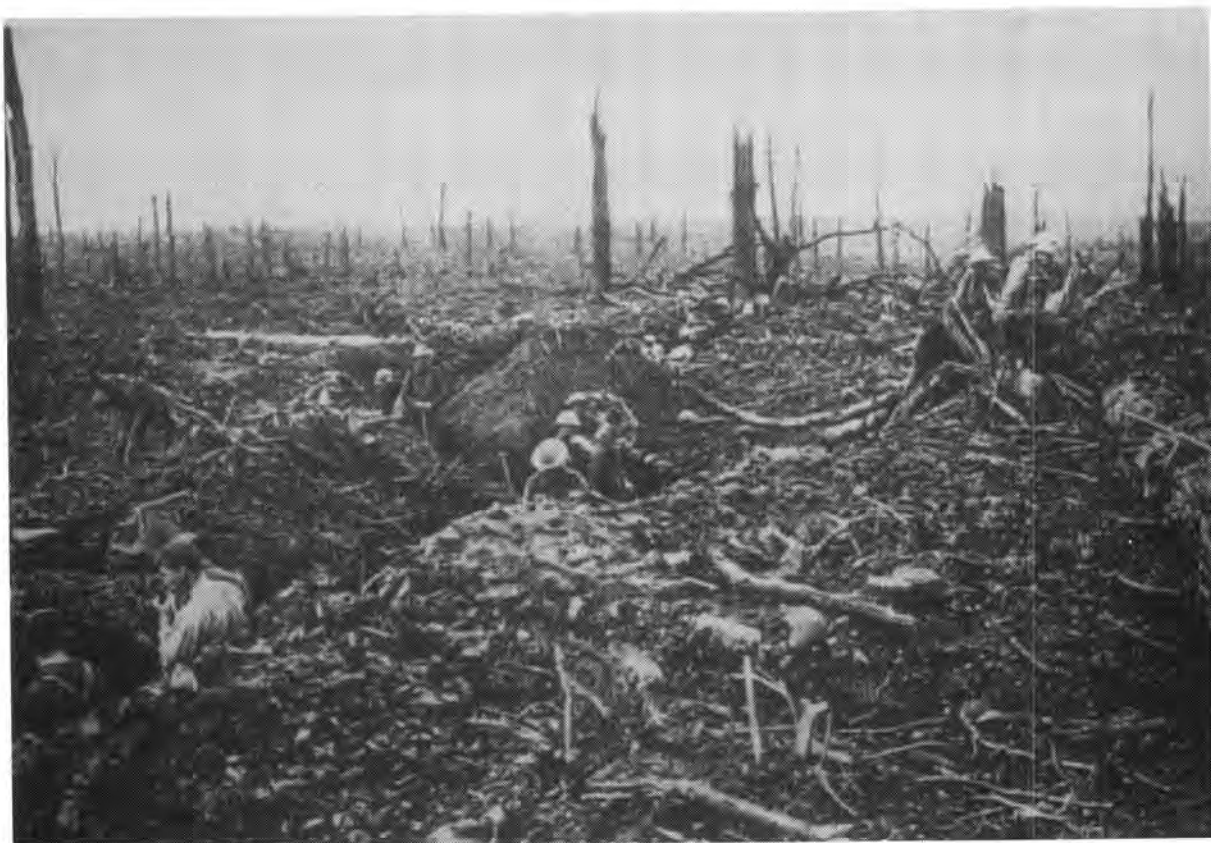
Delvillebos

Daar is voldoende aandag aan dié gedeelte van die veldtog in Duits Oos-Afrika gewy wat op die oornam van die opperbevel oor die geallieerde magte deur lt-genl J.C. Smuts (1870–1950), in Februarie 1916, gevolg het. Soos bekend het genl Von Lettow Vorbeck en sy troepe die wapens op 25 November 1918 by Abercorn neergelê.