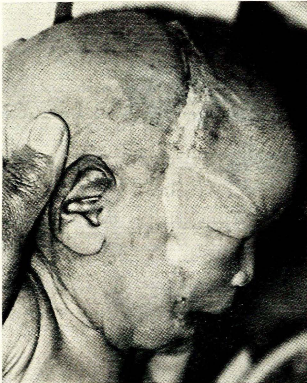
Afb. 1. Litteken wat vanaf mondhoëke opwaarts oor die kop strek.

is uit die stoelgang geïsoleer en die pasiënt is met gentamisien behandel—5,0 mg twee keer per dag binnespiers asook 2,5 mg twee keer per dag per mond. Die diarree het aanvanklik verbeter, maar toe weer vererger. Die baba se toestand het geleidelik versleg en hy is na 22 dae oorlede. Toestemming vir 'n lykskouing kon nie verkry word nie.