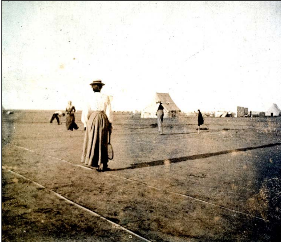
FIGUUR 2. GEMENGDE DUBBELSPEL AAN DIE GANG IN KROONSTAD

voorberei. Die kamp se superintendent, Russel Deare, was die voorsitter van die tennisklub met 42 lede. Die ledetal was dus relatief klein in ag genome dat daar amper 5 000 mense in die kamp was. Die kinders het na 08:00 'n bietjie gespeel. Die res van die dag het aan Deare en sy klublede behoort (Le Roux, 1979:1, 15).