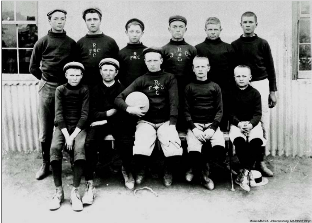
FIGUUR 1. DIE SOKKERSPAN VAN ALIWAL-NOORD SE KAMPSKOOL (MuseumAfrica, MA661993P10). DIE FC EN RC OP DIE BORS HET WAARSKYNLIK NA DIE KLUB VIR DIE TWEE VOETBALKODES VERWYS.

In Barberton het die kinders in groepies by die “gevlegte heining” bymekaar gekom om te speel. Voetbal is sommer met ’n melk- of ander tipe blik gespeel (Van Schoor & Coetzee, 1982:6). Dit moes waarskynlik kort na hul aankoms in die kamp gewees het, voordat speletoerusting verskaf en ’n speelterrein uitgelê is, want teen Januarie 1902 is na skoolure o.a. voetbal gespeel op ’n stuk grond wat vir hierdie doel voorberei is (T.A.B., DBC/12, March 1902:3). Dit moet die kampowerhede ter ere nagegee word dat hulle voetbal aangemoedig het deur die nodige infrastruktuur te skep. So byvoorbeeld verklaar kampinspekteur C.E.W. Sands se verslag vir Maart 1902 dat voetballe aan die seuns in die Barberton-kamp verskaf is (T.A.B., DBC/12, March 1902:13). Die soldate het ook as voorbeeld gedien. In die Heilbron-kamp het hulle gereeld in die straat voetbal gespeel. Een kampinwoner herinner hom daaraan dat hulle hom op ’n dag met die bal teen die kop geskop en hy bly lê het, waarop sy ma met hulle geraas het (Raath, 2002:110).