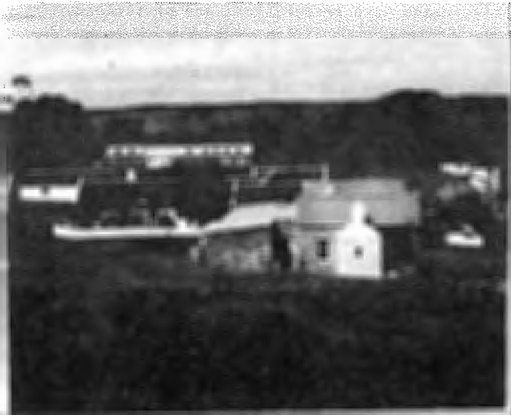
FIGUUR 2 Plaas en sentrum