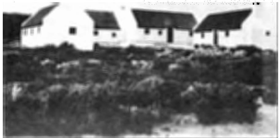
FIGUUR 3 Koppie-Alleen-sentrum