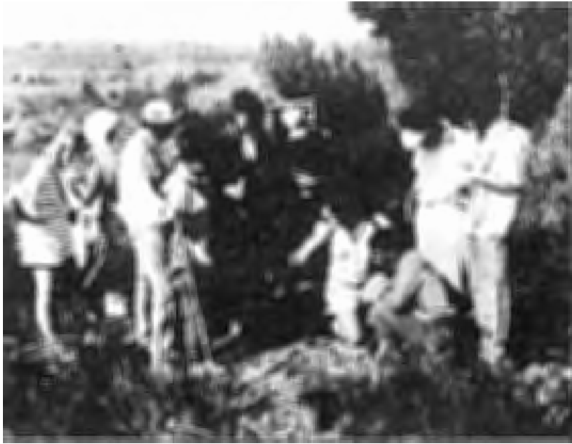
FIGUUR 1 a & b Potberg ervaring