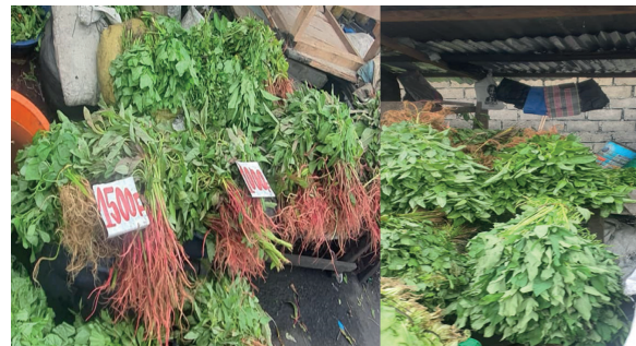
Figure 2. Photos prises par Mukeba F. montrant la vente d'amarante dans le marché de Kitambo.

Les 4 marchés ont été choisis sur base des recommandations de études antérieures (Ngweme et al. , 2020 ; 2021b). Il s'agit des marchés se trouvant dans le Camp Kokolo (noté Ko ), dans la commune de Bandalungwa (noté Ba ), dans la commune de Kitambo (noté Ki ), et dans la commune de Ngiri-Ngiri (communément appelé wenza ya Bayaka, noté Ng ). Les amarantes vendues dans ces marchés sont produites dans des différents sites maraîchers de la Ville de Kinshasa. L'échantillonnage des feuilles d'amarante à partir de ces marchés a eu lieu en mars 2021 (saison de pluie) et en juillet 2021 (saison sèche). Pour chaque marché et au cours de chaque saison, des échantillons ont été prélevés en triplicata auprès de 3 vendeurs sélectionnés au hasard (par exemple Fig. 2). Chaque réplique consistait à prendre environ 500 g des feuilles d'amarante et homogénéisées pour former un échantillon composite. Après le prélèvement, les échantillons ont été stockés dans une glacière et transportés immédiatement au laboratoire de la Faculté des Sciences de l'Université de Kinshasa pour des traitements préliminaires (lavage à l'eau déminéralisée et pesée). Les échantillons ont été ensuite congelés et envoyés au laboratoire du Département F.-A. Forel (Université de Genève, Suisse) pour analyse des métaux toxiques.