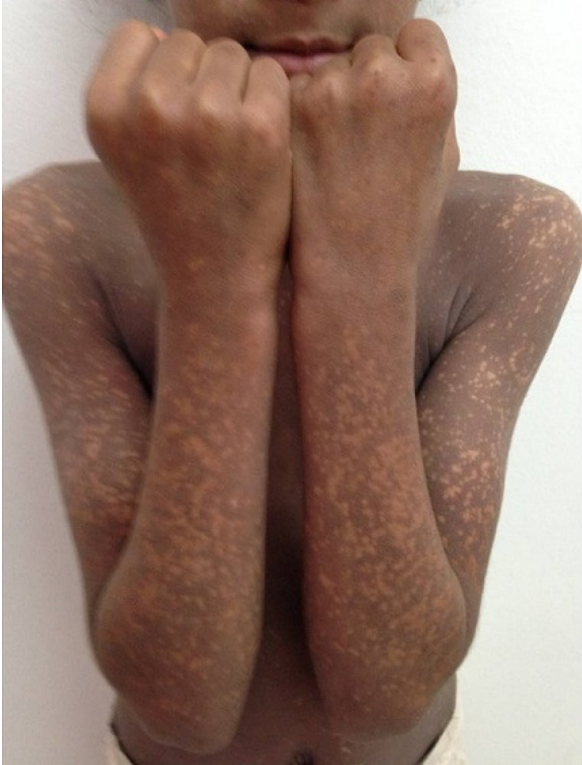
Figure 2: Papules brillantes et réticulées de la face antérieure des avant bras