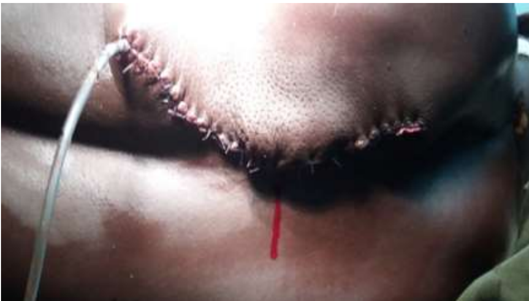
Figure 4: plaie opératoire