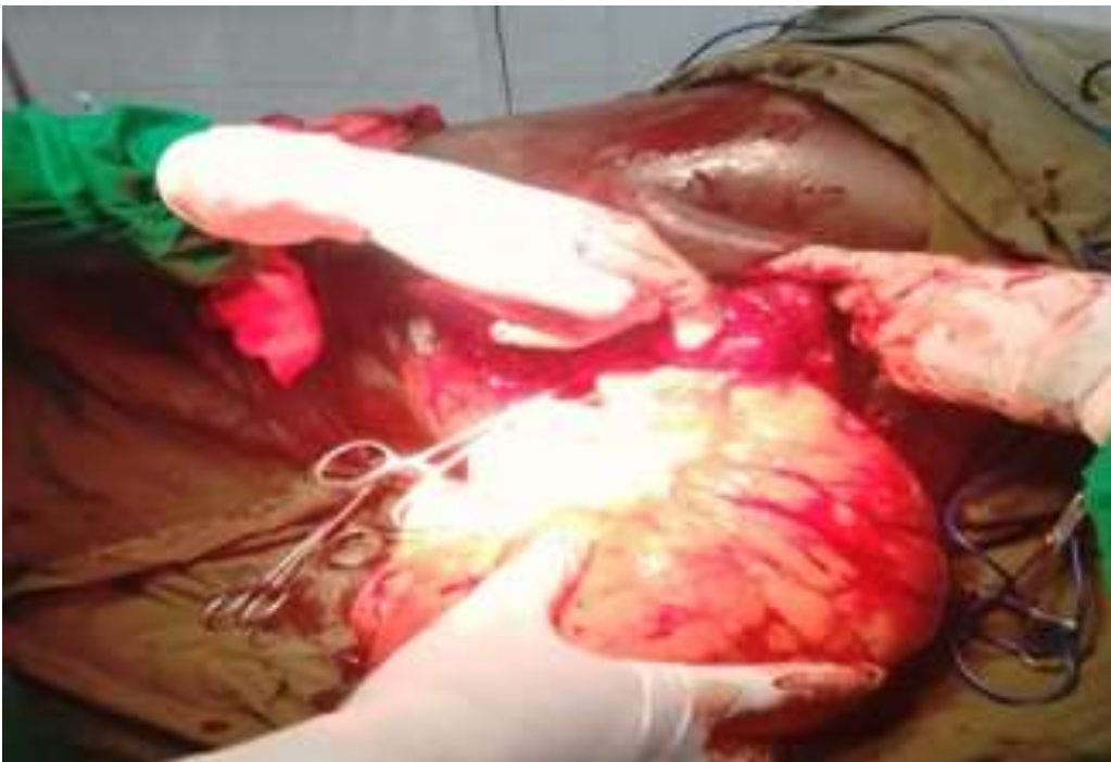
Figure 3: énucléation du lipome (base d'implantation du lipome sur le thorax)