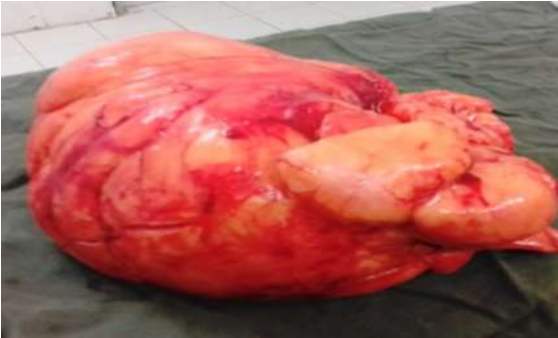
Figure 5: pièce opératoire