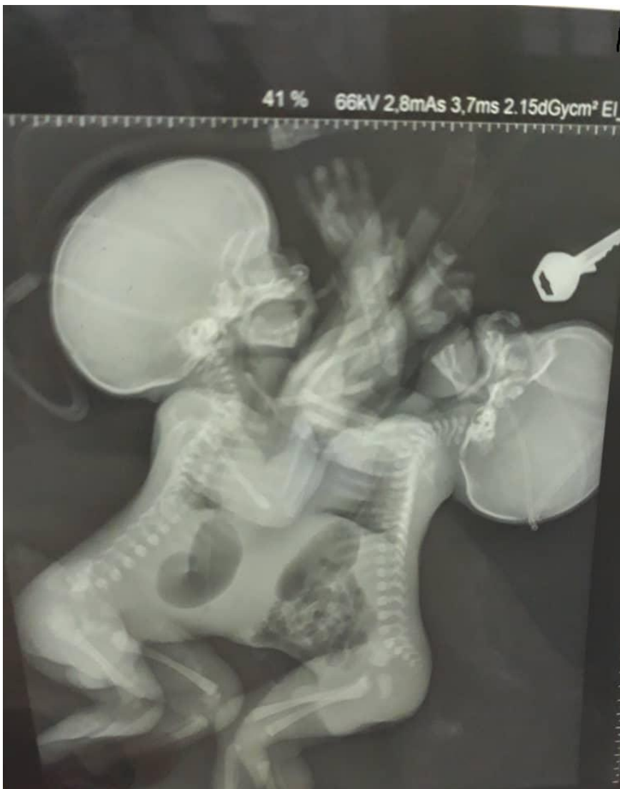
Figure 4: radiographie ASP (abdomen sans préparation) des jumeaux conjoints montrant des anses intestinales déviées à gauche