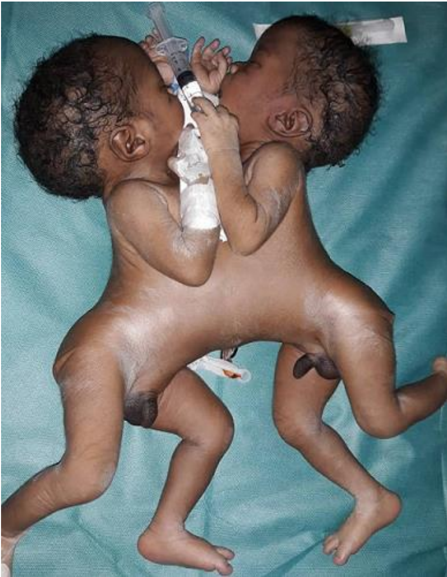
Figure 1: jumeaux conjoints thoracopage après extraction en post natal, vue d'ensemble