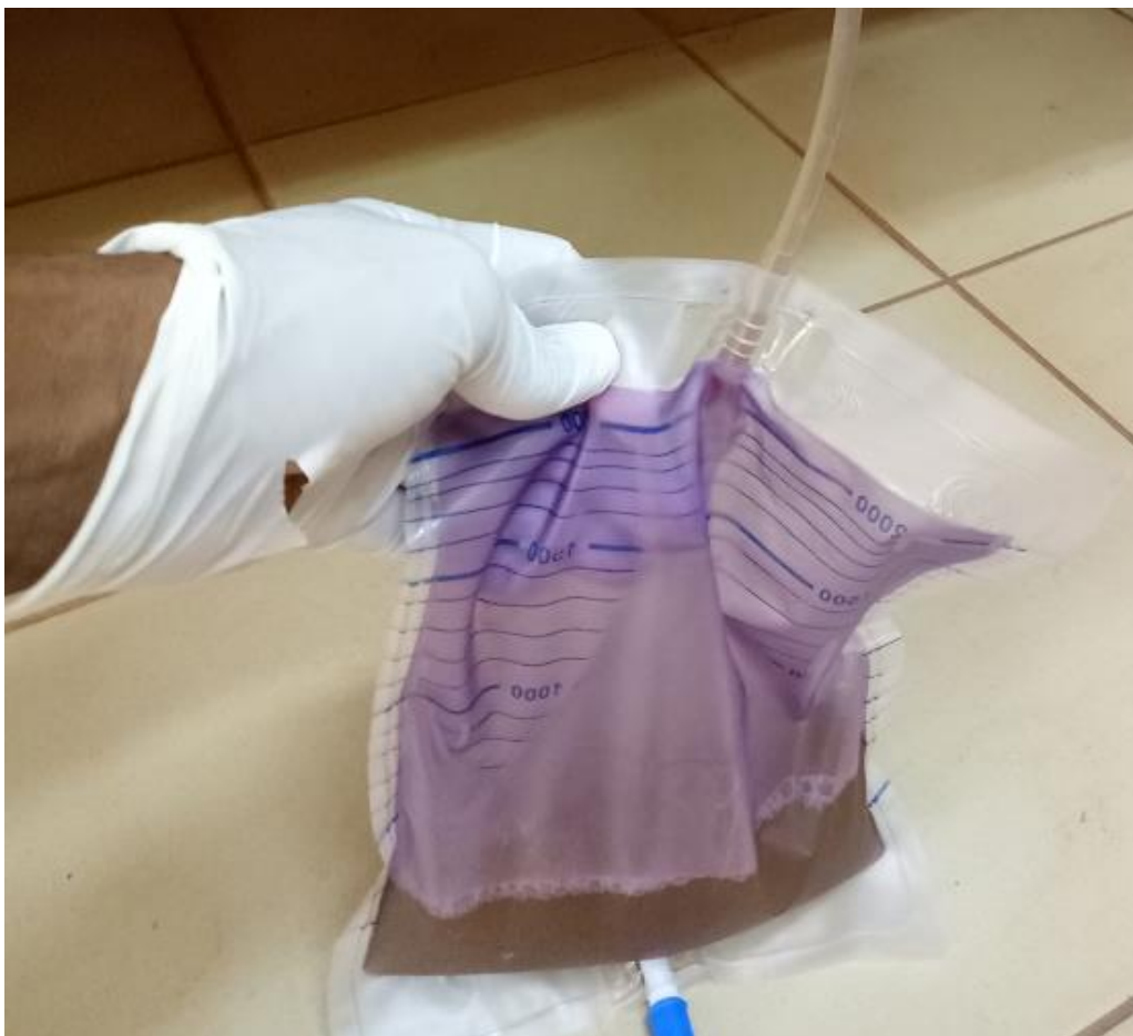
Figure 1: coloration violette de la poche collectrice avec urines troubles