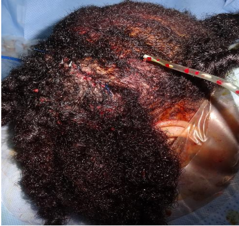
Figure 5: photo finale après suture sur drain aspiratif