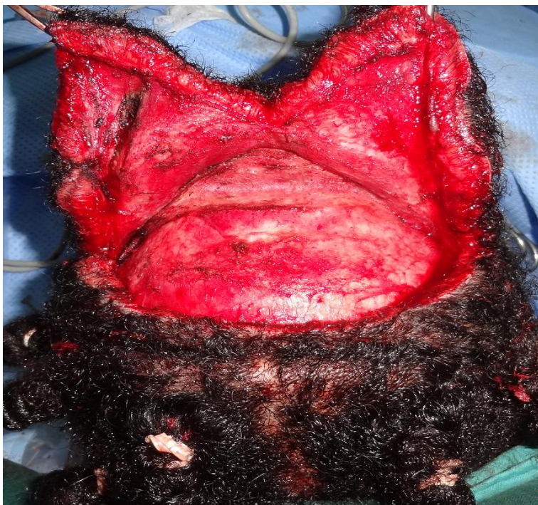
Figure 2: photo après incision coronale sur le vertex et le scalp pariétal, complétée par une incision sagittale médiane sur le scalp occipital, puis décollement des lambeaux pariéto-occipitaux dans le plan sous-galéal: nous avons remarqué sur ces lambeaux décollés une hyperplasie du tissu adipeux sous-cutané