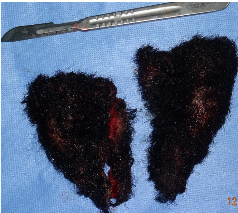
Figure 4: l'excédent cutané réséqué