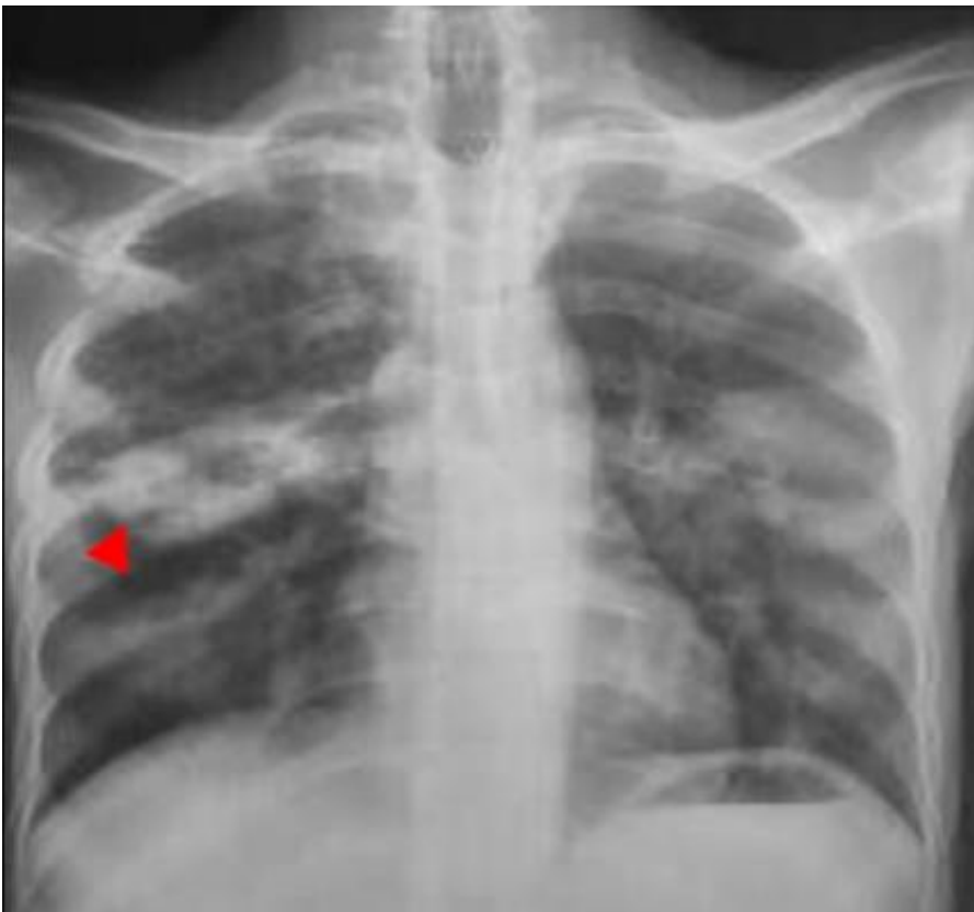
Figure 1: radiographie pulmonaire face montrant une image cavitaire avec une paroi opaque para-hilaire droite (tête de flèche), avant le traitement