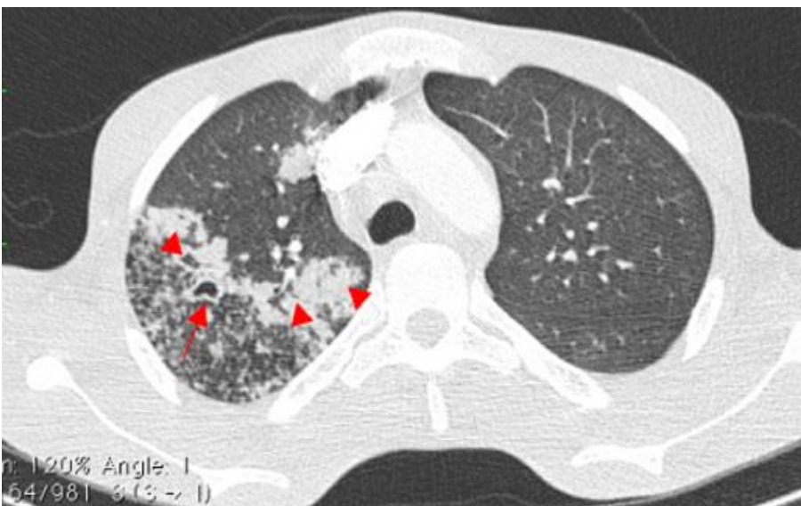
Figure 2: coupe axiale TDM thoracique en fenêtre pulmonaire mettant en évidence des foyers de condensations alvéolaires (têtes de flèche) avec une lésion excavée apicale droite (flèche)