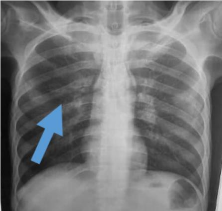
Figure 5: radiographie pulmonaire au bout de 6 semaines de traitement antituberculeux régression de la lésion cavitaire