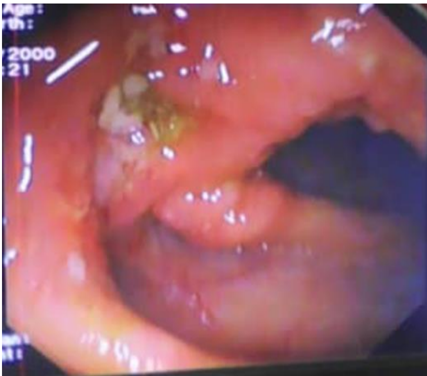
Figure 4: coloscopie totale avec masse ulcéro-bourgeonnante du colon droit