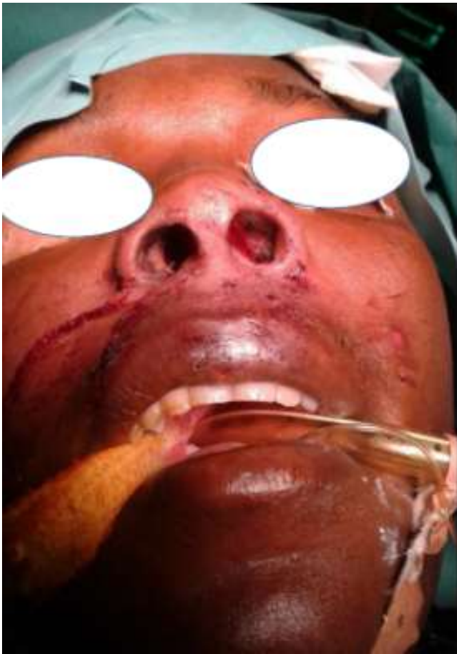
Figure 3: aspect post opératoire précoce, perméabilité des vestibules narinaires restaurée