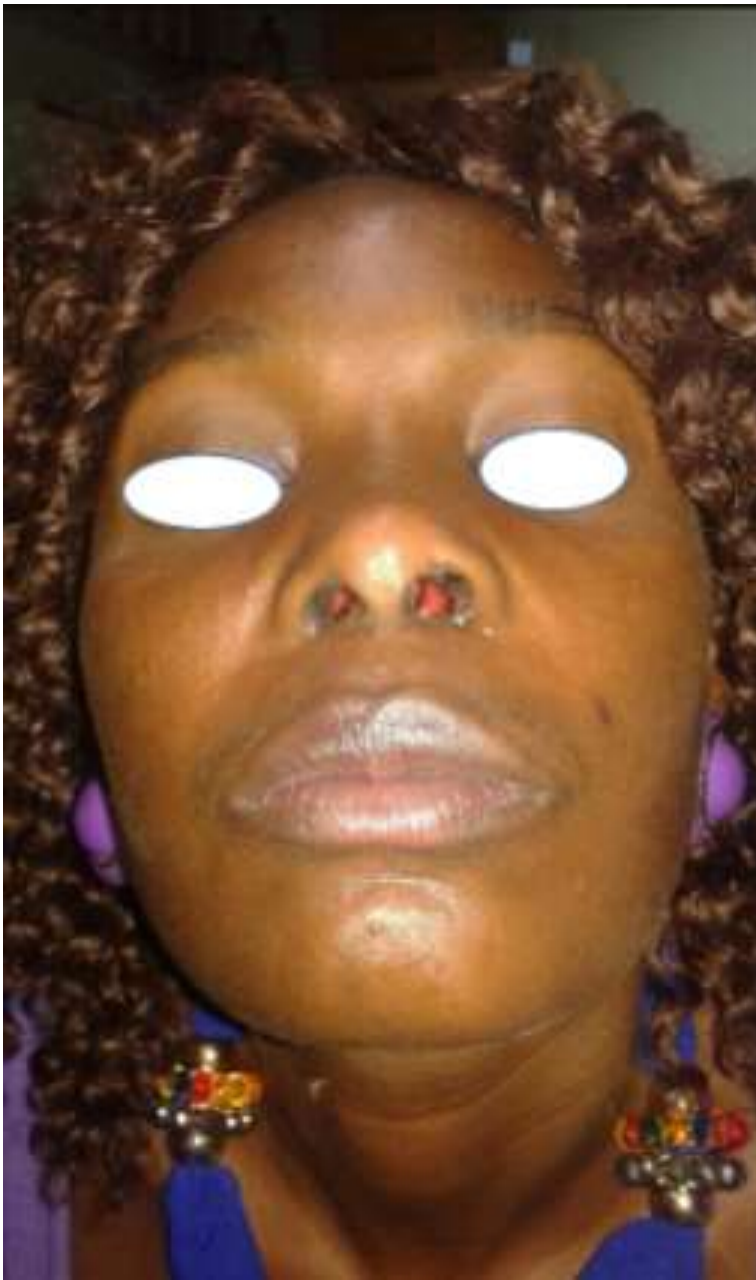
Figure 4: six mois post opératoire aucune récurrence notée