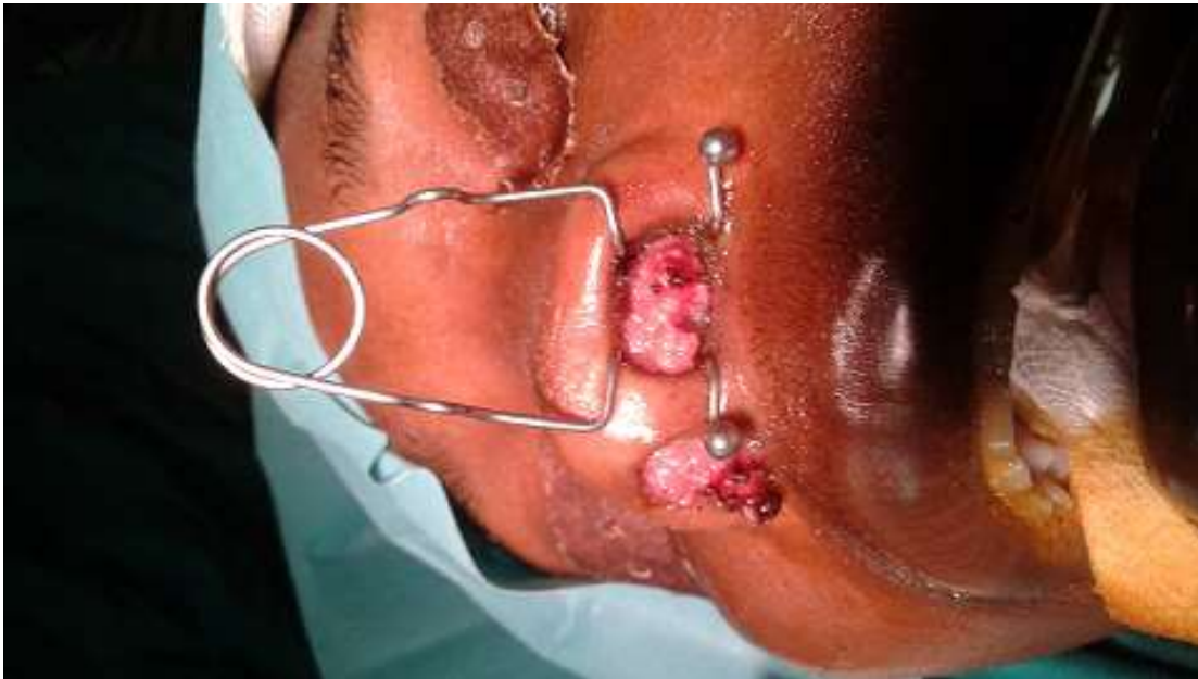
Figure 1: masses aspect crêtes de coq dans le vestibule narinaire en pré opératoire