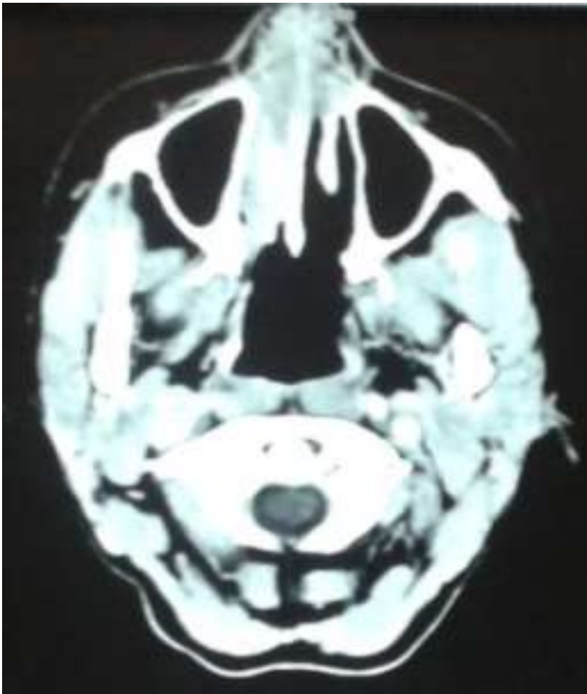
Figure 2: aspect scannographique en préopératoire, hyperdensité occupant les vestibules narinaires et toute la fosse nasale droite