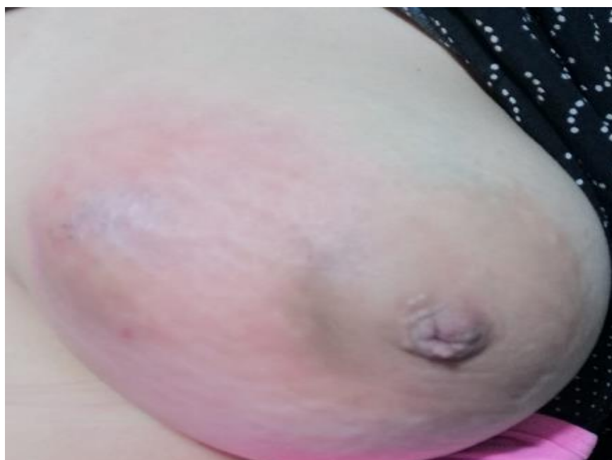
Figure 4: aspect macroscopique du sein gauche montrant une tuméfaction du sein gauche révélant une mastite granulomateuse