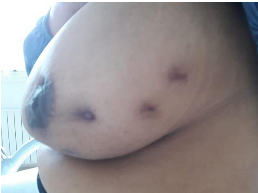
Figure 2: aspect macroscopique du sein gauche montrant l'évolution favorable après drainage chirurgical et traitement anti inflammatoire, avec persistante des cicatrices d'orifices de fistulisation