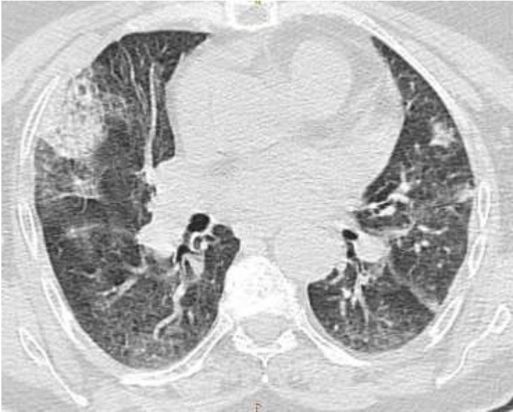
Figure 2: TDM thoracique en coupe parenchymateuse révélant une condensation alvéolaire avec des opacités en verre dépoli